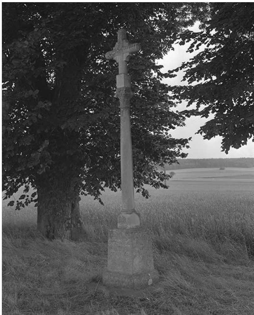
Croix de chemin, dite croix Saint-Marc.