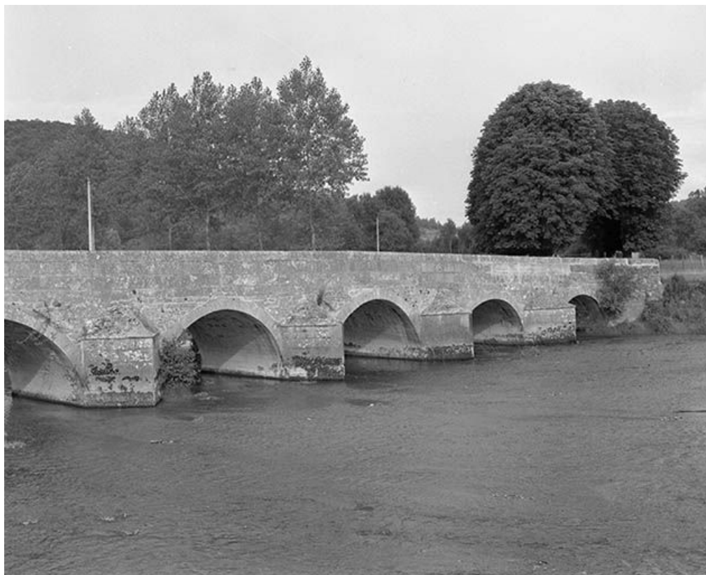
Pont sur l'Armançon (pont routier).