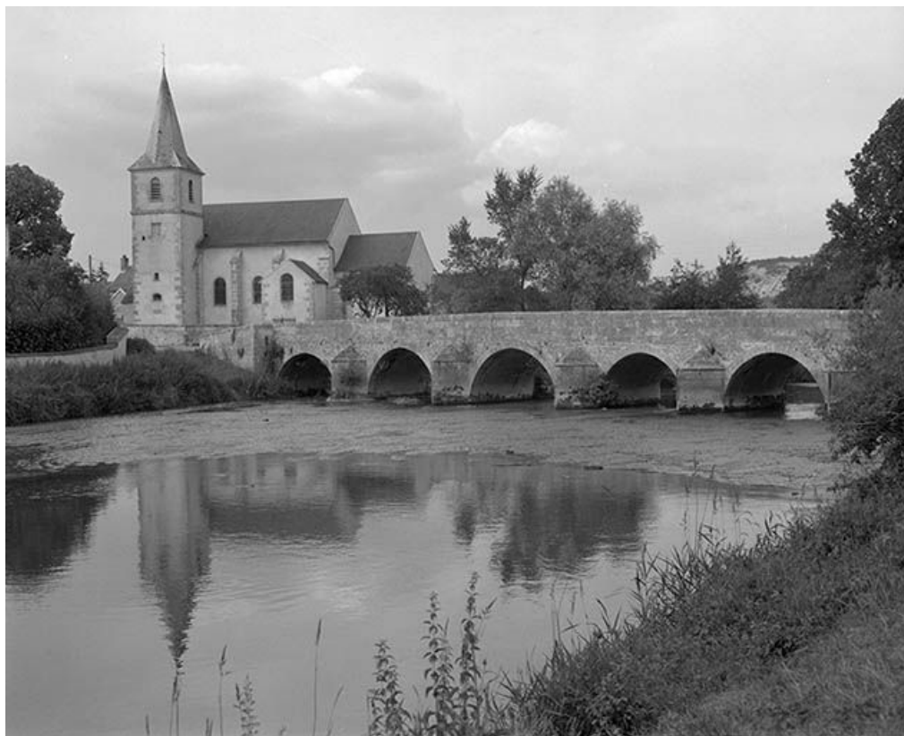
Pont sur l'Armançon (pont routier). En arrière plan, l'église.