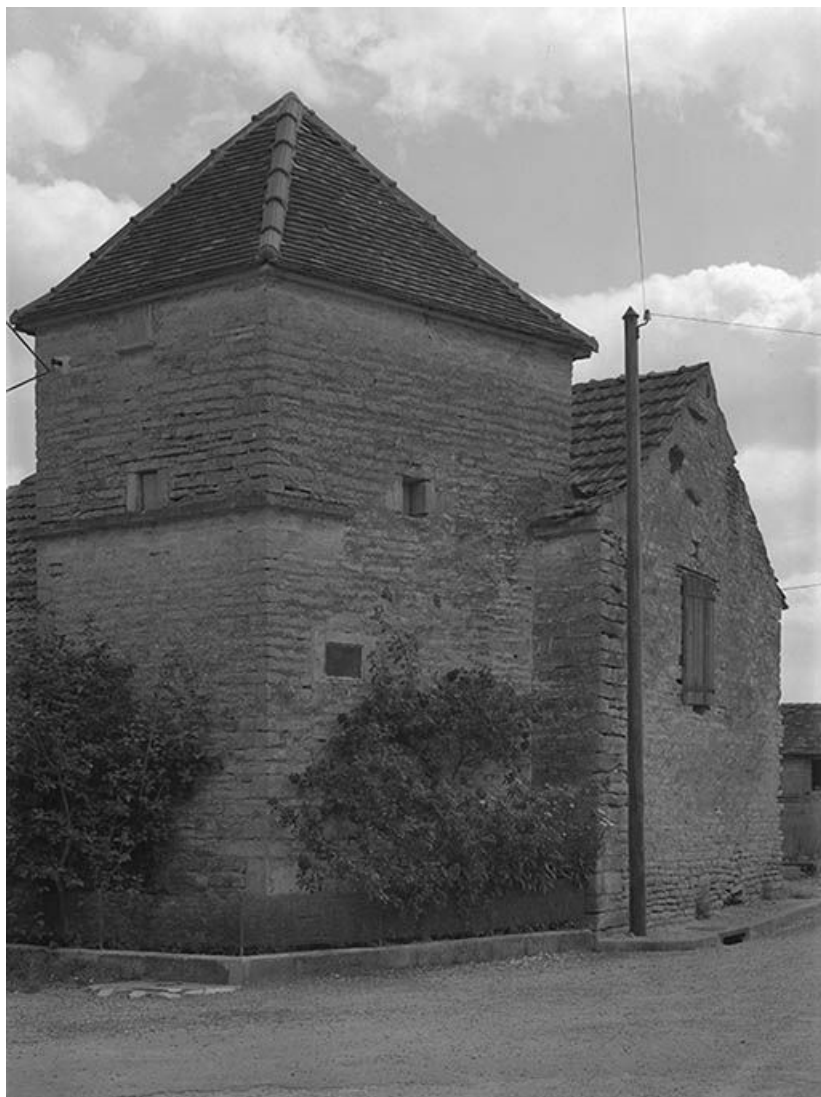
Colombier, encastré dans la façade du logis d'habitation d'une ferme. 89, Jully, lieudit : la Loge