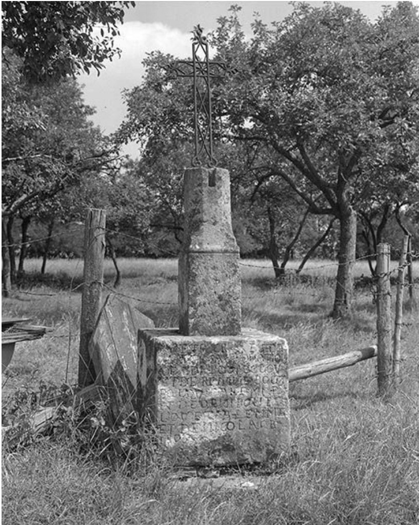
Croix de chemin.