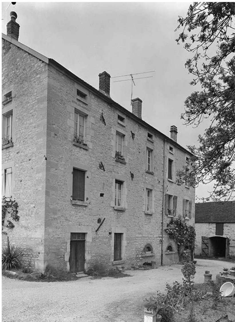
Mur-pignon et façade principale sur cour.