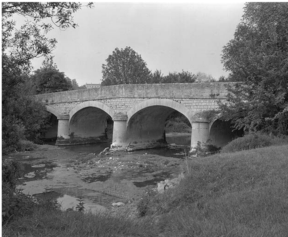
Pont sur un bras de l'Armançon (pont routier). 89, Fulvy C.V. 1