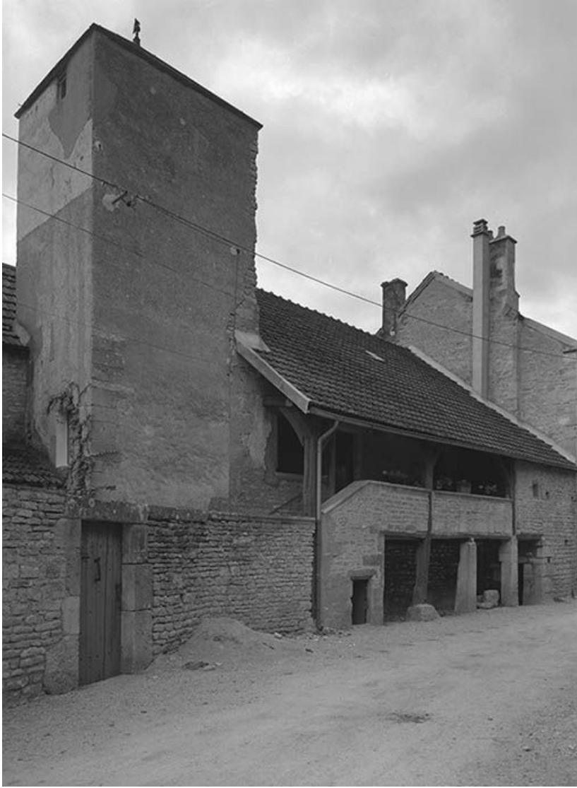
Impasse donnant sur la Grande-Rue. Tour et façade antérieure de la maison. 89, Cry