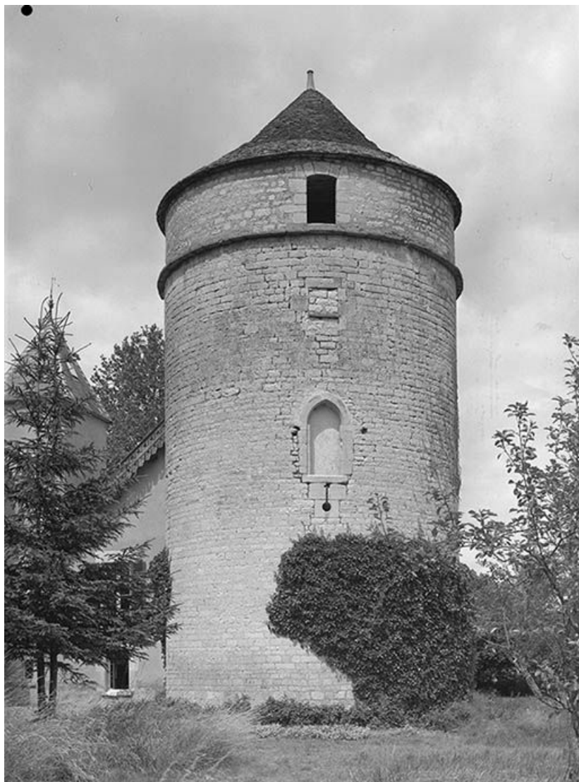
Colombier (ancienne tour), dans le jardin du château. 89, Argenteuil-sur-Armançon