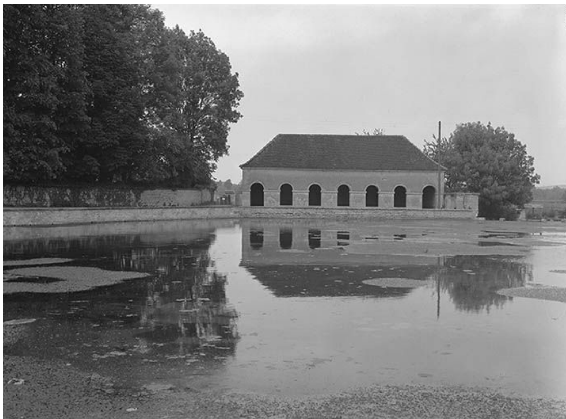
Vue de la façade antérieure avec pièce d'eau.