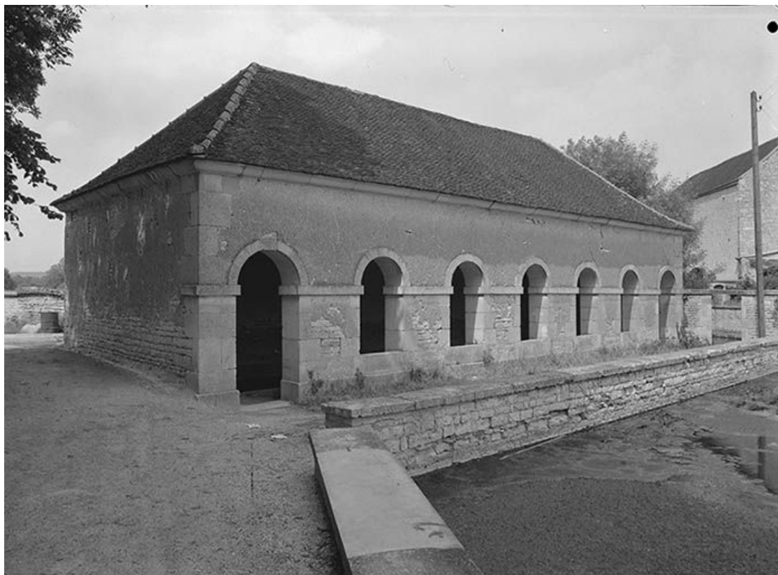
Façade antérieure et façade gauche.