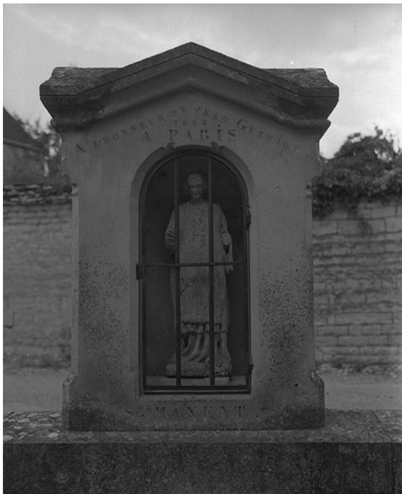
Niche du lavoir abritant une statue de saint Maixent datée 1864.