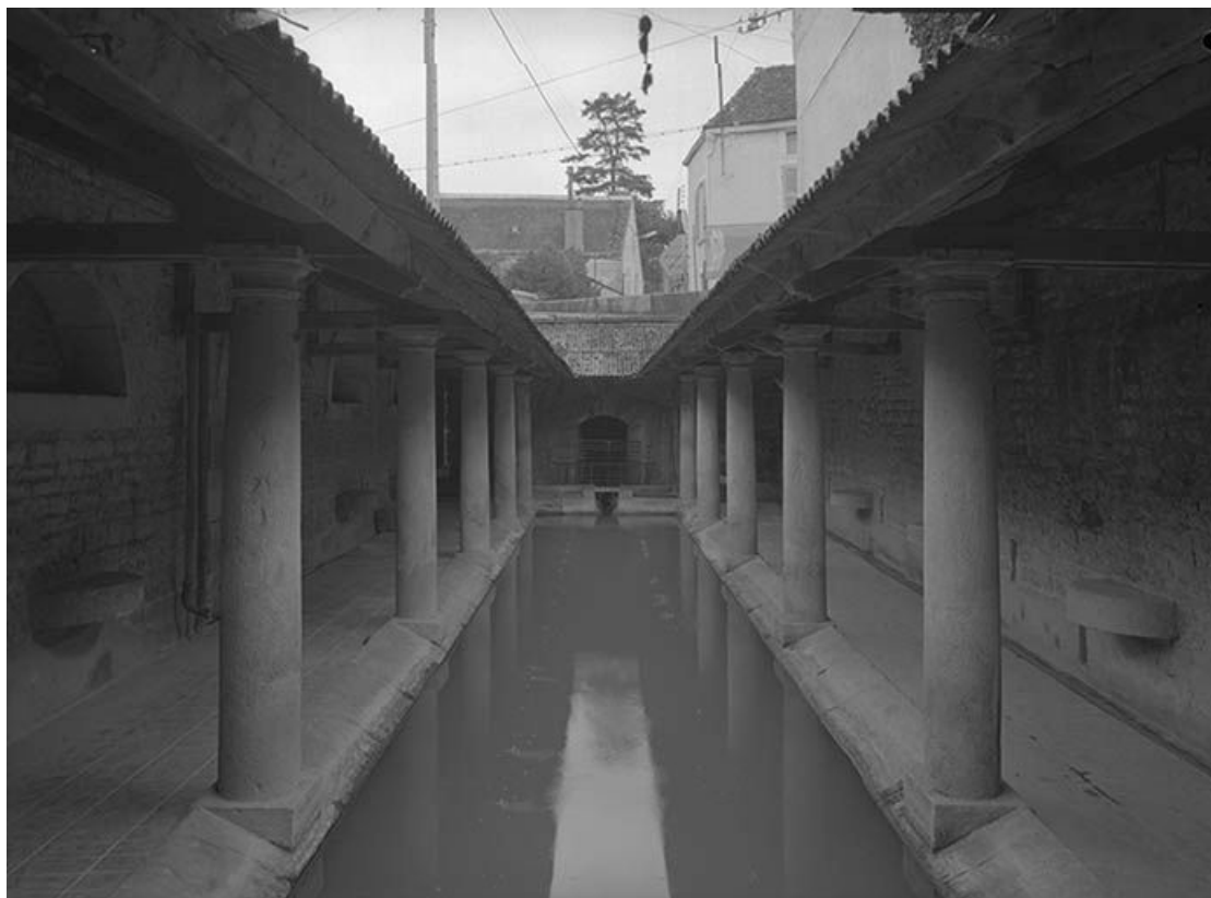
Vue intérieure prise depuis le mur postérieur.