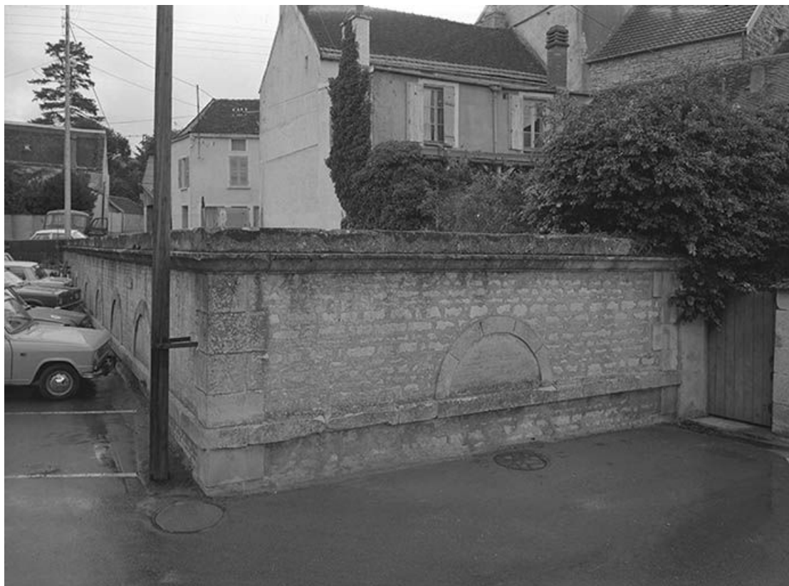
Vue extérieure, mur postérieur et mur latéral droit.