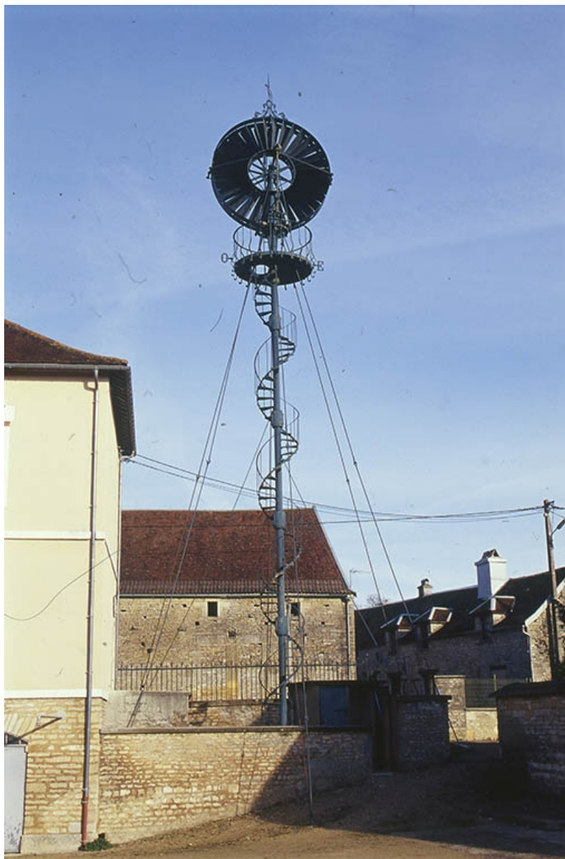
Vue d'ensemble depuis la place de la mairie.