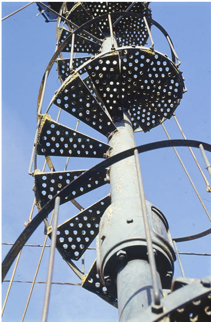
Détail de la colonne et de l'escalier en vis.