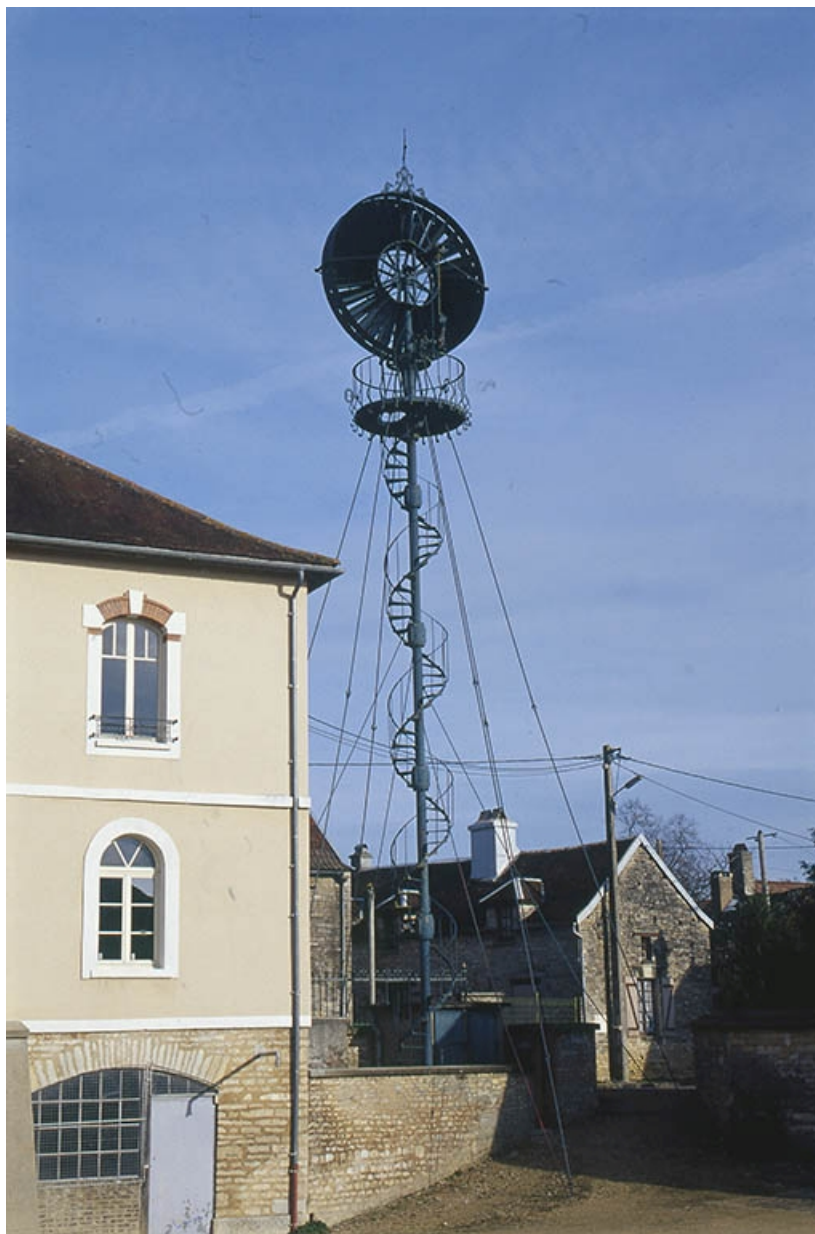
Vue d'ensemble depuis la place de la Mairie.