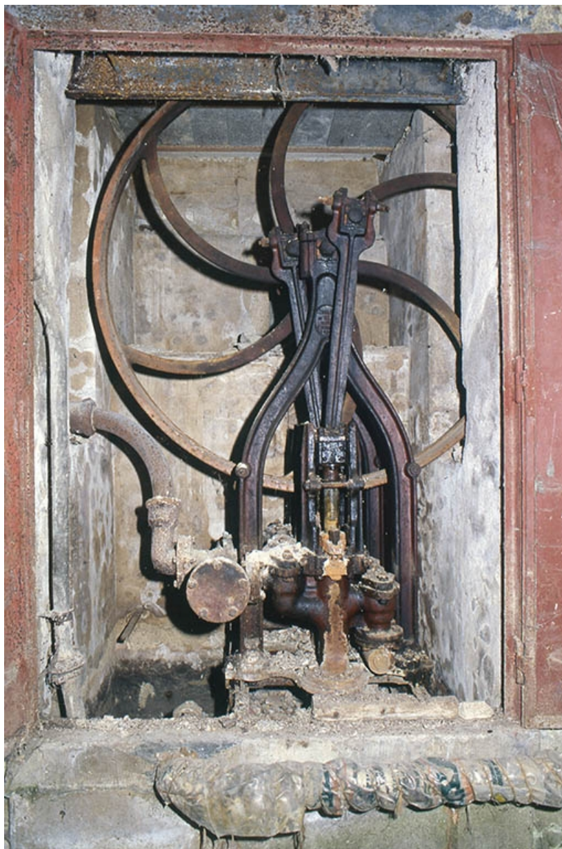
Vue d'ensemble de la pompe.