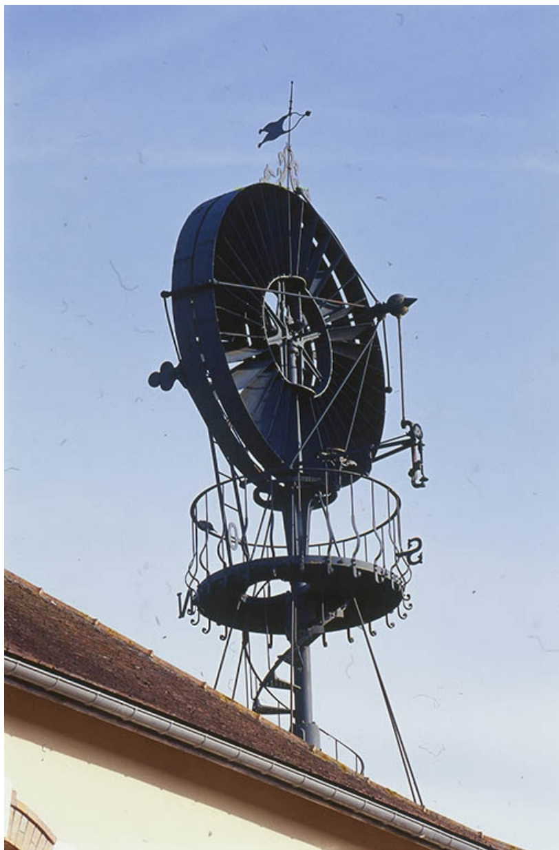
Détail de la partie supérieure.