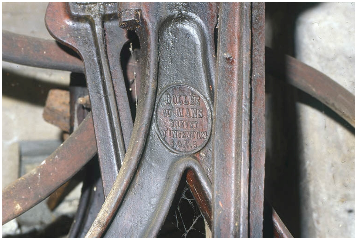
Détail de la pompe : marque du fabricant. 89, Arthonnay Noise