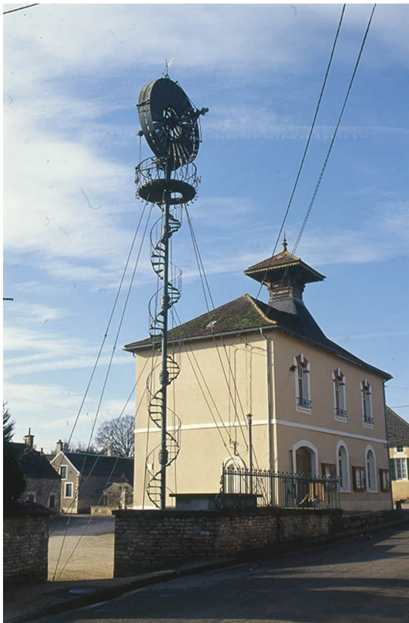
Vue d'ensemble avec la mairie.