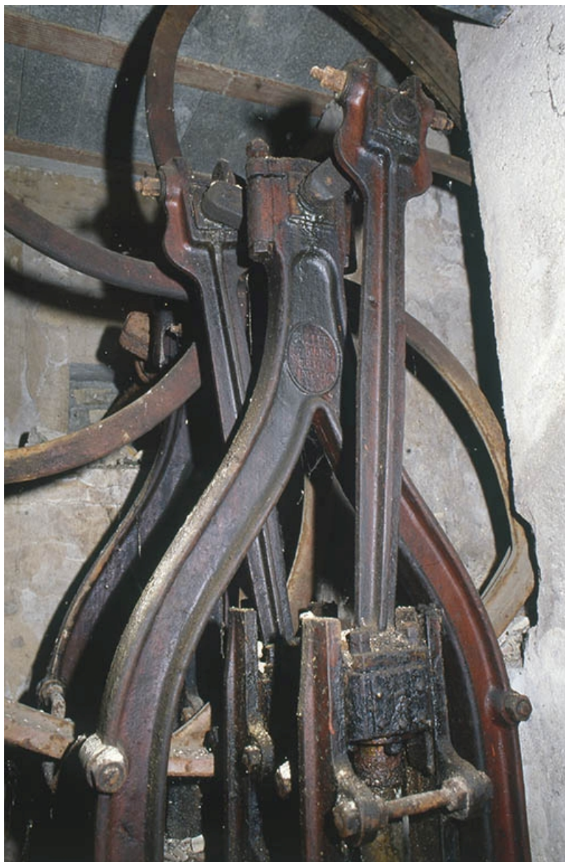
Détail de la pompe.