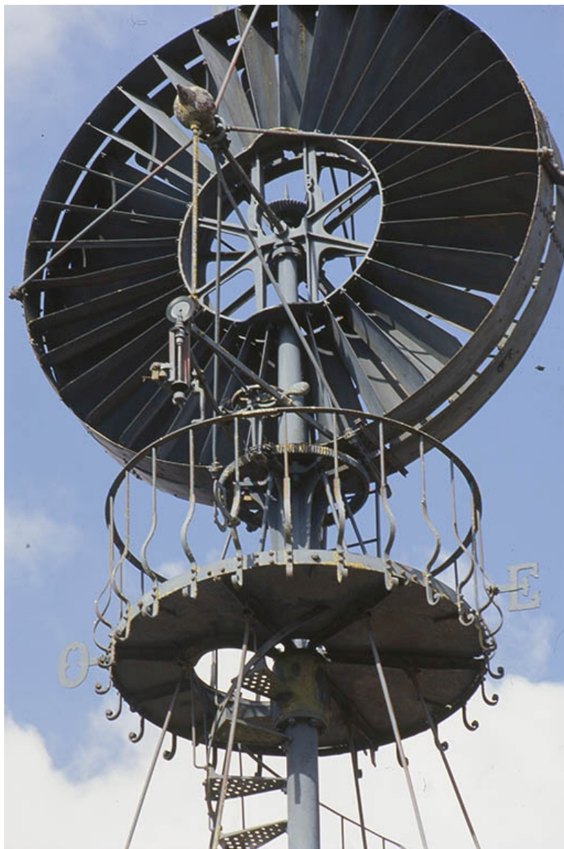
Détail de la passerelle sommitale et du disque moteur.