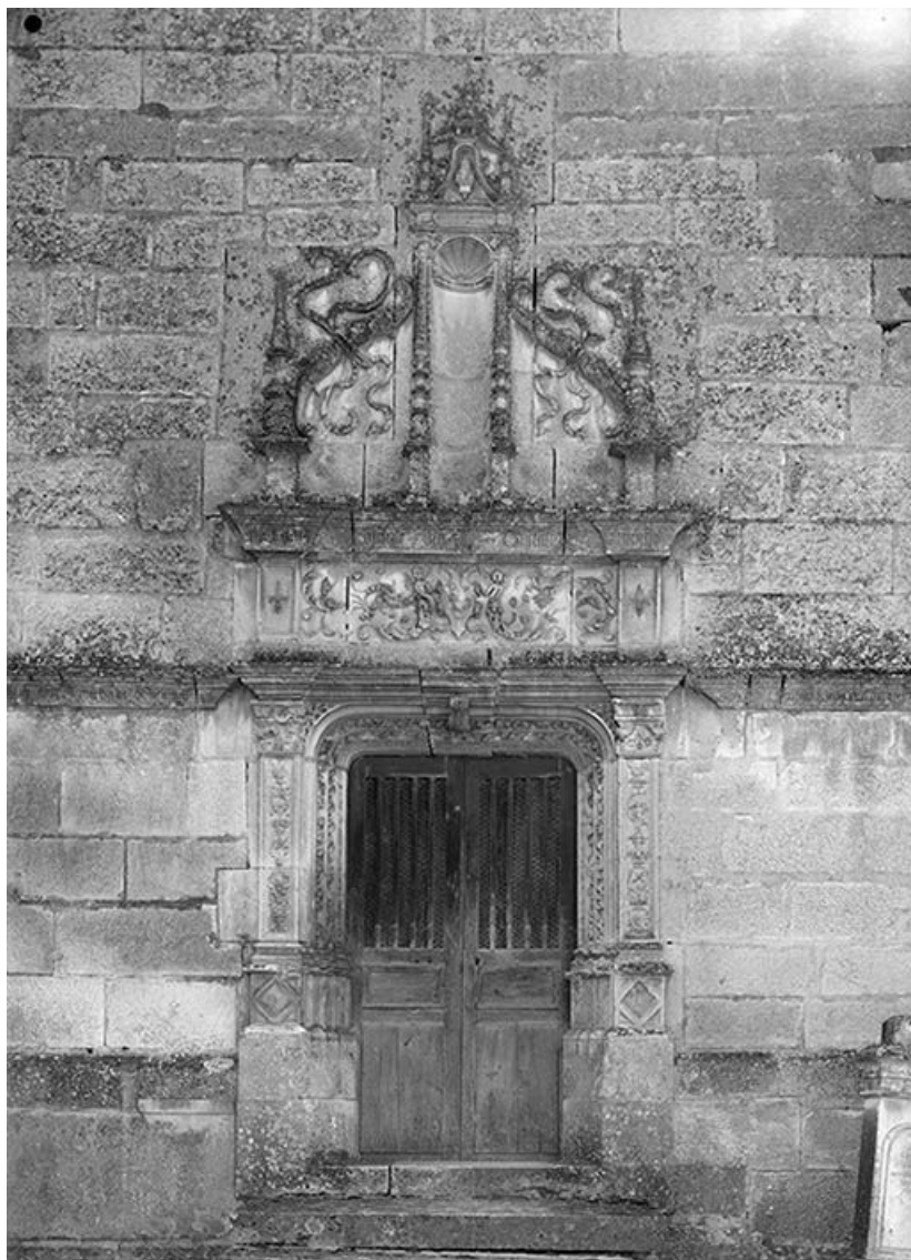
Portail d'entrée, vue d'ensemble.