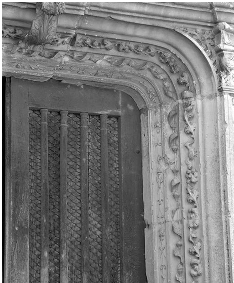
Portail d'entrée, détail de la partie centrale.