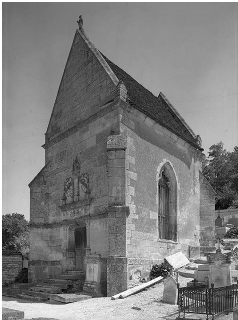
Façade antérieure et façade latérale droite.