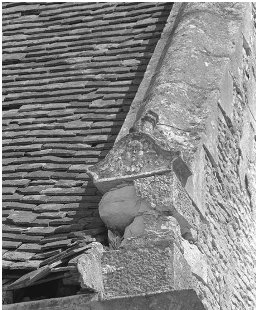
Détail angle postérieur droit.