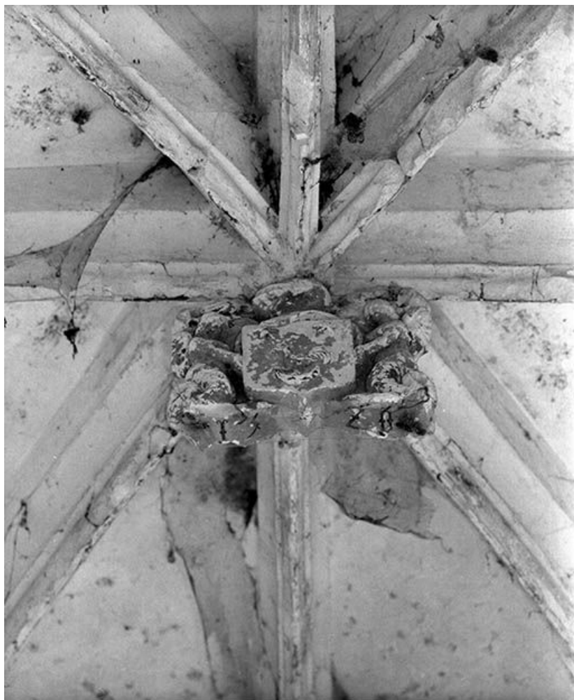
Détail clef de voûte.