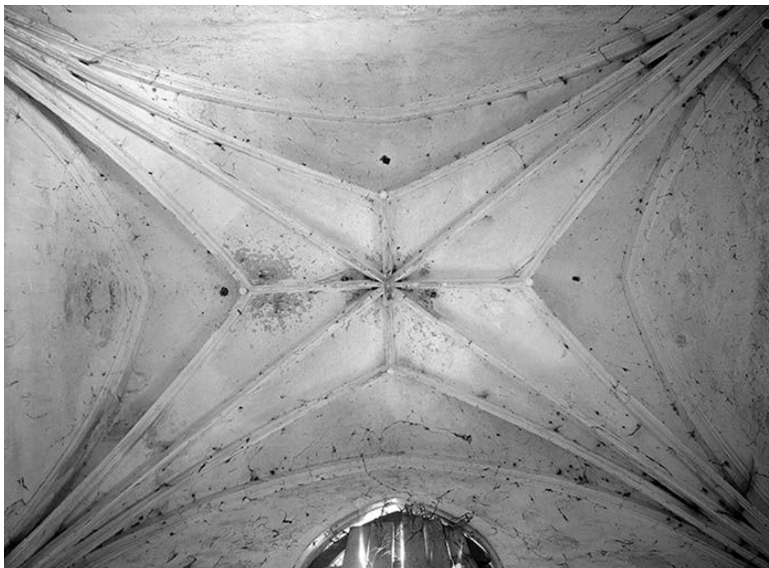
Vue d'ensemble de la voûte.