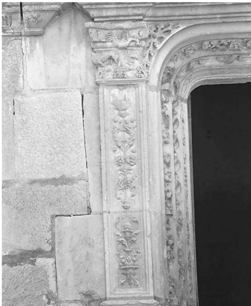
Portail d'entrée, détail de la partie gauche. 89, Ancy-le-Franc