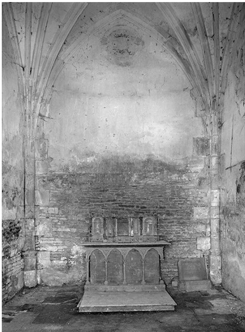
Vue d'ensemble intérieure.