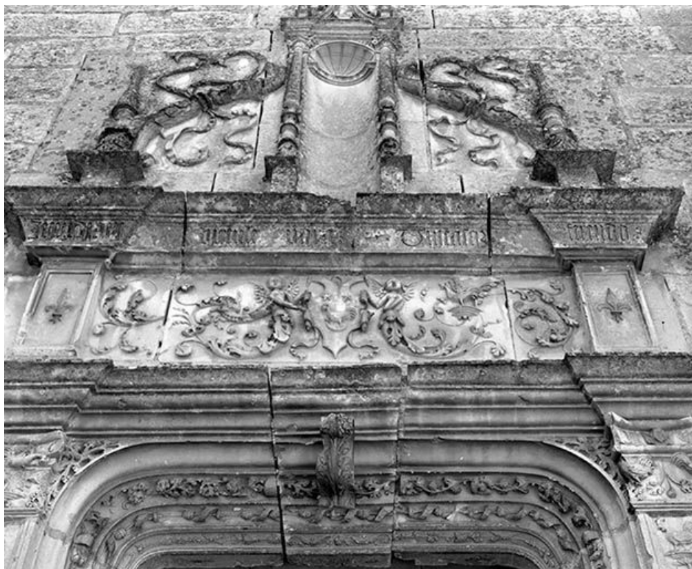
Portail d'entrée, détail de la partie supérieure.