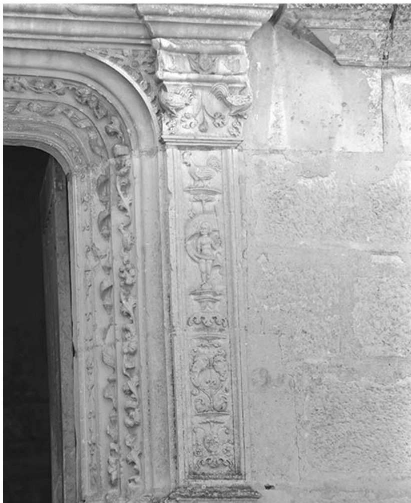
Portail d'entrée, détail de la partie droite.