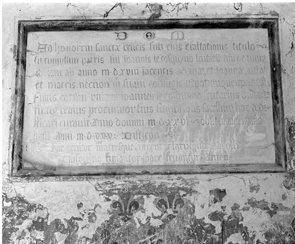
Pierre de fondation.