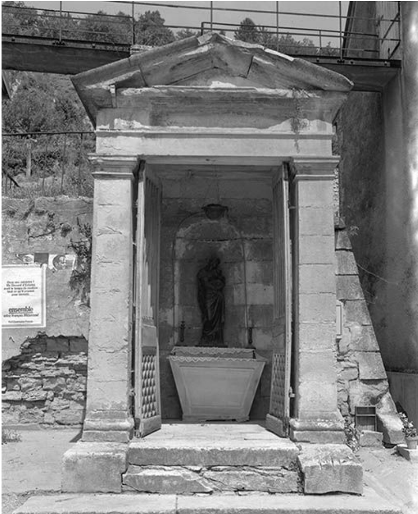
Vue de l'intérieur.