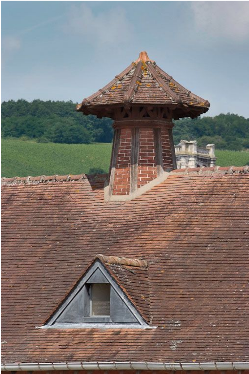
Bâtiment à droite de l'entrée de la cour : détail de la 2e souche de cheminée de ventilation. 89, Joigny quai de l'Hôpital