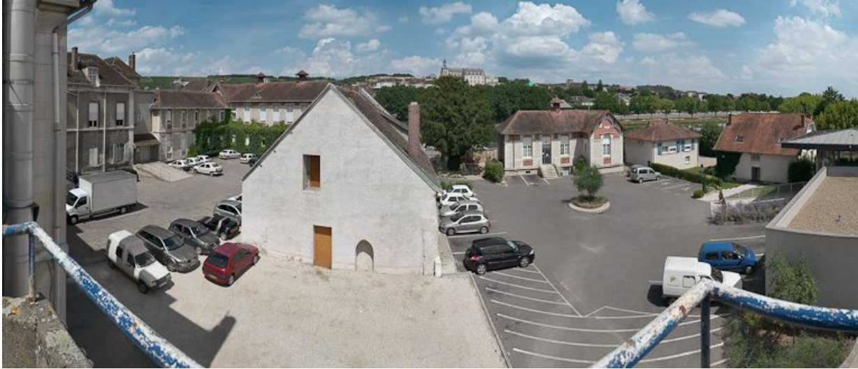
Petite construction, vestige du premier hôpital : mur-pignon sud.