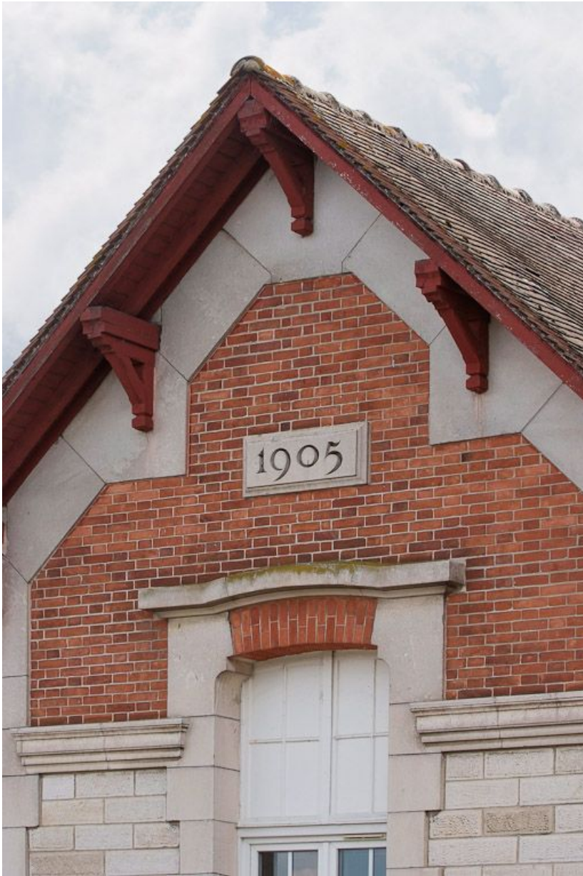
Bâtiment à gauche de l'entrée de la cour : détail du pignon. 89, Joigny quai de l'Hôpital