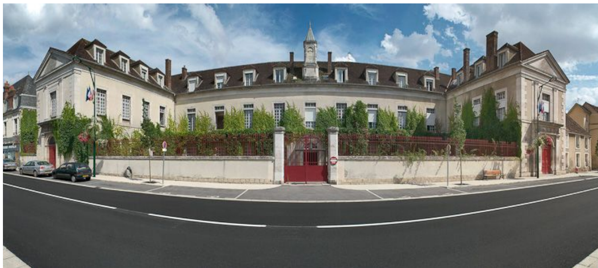
Bâtiment principal : vue d'ensemble des façades sur rue.