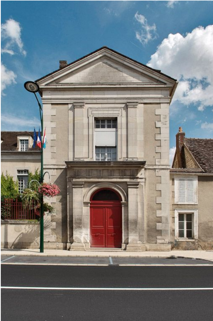
Bâtiment principal : mur de croupe de l'aile droite.