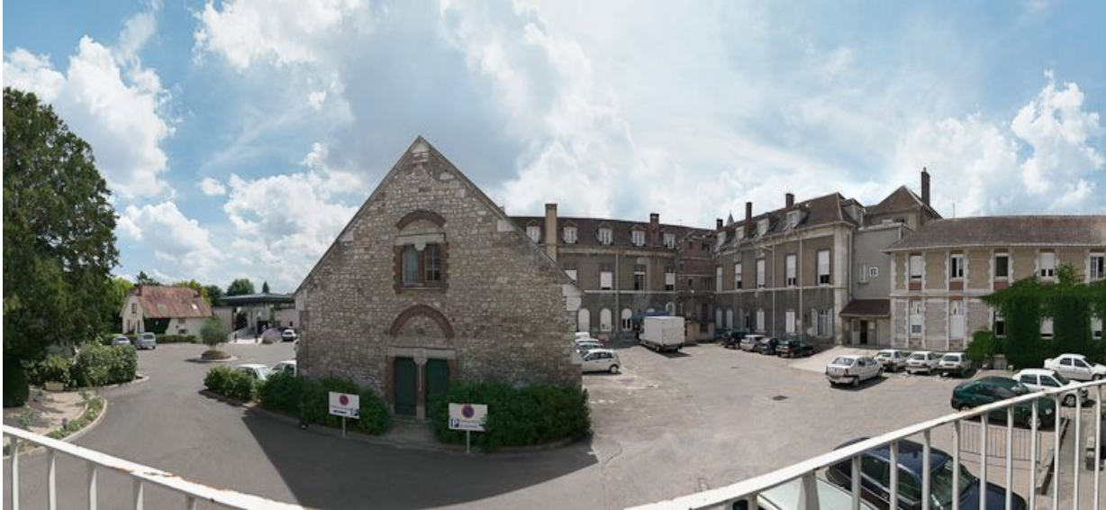
Petite construction, vestige du 1er hôpital : mur-pignon nord. 89, Joigny quai de l'Hôpital