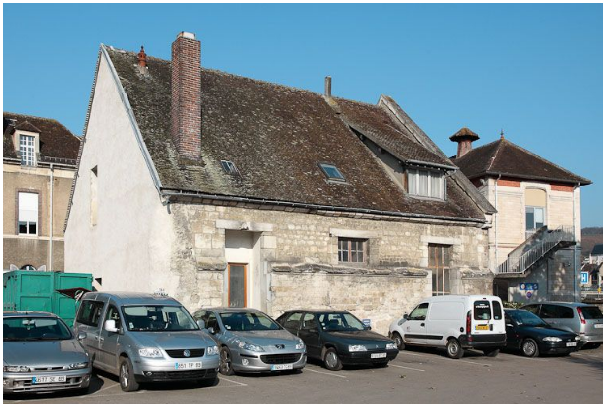
Petite construction, vestige du premier hôpital : élévation est.