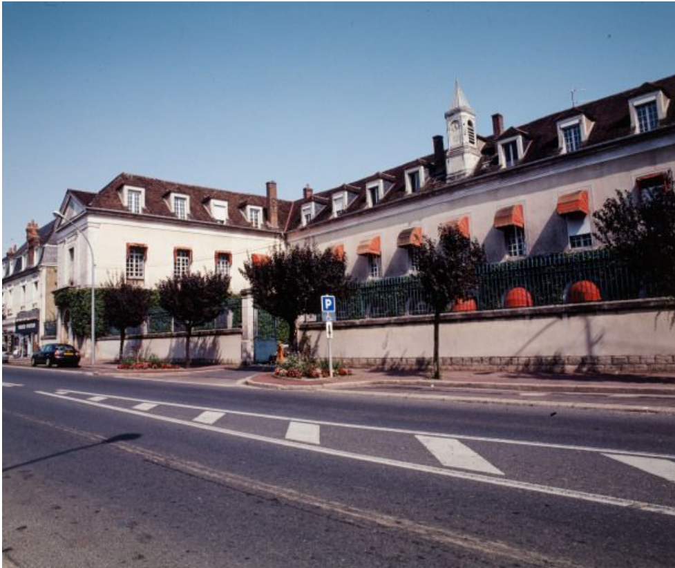
Vue générale, depuis la rue Gambetta.