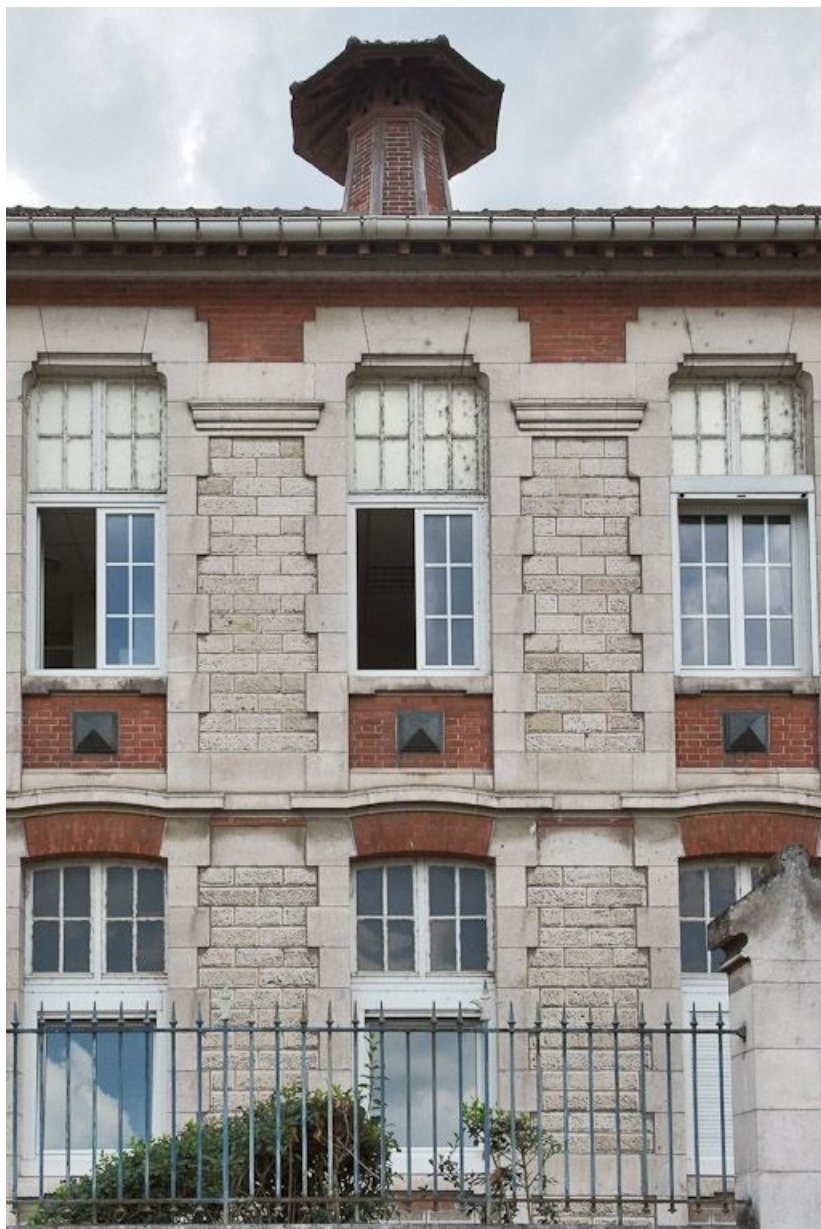
Bâtiment à droite de l'entrée de la cour : détail de l'élévation sur le quai. 89, Joigny quai de l'Hôpital