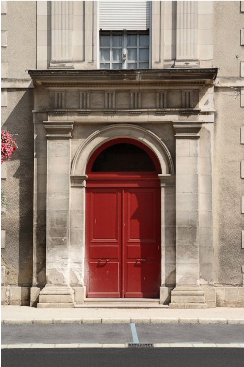
Bâtiment principal : porte d'entrée de l'aile droite.