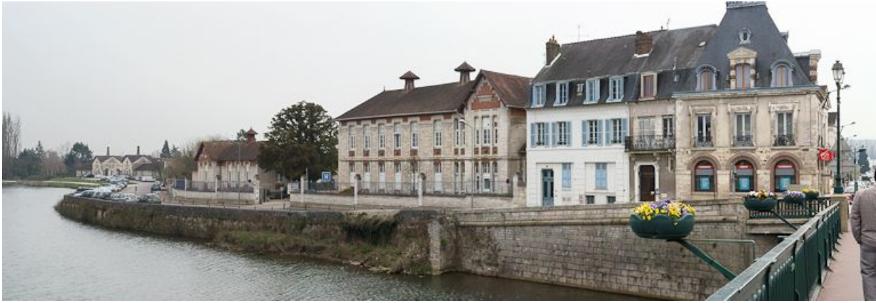
Bâtiments longeant le quai, vue prise du pont.