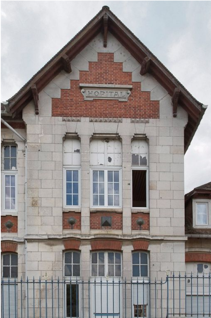
Bâtiment à droite de l'entrée de la cour : mur-pignon.