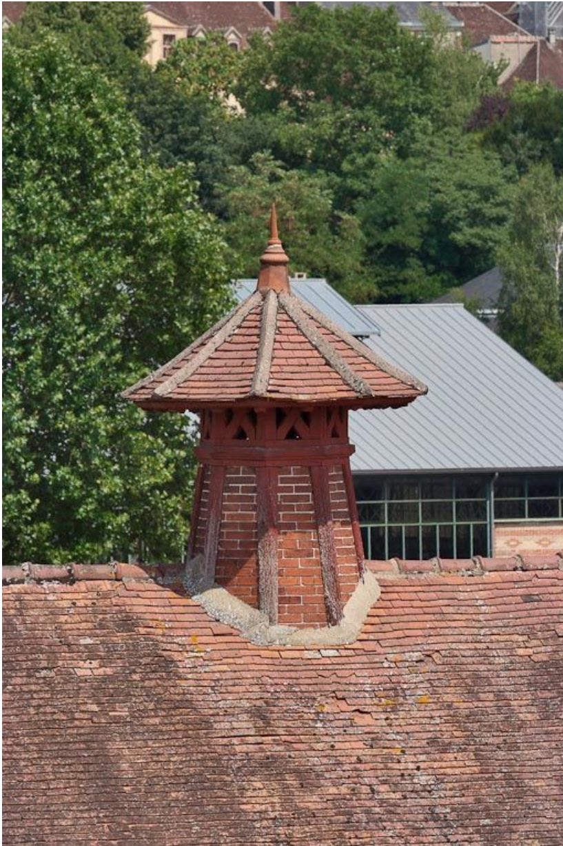
Bâtiment à gauche de l'entrée de la cour : détail de la souche de cheminée de ventilation. 89, Joigny quai de l'Hôpital