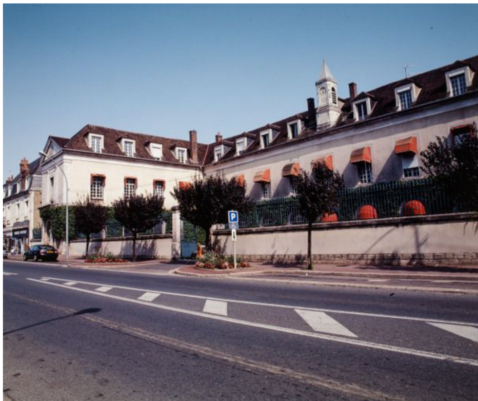
Vue générale, depuis la rue Gambetta.