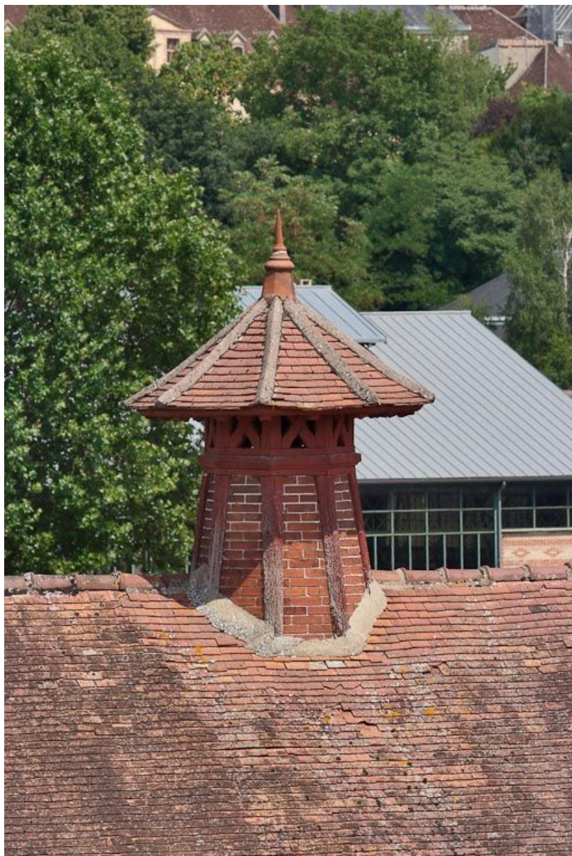
Bâtiment à gauche de l'entrée de la cour : détail de la souche de cheminée de ventilation. 89, Joigny quai de l'Hôpital