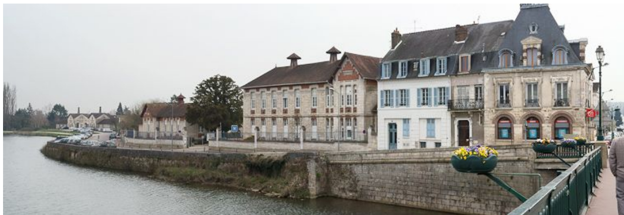
Bâtiments longeant le quai, vue prise du pont.