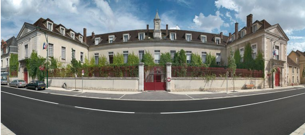
Bâtiment principal : vue d'ensemble des façades sur rue.