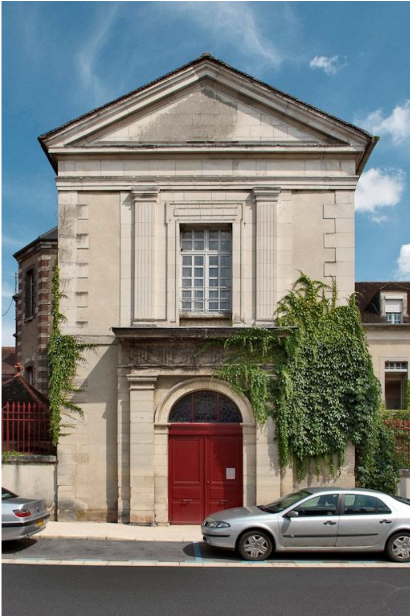
Bâtiment principal : mur de croupe de l'aile gauche.