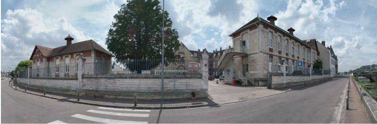
Vue d'ensemble depuis le quai.