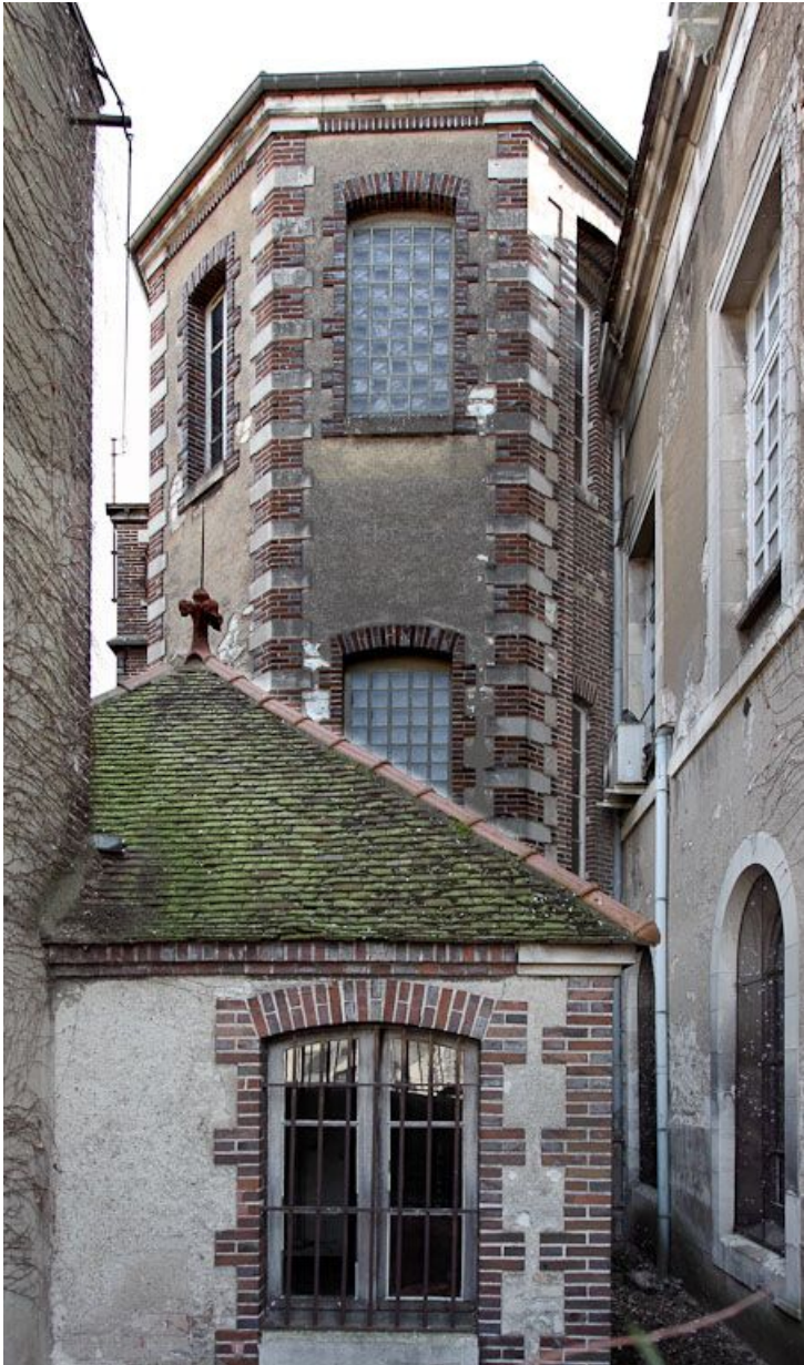
Sacristie et bâtiment hors-oeuvre de l'escalier.