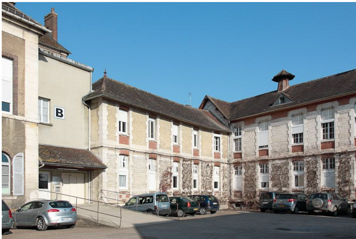
Façades postérieures des corps de bâtiment à droite de l'entrée de la cour. 89, Joigny quai de l'Hôpital