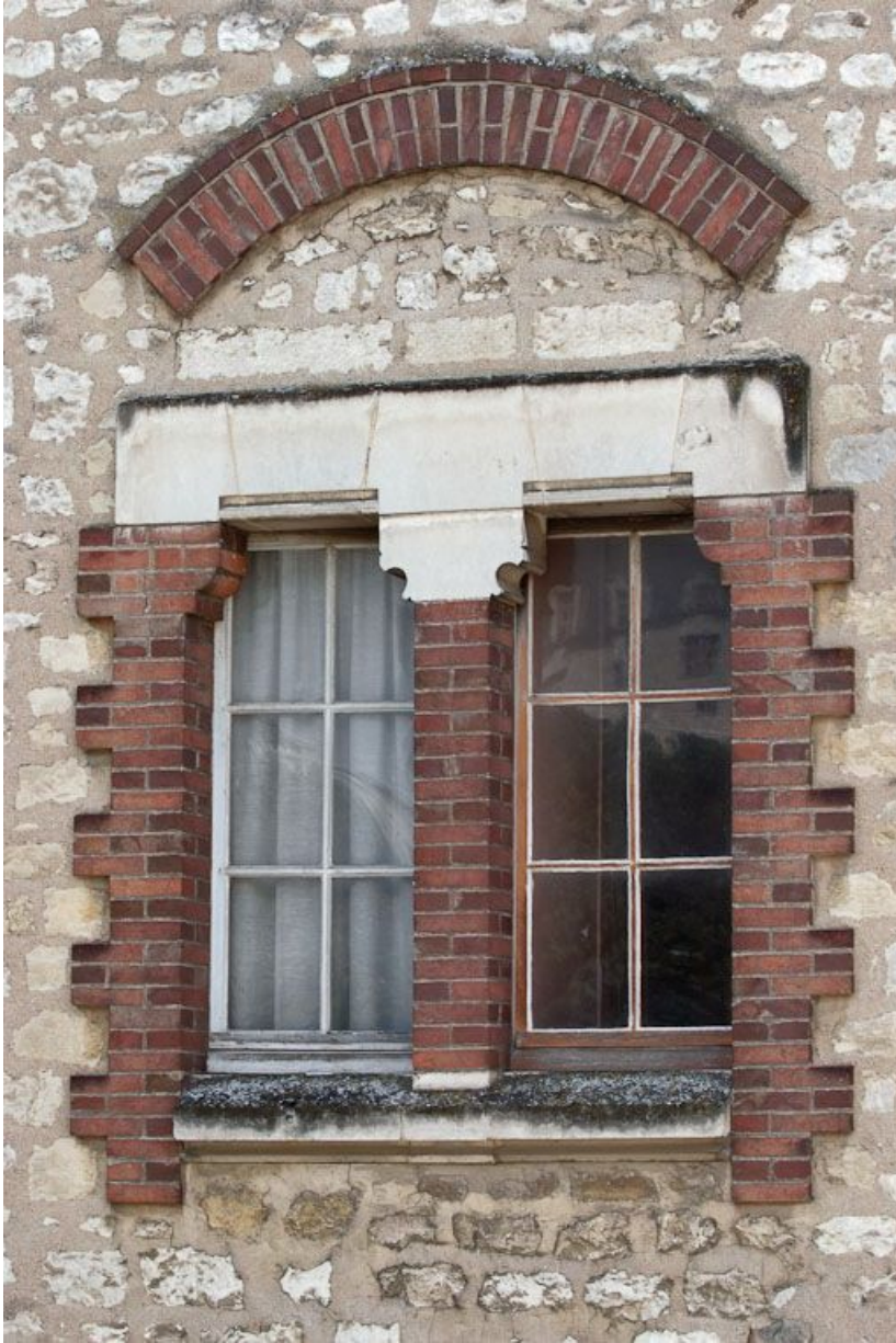
Petite construction, vestige du premier hôpital : fenêtres remaniées. 89, Joigny quai de l'Hôpital