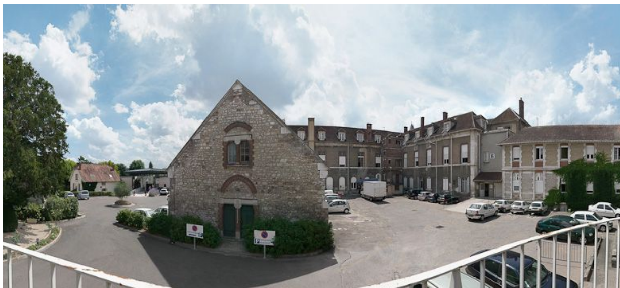
Petite construction, vestige du 1er hôpital : mur-pignon nord. 89, Joigny quai de l'Hôpital