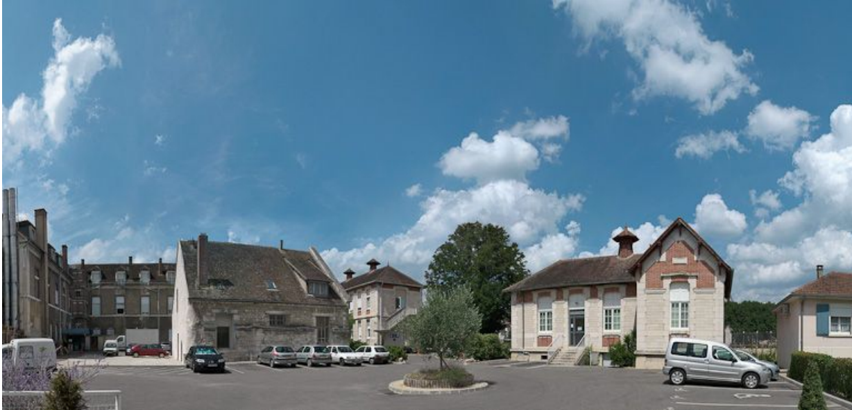
Vue d'ensemble des bâtiments de la cour.