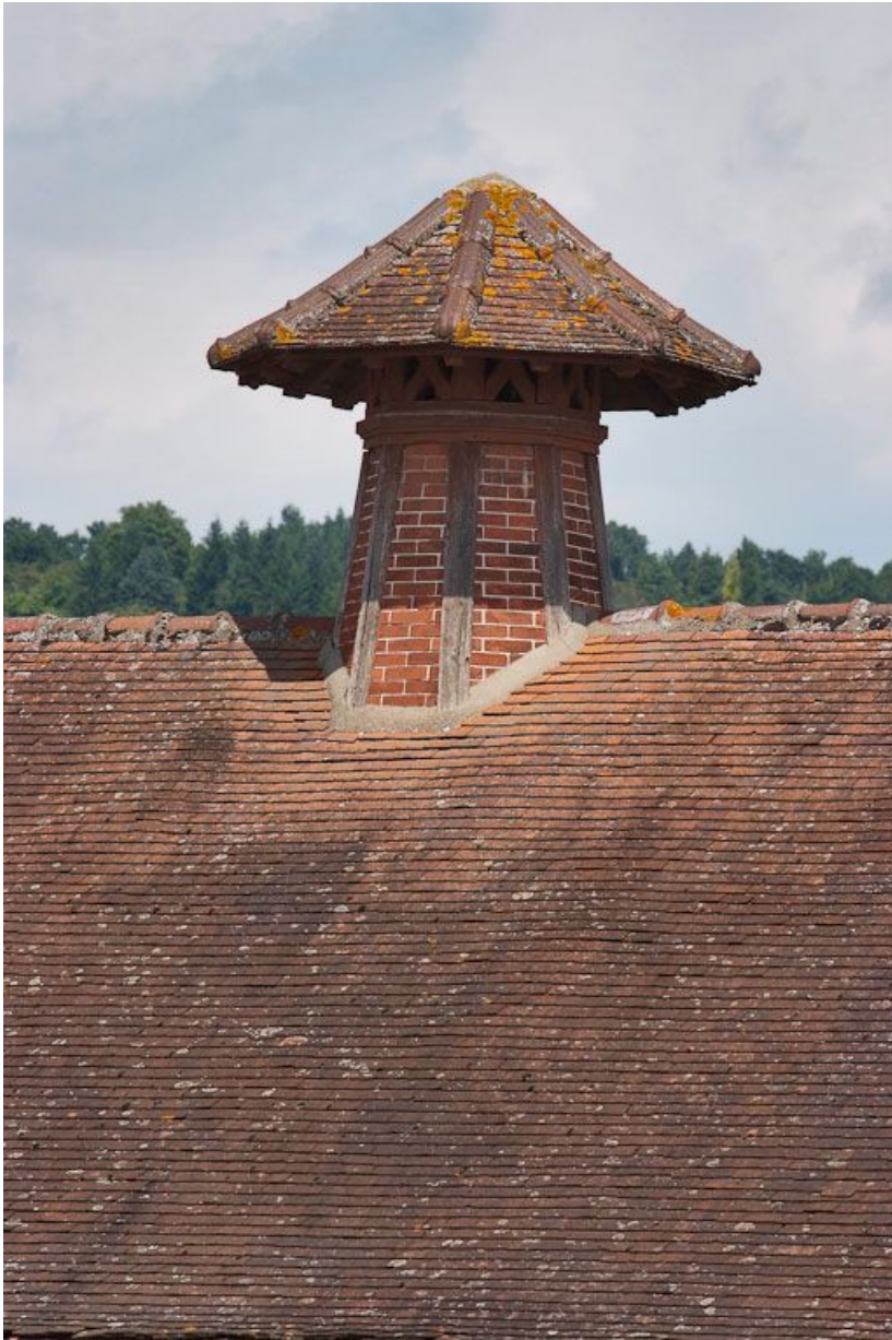
Bâtiment à droite de l'entrée de la cour : détail de la 1ère souche de cheminée de ventilation. 89, Joigny quai de l'Hôpital