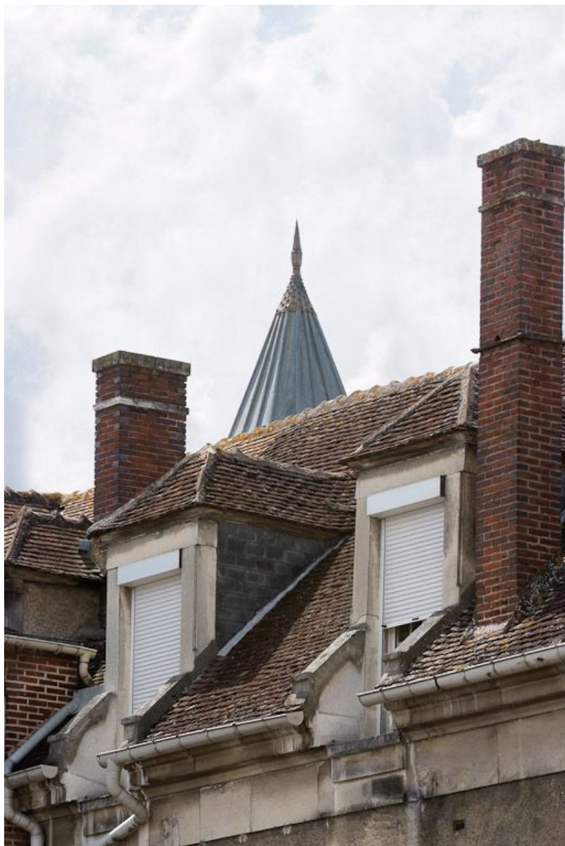
Bâtiment principal : détail des lucarnes rentrantes. 89, Joigny quai de l'Hôpital