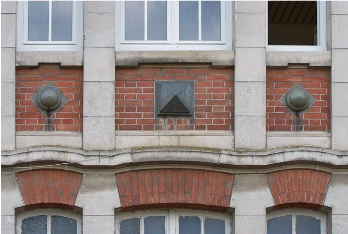
Bâtiment à droite de l'entrée de la cour : détail.