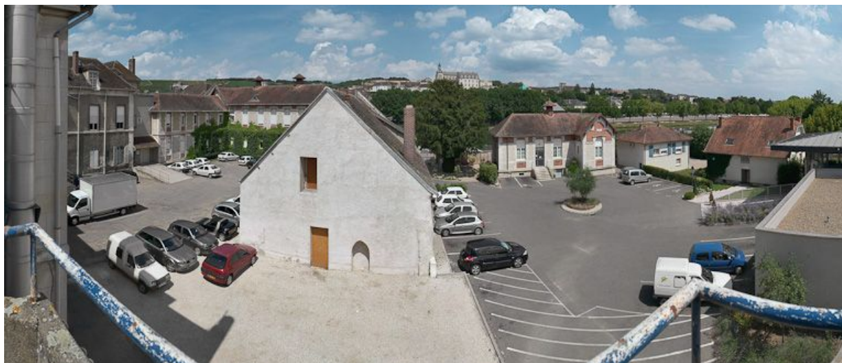
Petite construction, vestige du premier hôpital : mur-pignon sud. 89, Joigny quai de l'Hôpital