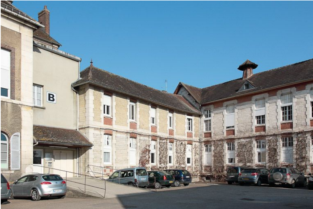
Façades postérieures des corps de bâtiment à droite de l'entrée de la cour.