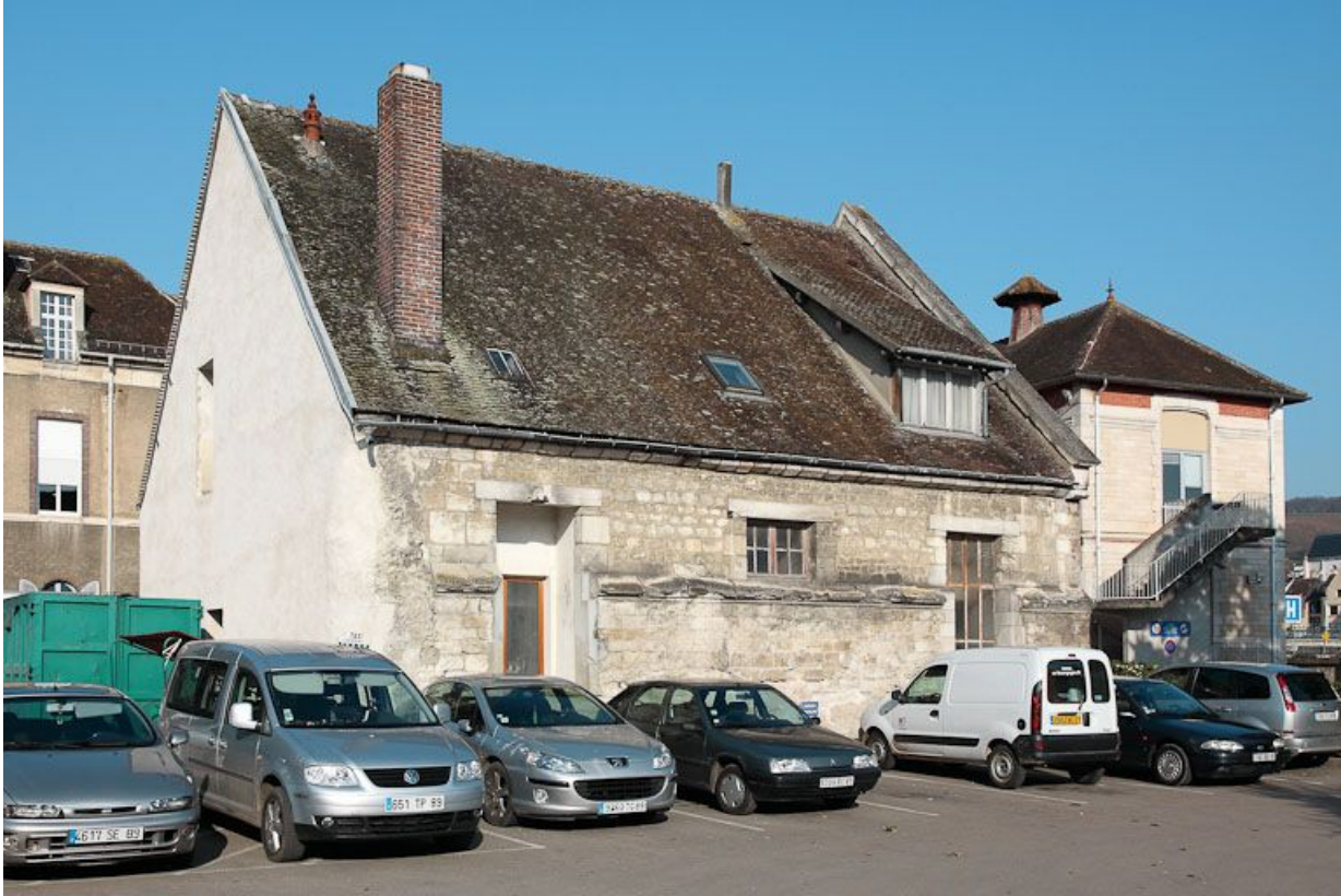
Petite construction, vestige du premier hôpital : élévation est.