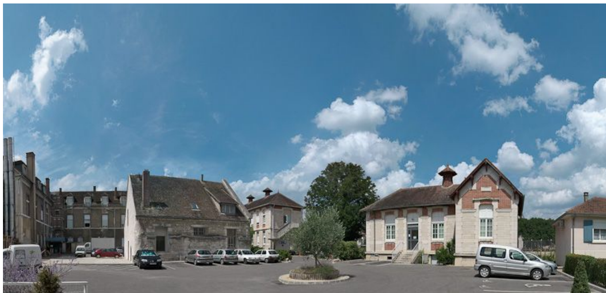
Vue d'ensemble des bâtiments de la cour.