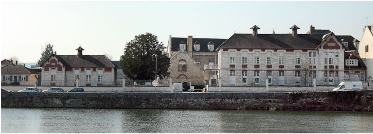
Bâtiments encadrant l'entrée de la cour.