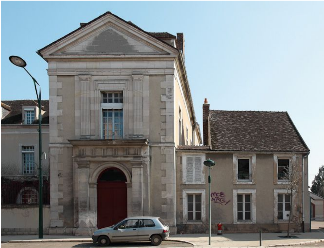
Bâtiment principal : mur de croupe de l'aile droite et bâtiment contigu. 89, Joigny quai de l'Hôpital