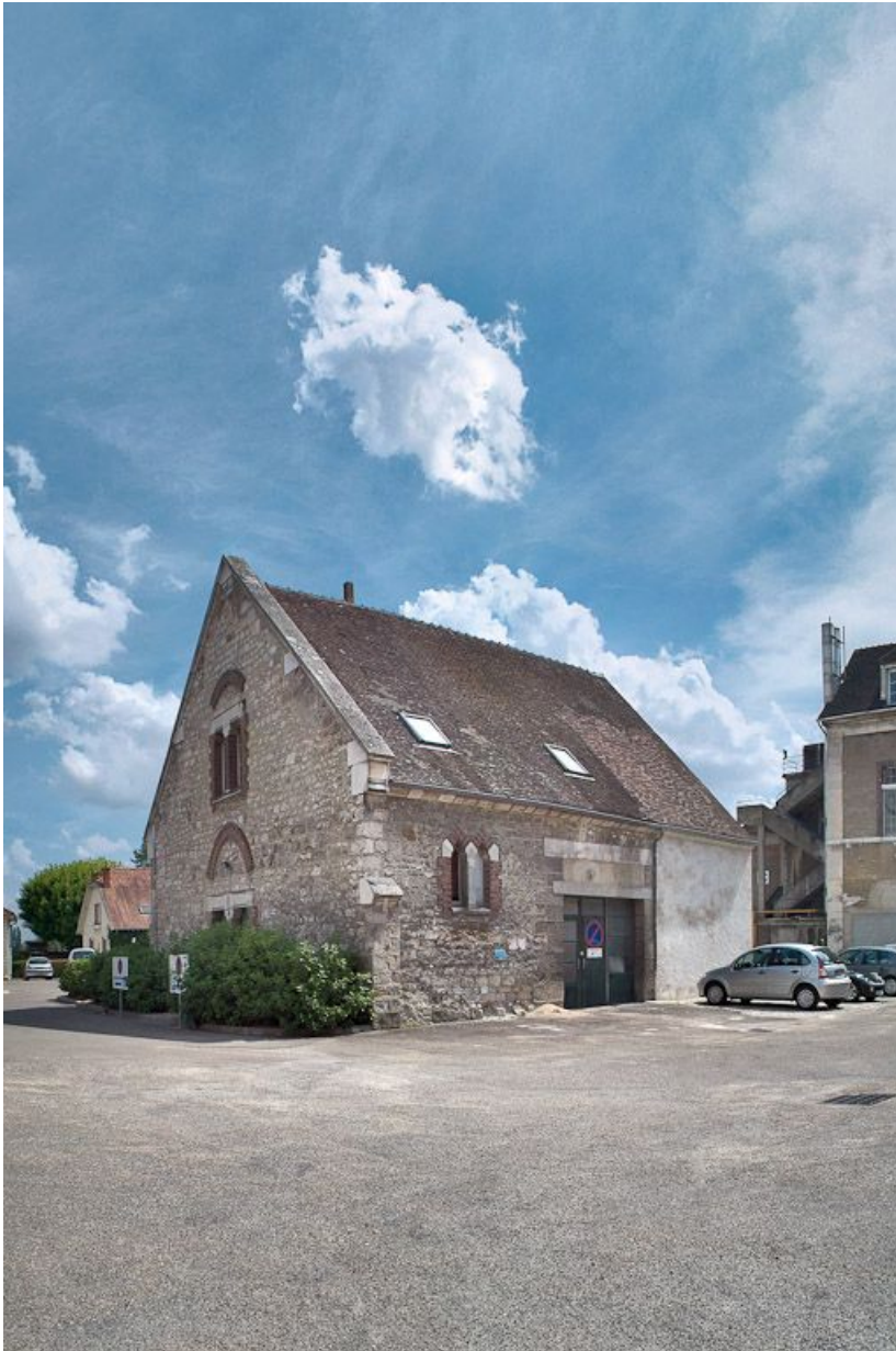
Petite construction, vestige du premier hôpital.