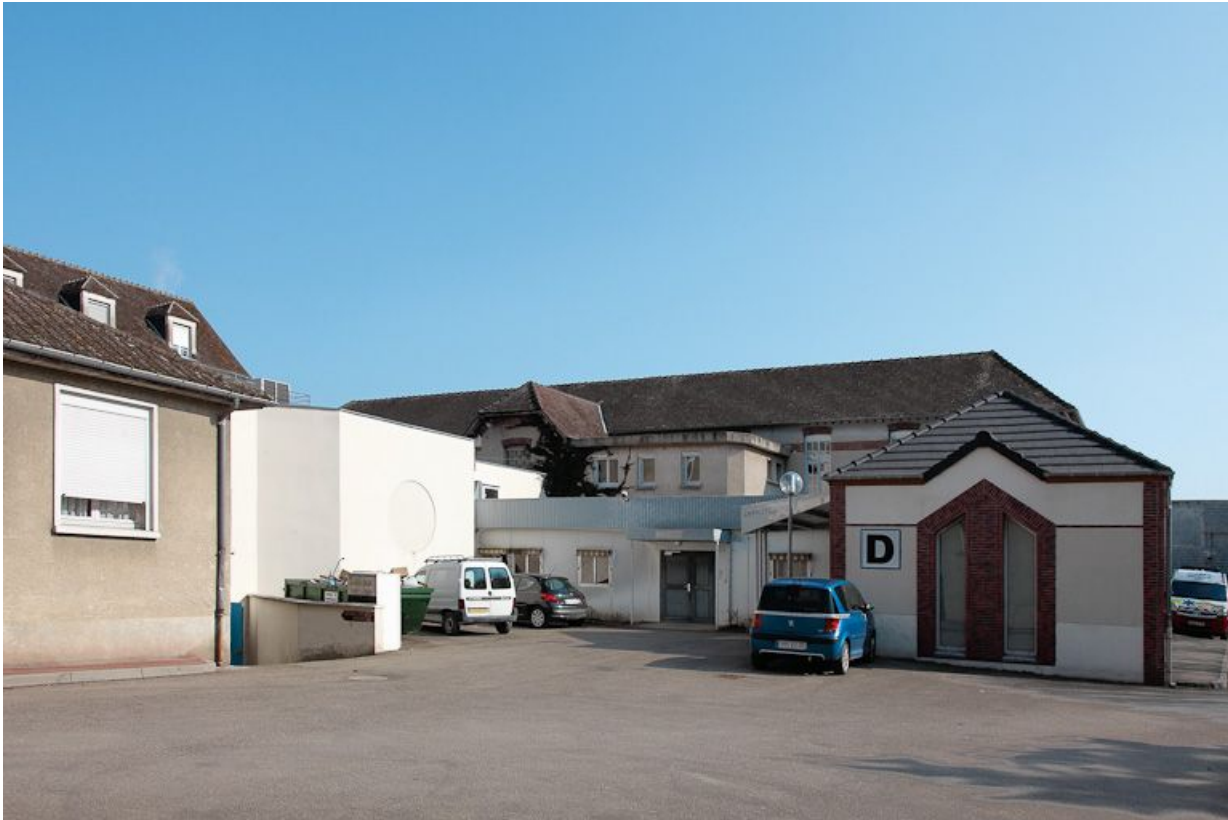
Bâtiments modernes construits à l'est.