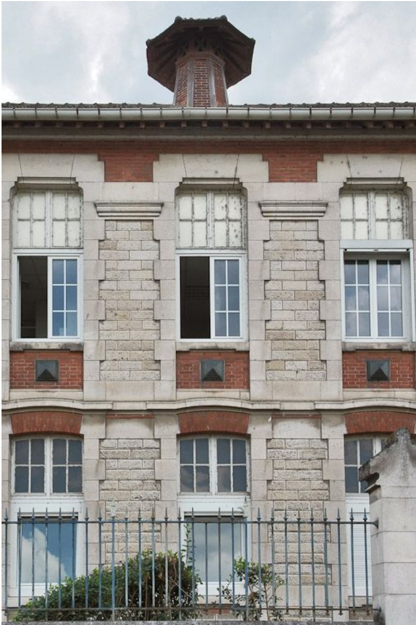
Bâtiment à droite de l'entrée de la cour : détail de l'élévation sur le quai. 89, Joigny quai de l'Hôpital