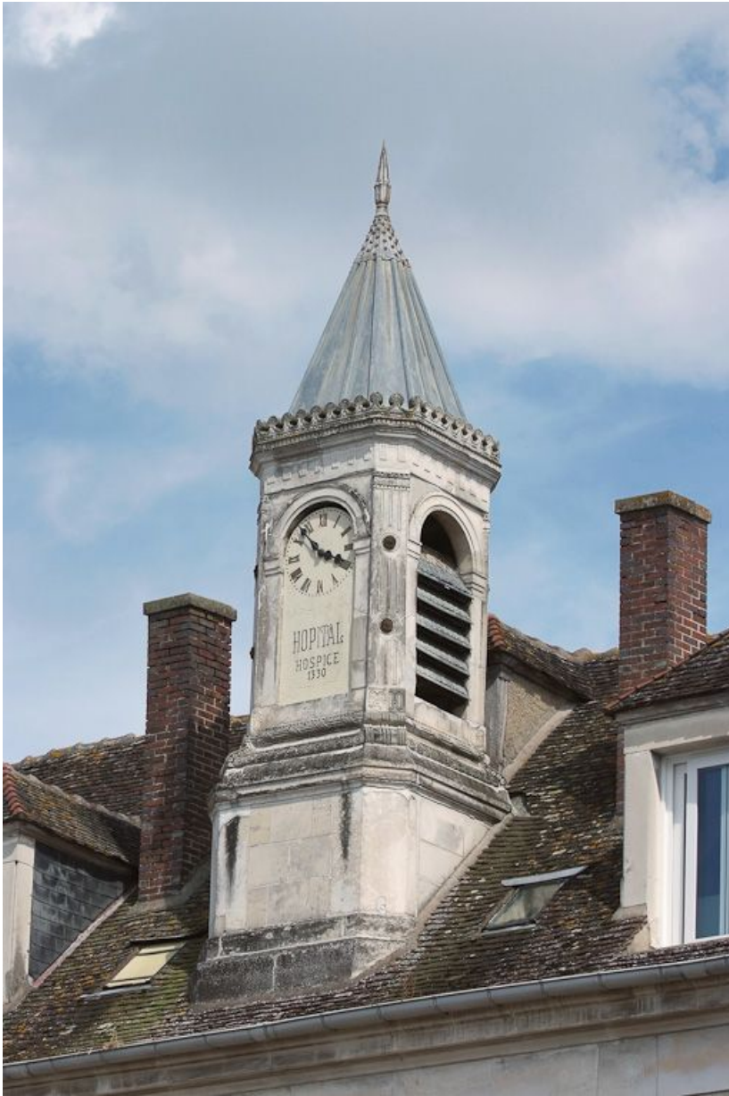
Clocheton de l'horloge, de trois quarts.