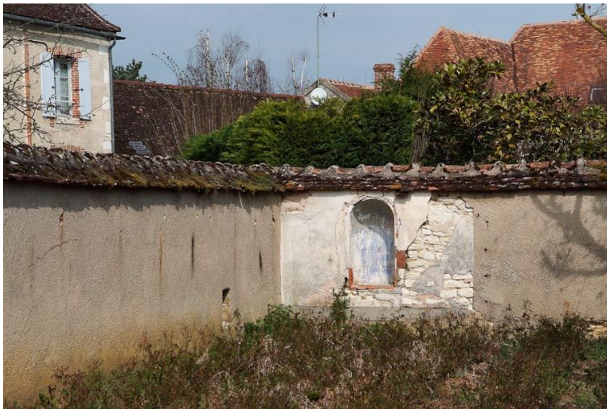
Ancien jardin des soeurs : niche du mur nord.

89, Seignelay, 2 rue du Docteur Chauvelot