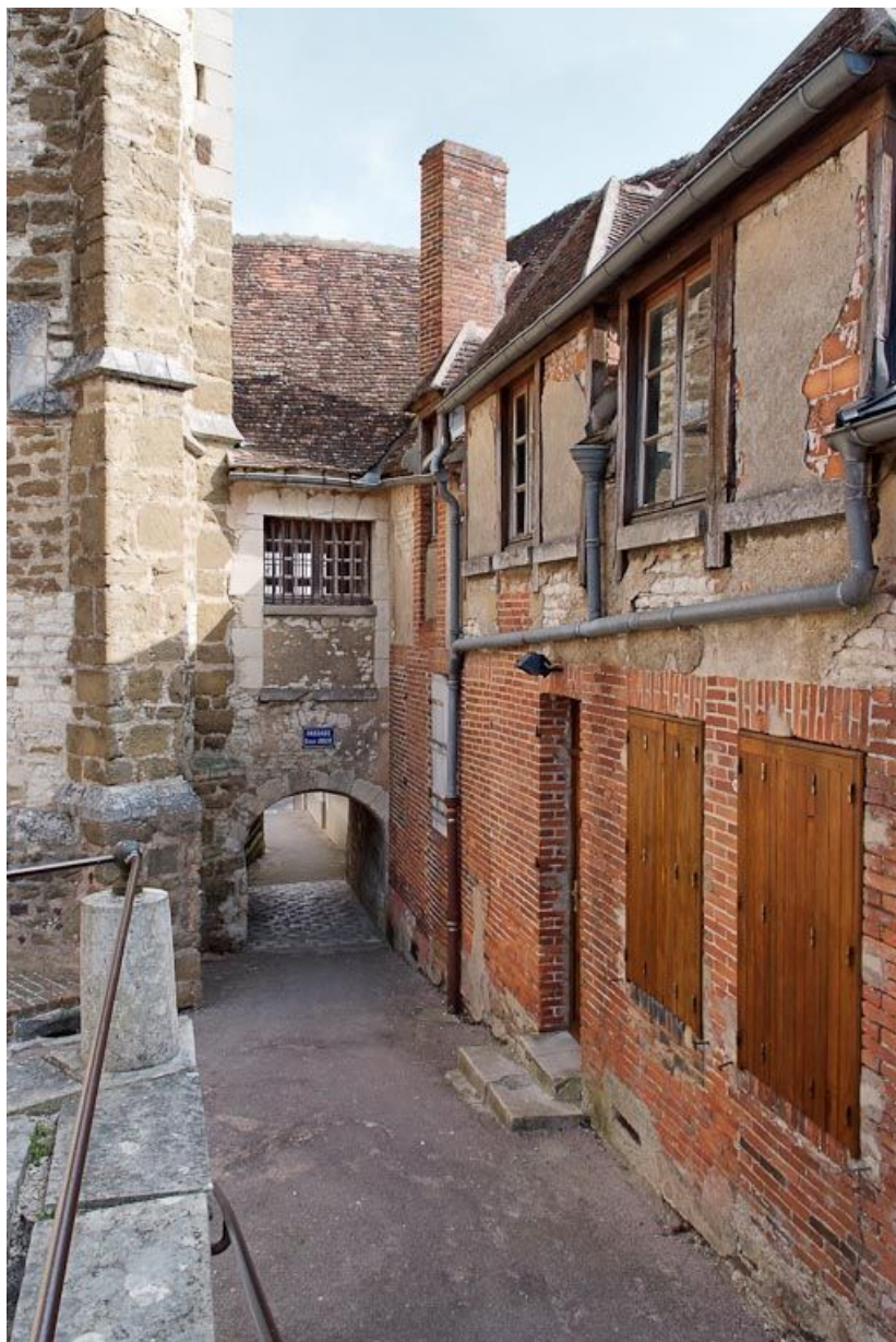
Façade postérieure du bâtiment sud-ouest et passage couvert.

89, Seignelay, 2 rue du Docteur Chauvelot