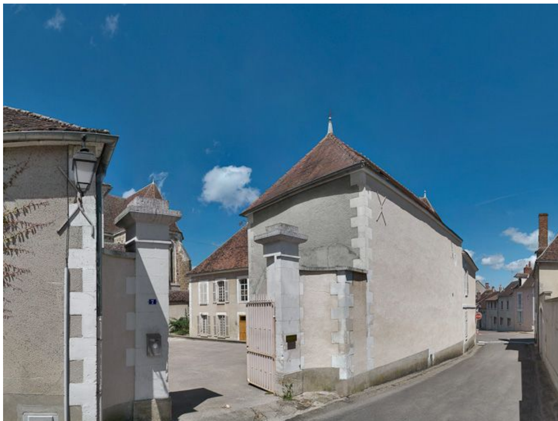
Vue d'ensemble depuis la rue Alphone Darlot.

89, Seignelay, 2 rue du Docteur Chauvelot