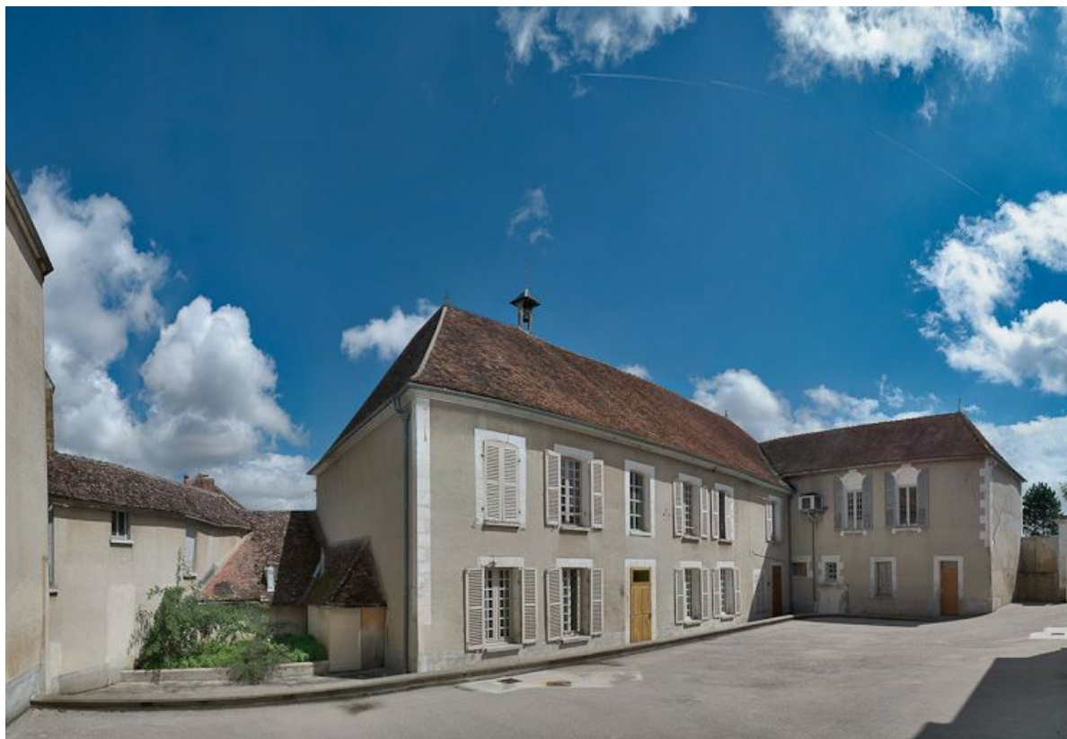
Bâtiments en équerre bordant les côtés nord et est de la cour.

89, Seignelay, 2 rue du Docteur Chauvelot