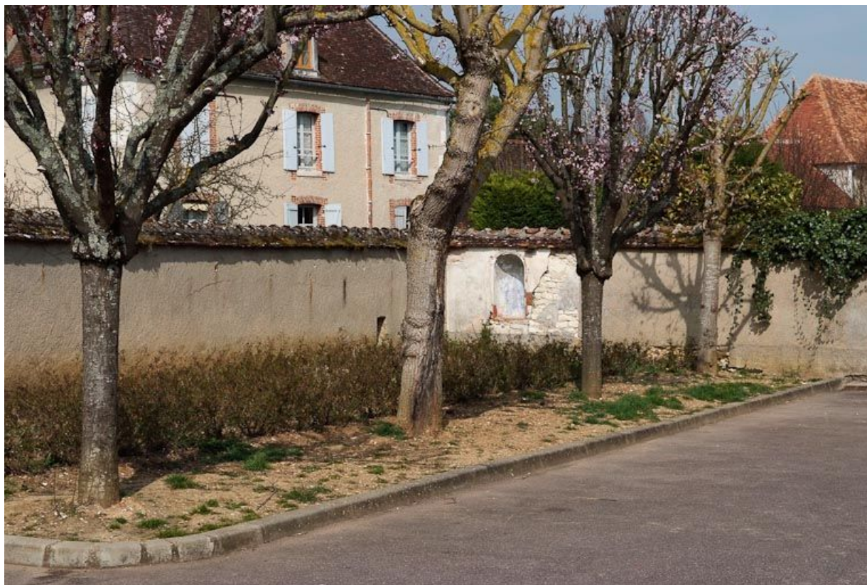
Ancien jardin des soeurs, vue vers le nord.

89, Seignelay, 2 rue du Docteur Chauvelot