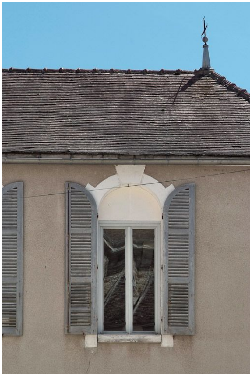
Corps de bâtiment est, ancienne fenêtre de la chapelle.

89, Seignelay, 2 rue du Docteur Chauvelot