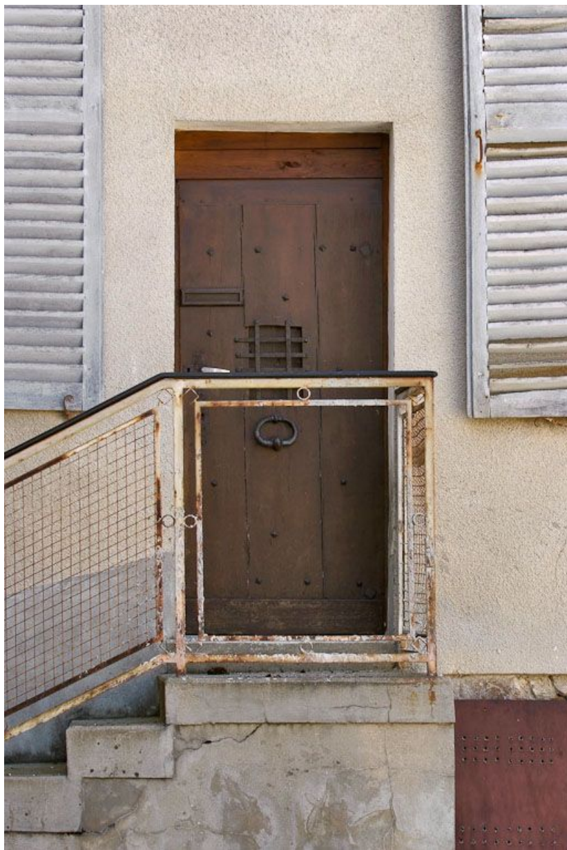
Porte d'origine de l'immeuble nord, remployée sur le bâtiment sud-ouest. 89, Seignelay, 2 rue du Docteur Chauvelot