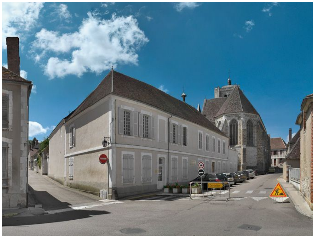
Vue de l'ancien hôpital à l'angle des rues Alphonse Darlot et Docteur Chauvelot. 89, Seignelay, 2 rue du Docteur Chauvelot