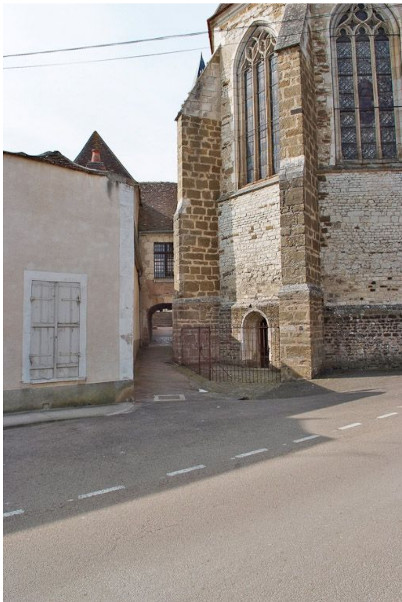
Passage sous le corps de bâtiment reliant l'église et l'ancien hôpital. 89, Seignelay, 2 rue du Docteur Chauvelot