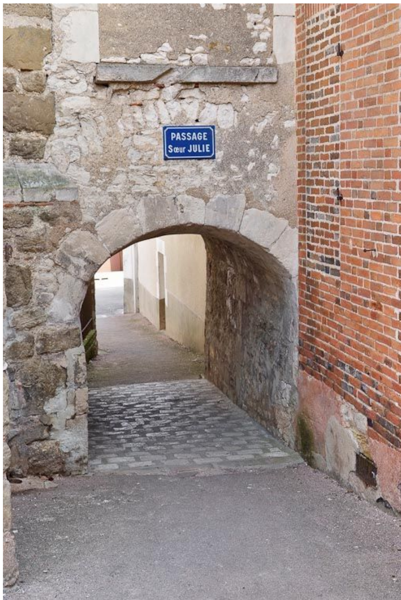
Passage couvert Soeur Julie entre l'église et l'ancien hôpital.

89, Seignelay, 2 rue du Docteur Chauvelot