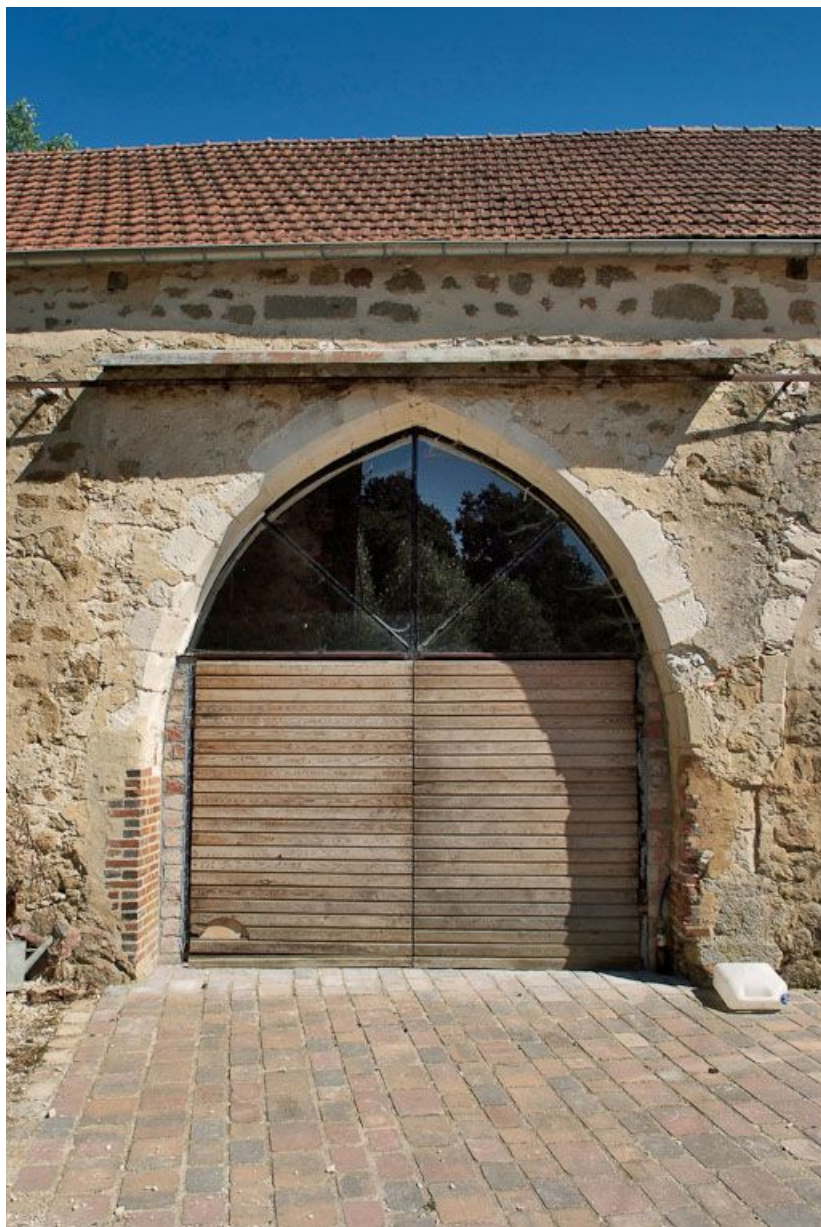
Chapelle : arcade transformée en porte du mur de long-pan sur cour. 89, Saint-Florentin, lieudit : la Maladrerie