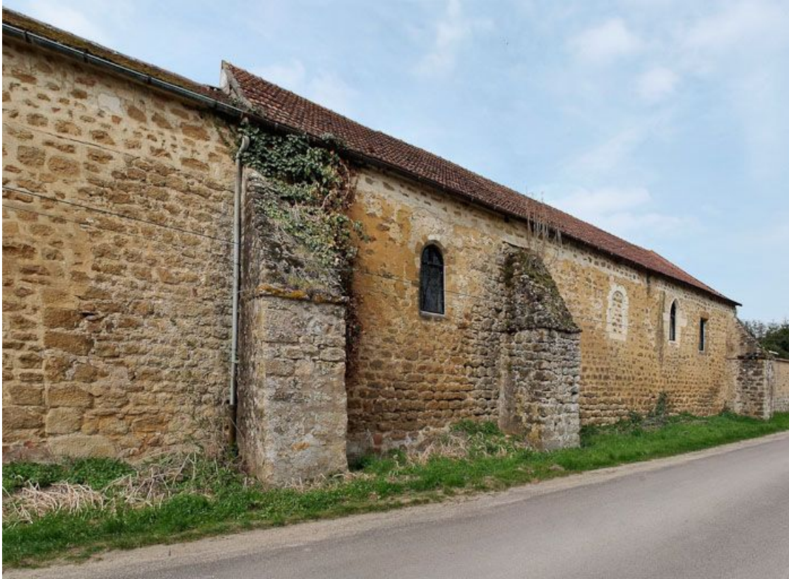
Chapelle : mur de long-pan sur rue. 89, Saint-Florentin, lieudit : la Maladrerie

N° de l'illustration : 20098900006NUC2AQ