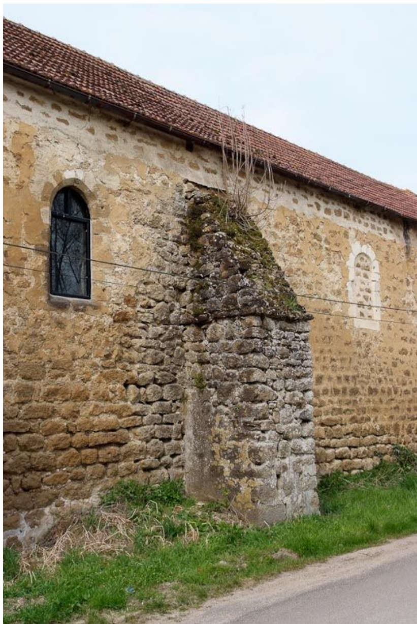
Chapelle : deuxième contrefort entre deux fenêtres du mur de long-pan sur rue. 89, Saint-Florentin, lieudit : la Maladrerie