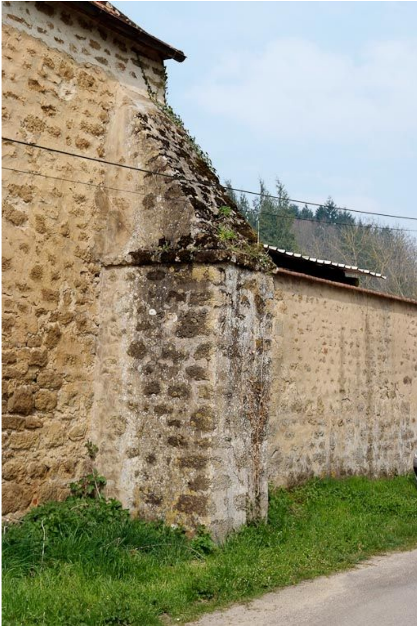
Chapelle : troisième contrefort du mur de long-pan sur rue. 89, Saint-Florentin, lieudit : la Maladrerie