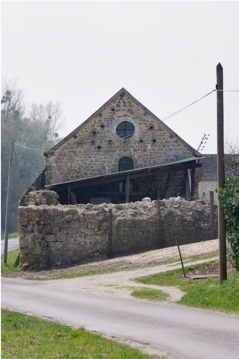
Chapelle : mur-pignon est, vue prise de la rue. 89, Saint-Florentin, lieudit : la Maladrerie