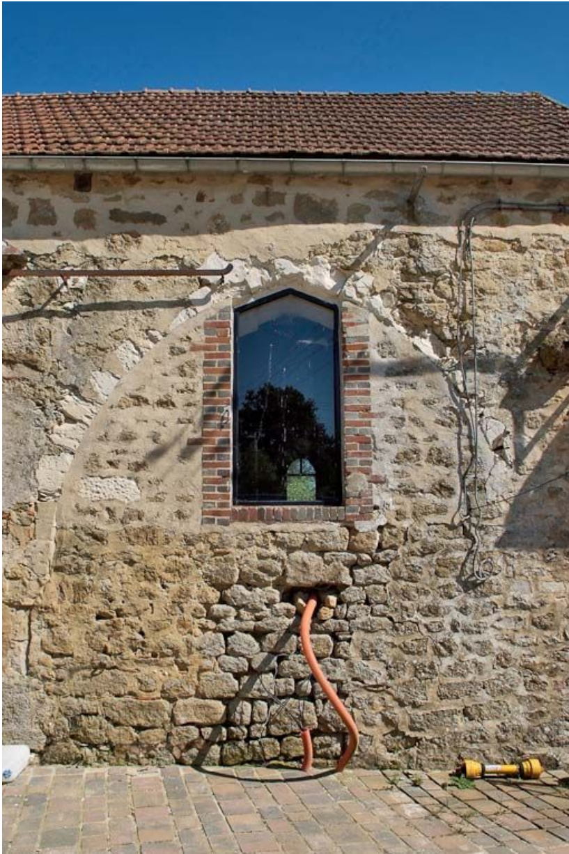
Chapelle : arcade en partie murée du mur de long-pan sur cour. 89, Saint-Florentin, lieudit : la Maladrerie