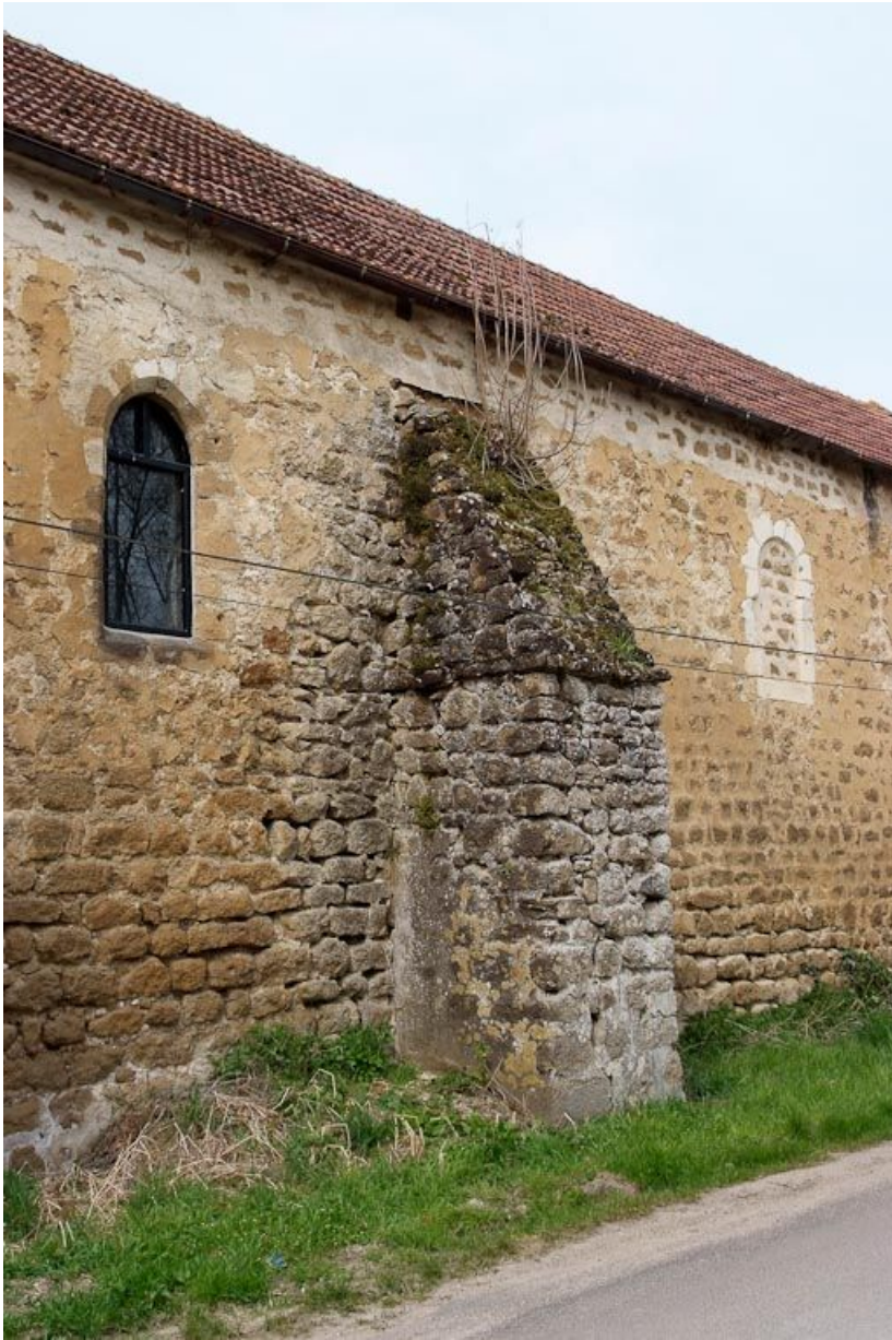
Chapelle : deuxième contrefort entre deux fenêtres du mur de long-pan sur rue. 89, Saint-Florentin, lieudit : la Maladrerie