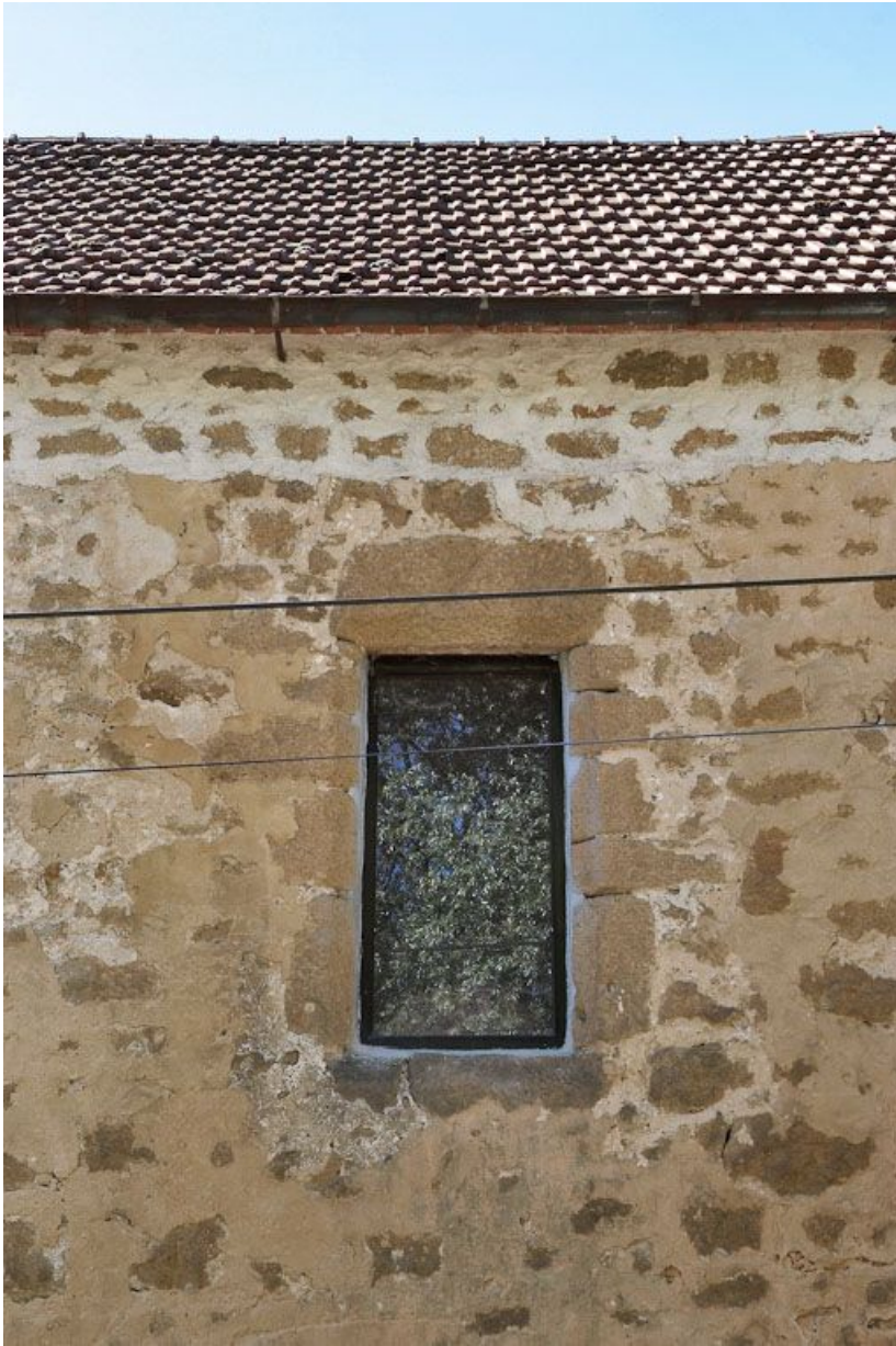
Chapelle : fenêtre rectangulaire du mur de long-pan sur rue.

89, Saint-Florentin, lieudit : la Maladrerie