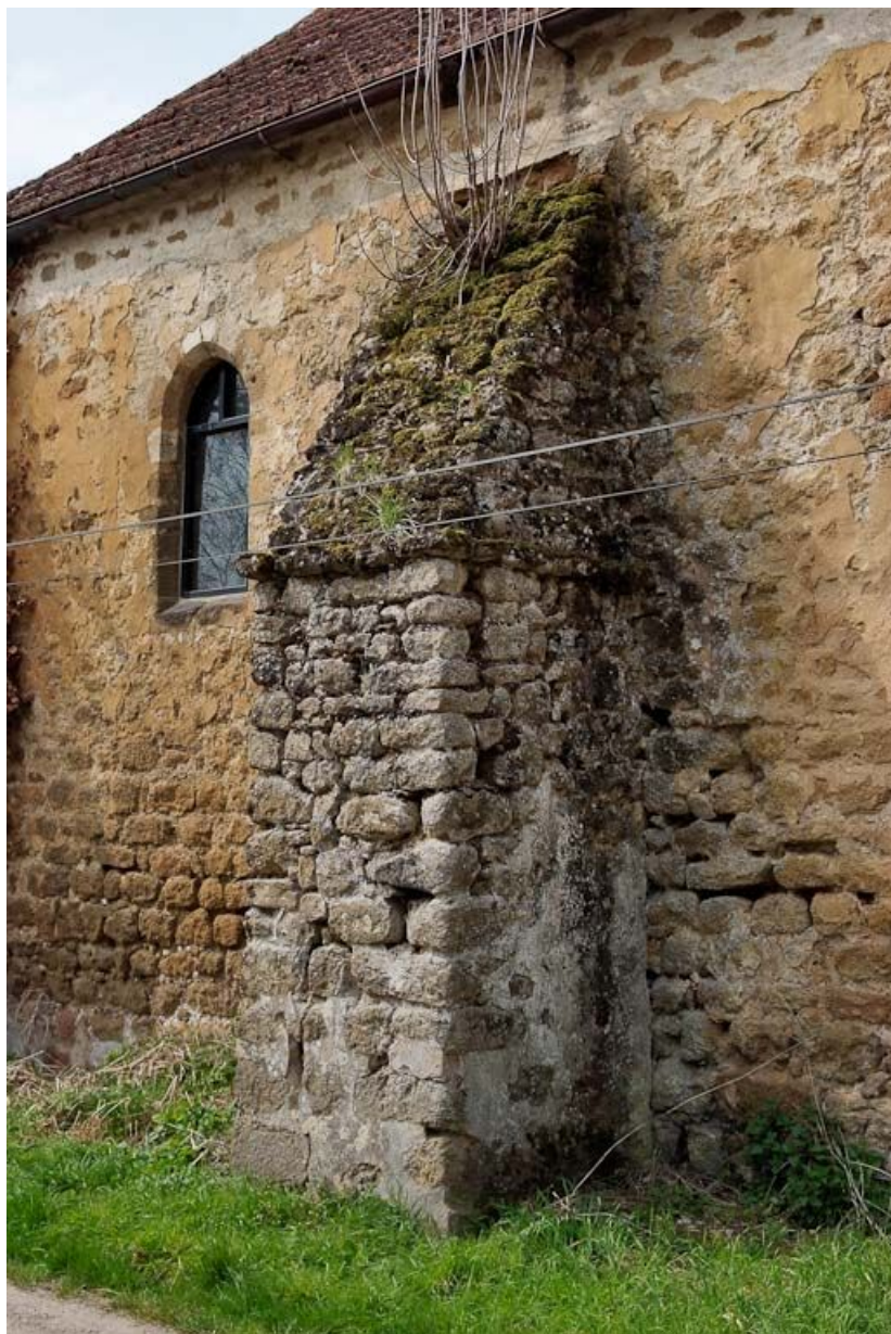
Chapelle : première fenêtre et deuxième contrefort du mur de long-pan sur rue. 89, Saint-Florentin, lieudit : la Maladrerie