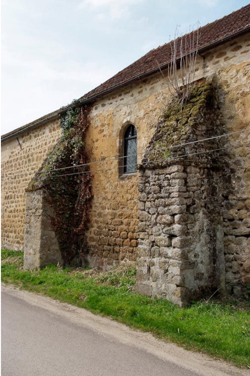
Chapelle : fenêtre entre le premier et le deuxième contrefort du mur de long-pan sur rue. 89, Saint-Florentin, lieudit : la Maladrerie