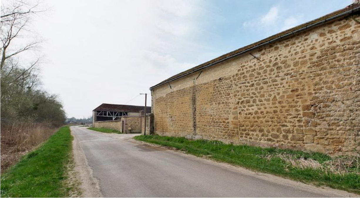
Hangar : mur postérieur sur rue.

89, Saint-Florentin, lieudit : la Maladrerie