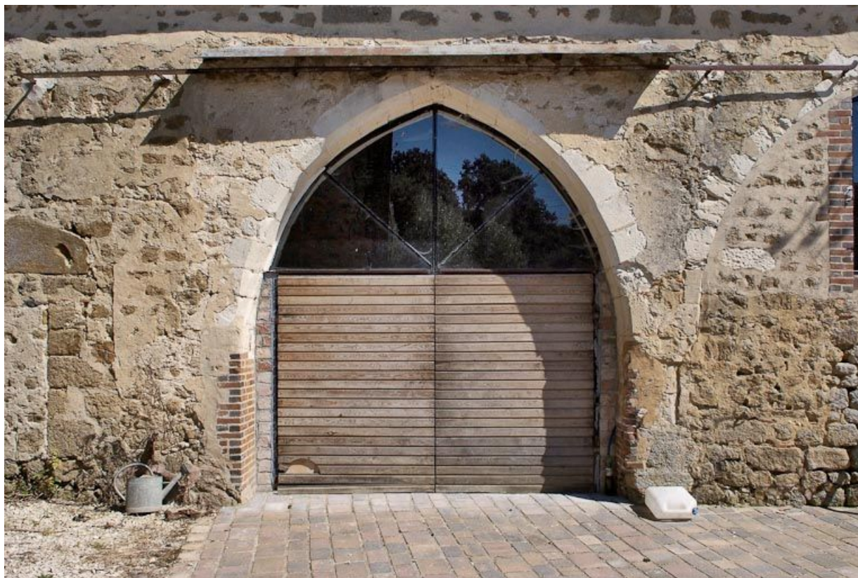
Chapelle : arcade transformée en porte du mur de long-pan sur cour. 89, Saint-Florentin, lieudit : la Maladrerie