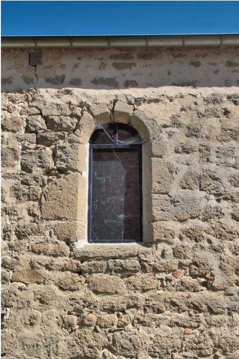
Chapelle : deuxième fenêtre gauche du mur de long-pan sur cour. 89, Saint-Florentin, lieudit : la Maladrerie