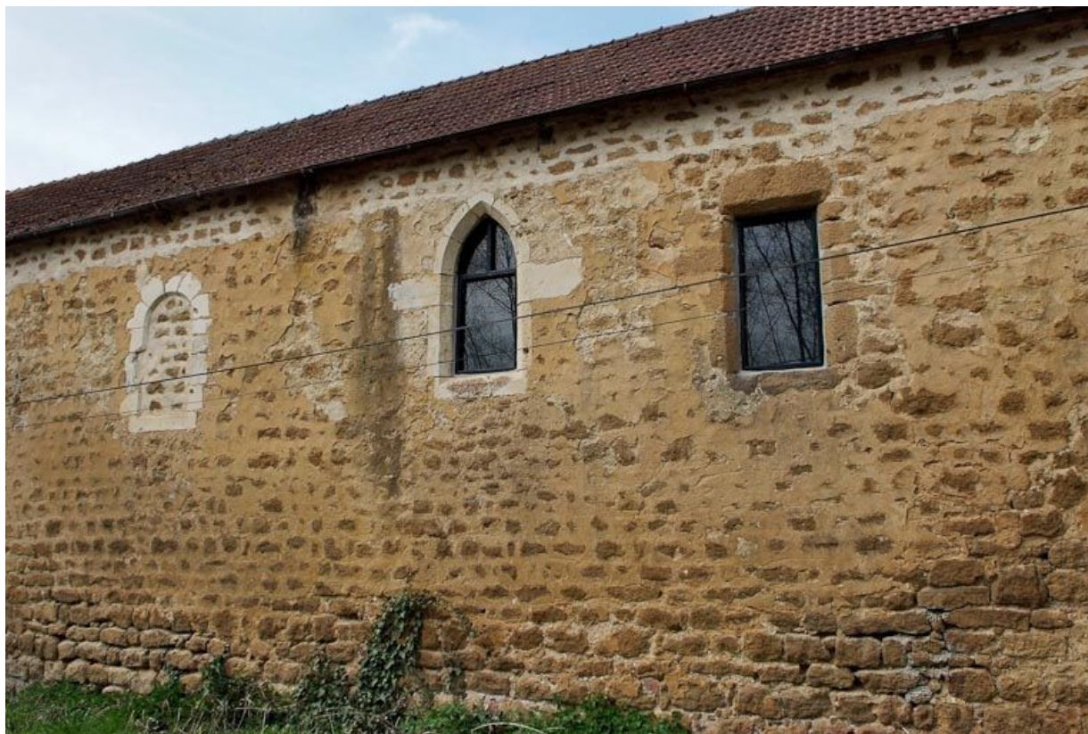
Chapelle : les trois fenêtres droite du mur de long-pan sur rue.

89, Saint-Florentin, lieudit : la Maladrerie