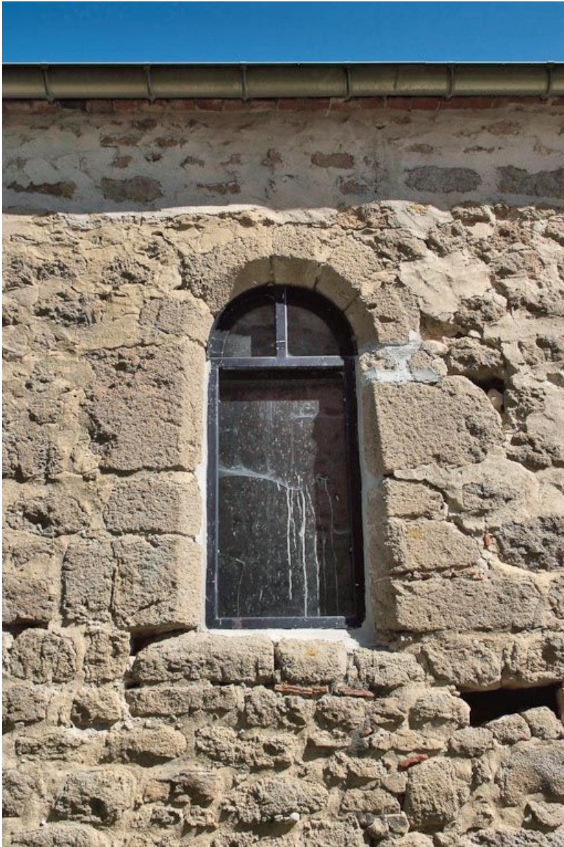
Chapelle : première fenêtre gauche du mur de long-pan sur cour. 89, Saint-Florentin, lieudit : la Maladrerie