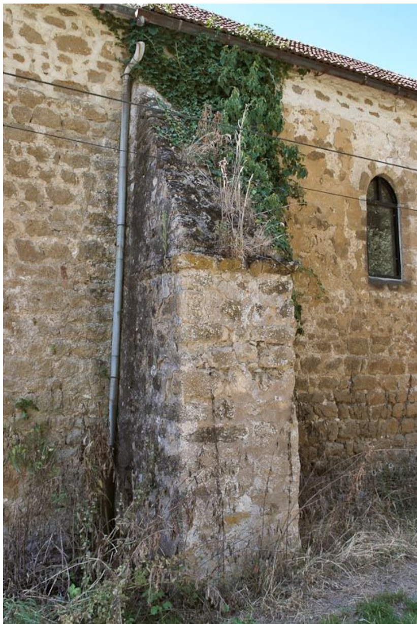
Chapelle : premier contrefort gauche du mur de long-pan sur rue. 89, Saint-Florentin, lieudit : la Maladrerie