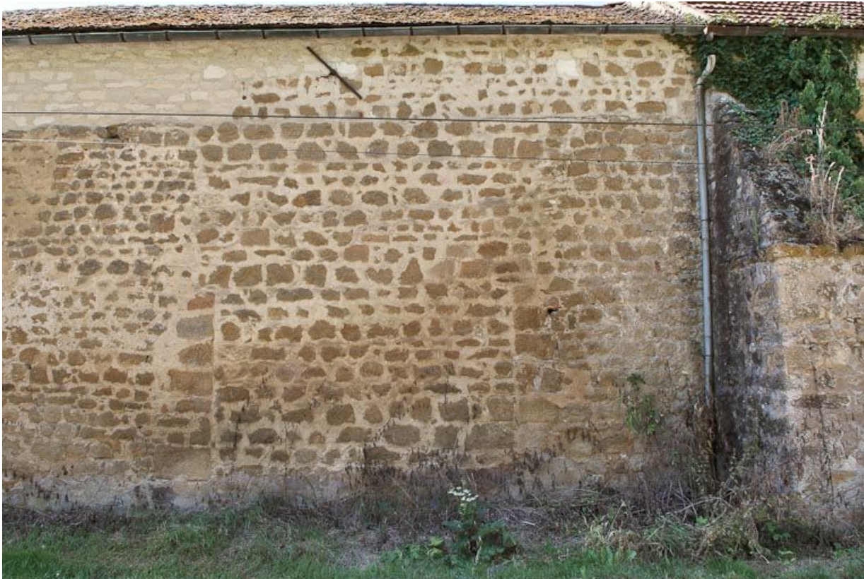
Hangar : mur postérieur sur rue avec traces d'un ancien portail.

89, Saint-Florentin, lieudit : la Maladrerie