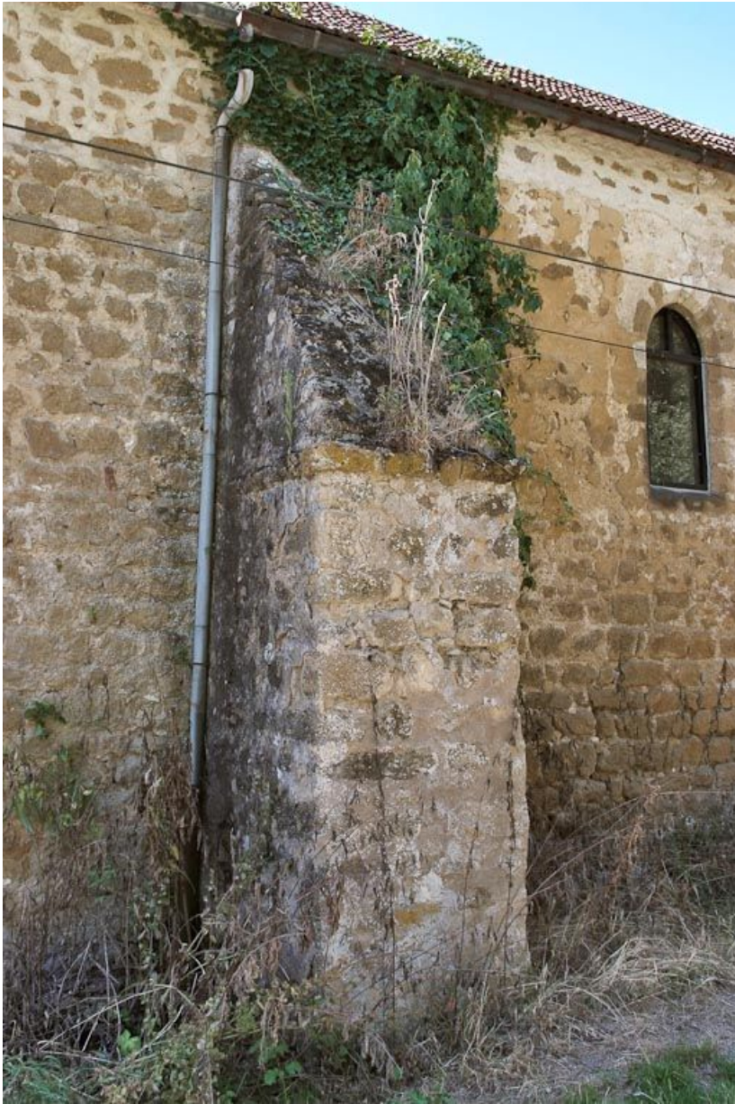
Chapelle : premier contrefort gauche du mur de long-pan sur rue. 89, Saint-Florentin, lieudit : la Maladrerie