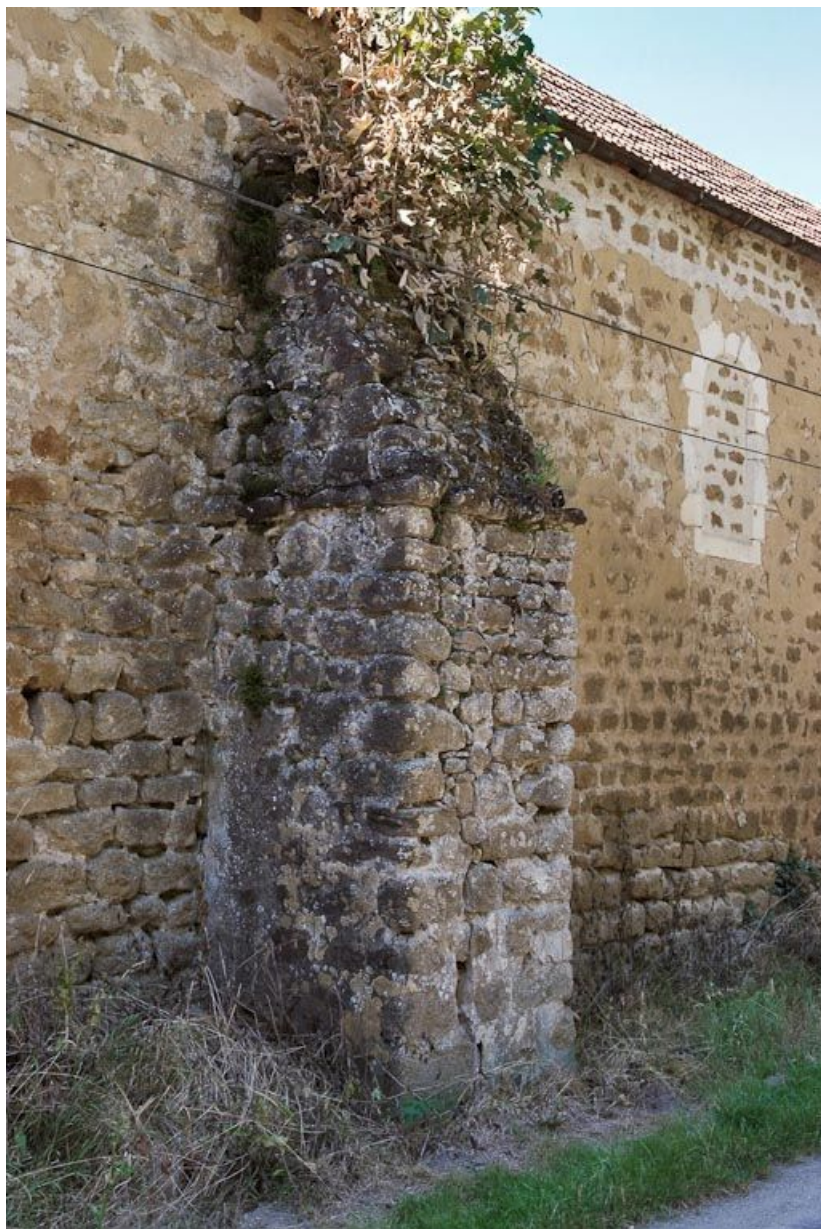
Chapelle : contrefort central du mur de long-pan sur rue. 89, Saint-Florentin, lieudit : la Maladrerie