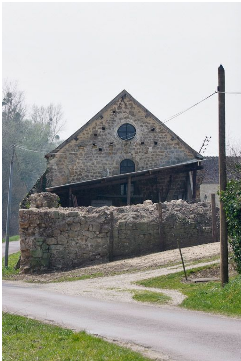
Chapelle : mur-pignon est, vue prise de la rue. 89, Saint-Florentin, lieudit : la Maladrerie