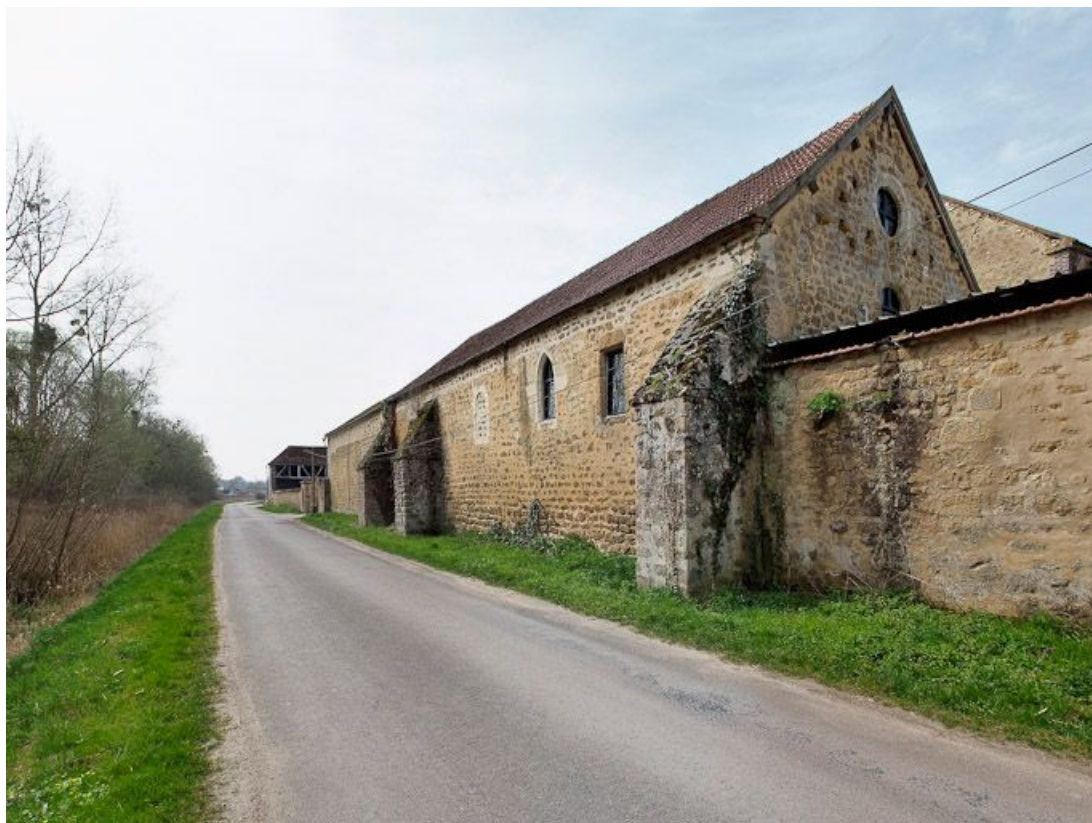
Chapelle, vue d'ensemble depuis la rue.

89, Saint-Florentin, lieudit : la Maladrerie