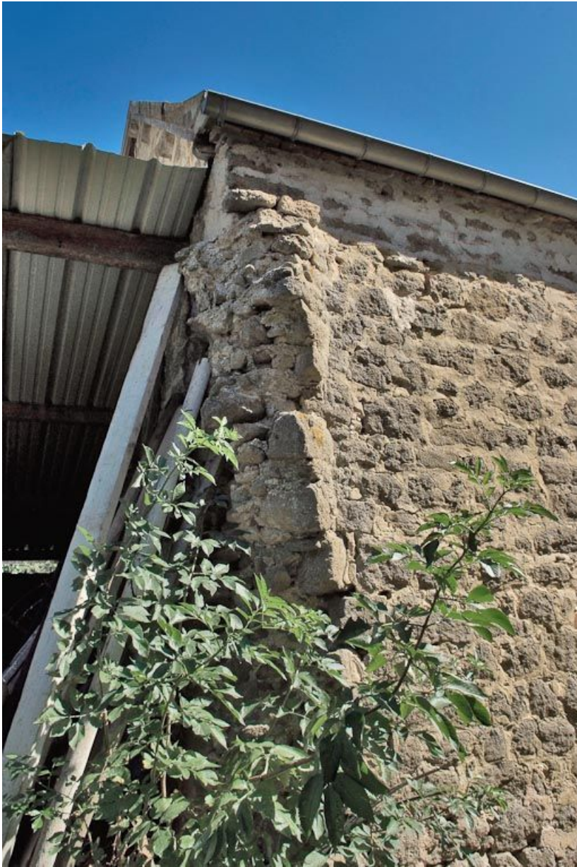
Chapelle : contrefort sur cour du mur-pignon est.

89, Saint-Florentin, lieudit : la Maladrerie