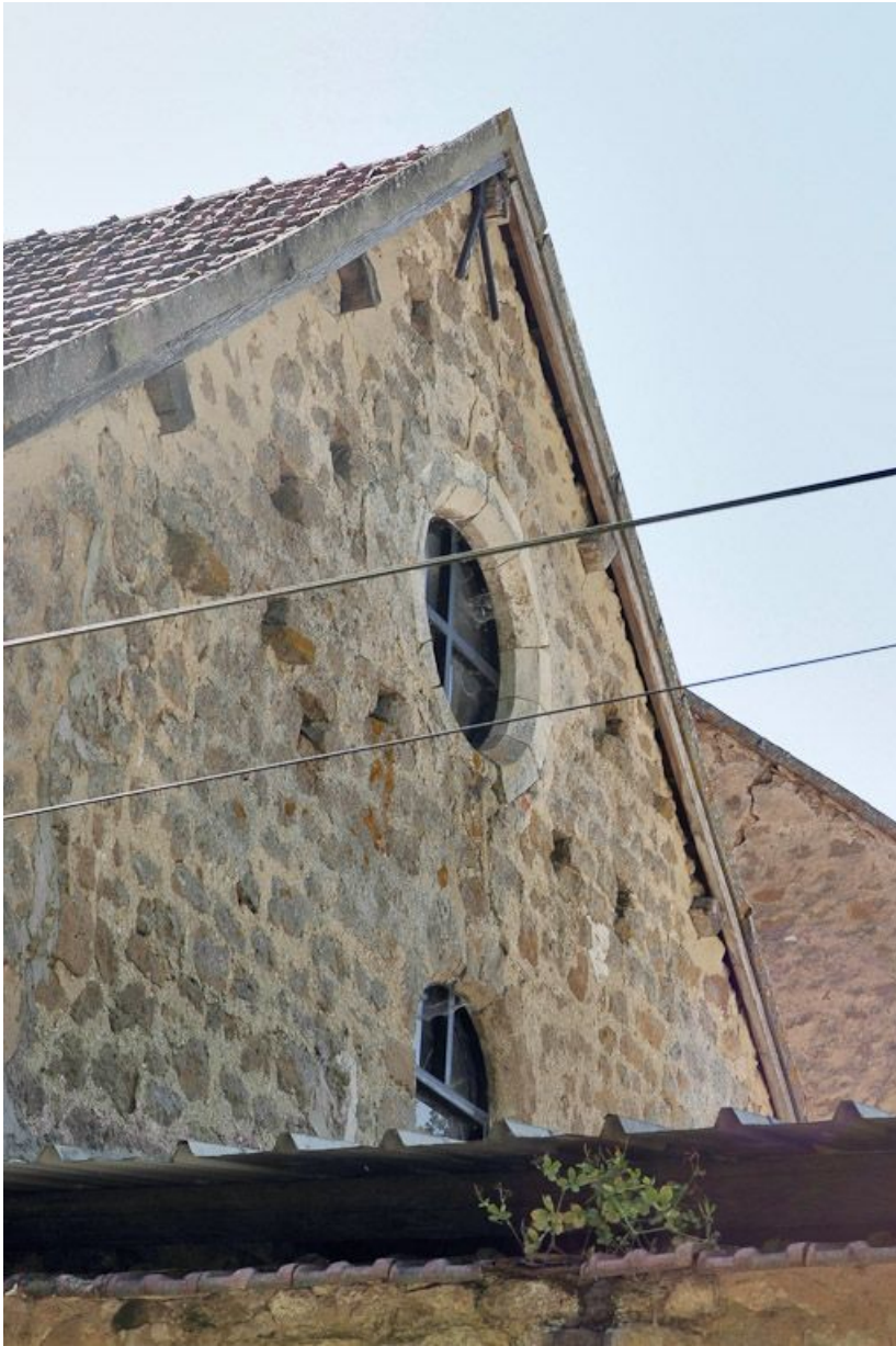
Chapelle : pignon est.

89, Saint-Florentin, lieudit : la Maladrerie