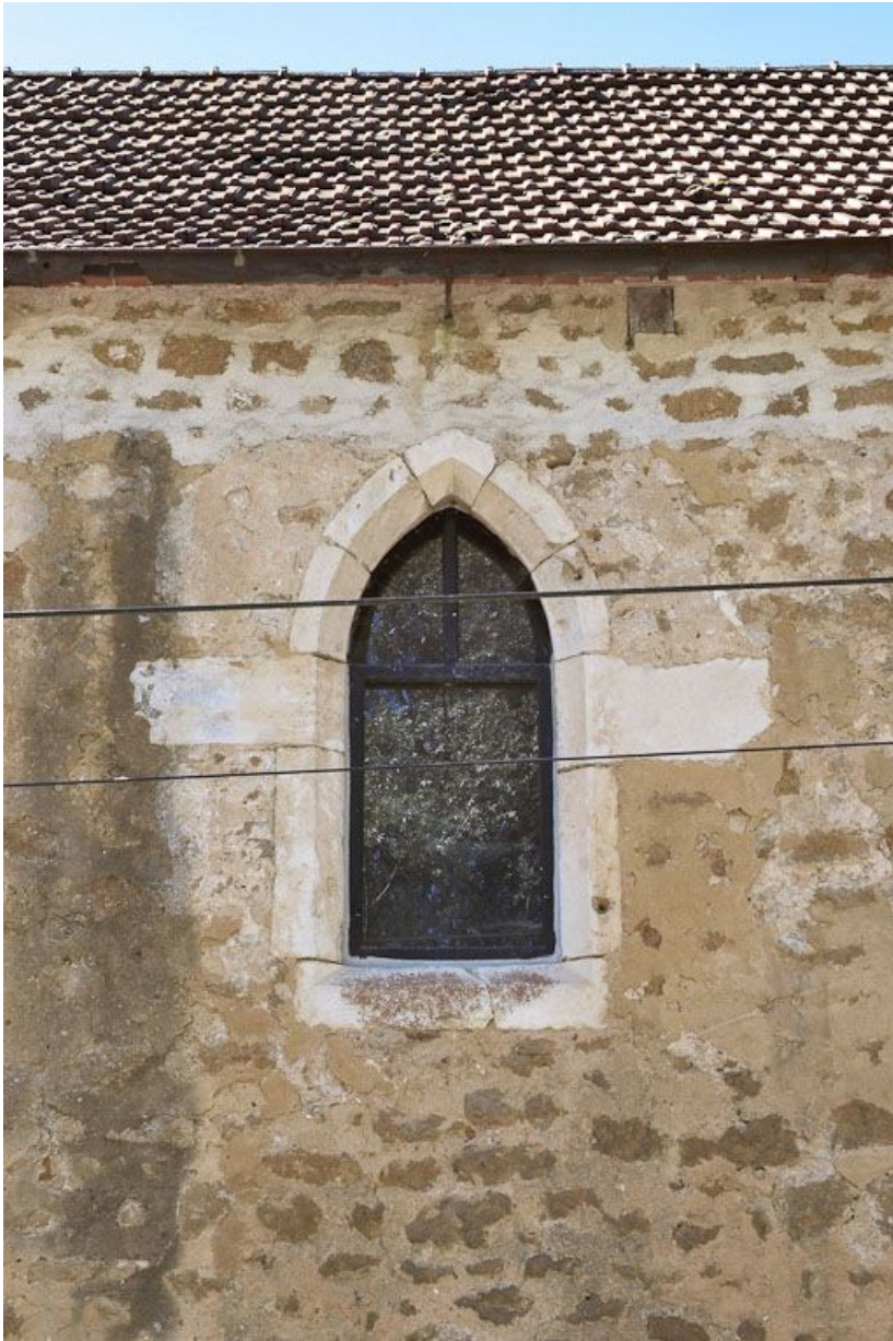
Chapelle : fenêtre brisée du mur de long-pan sur rue. 89, Saint-Florentin, lieudit : la Maladrerie