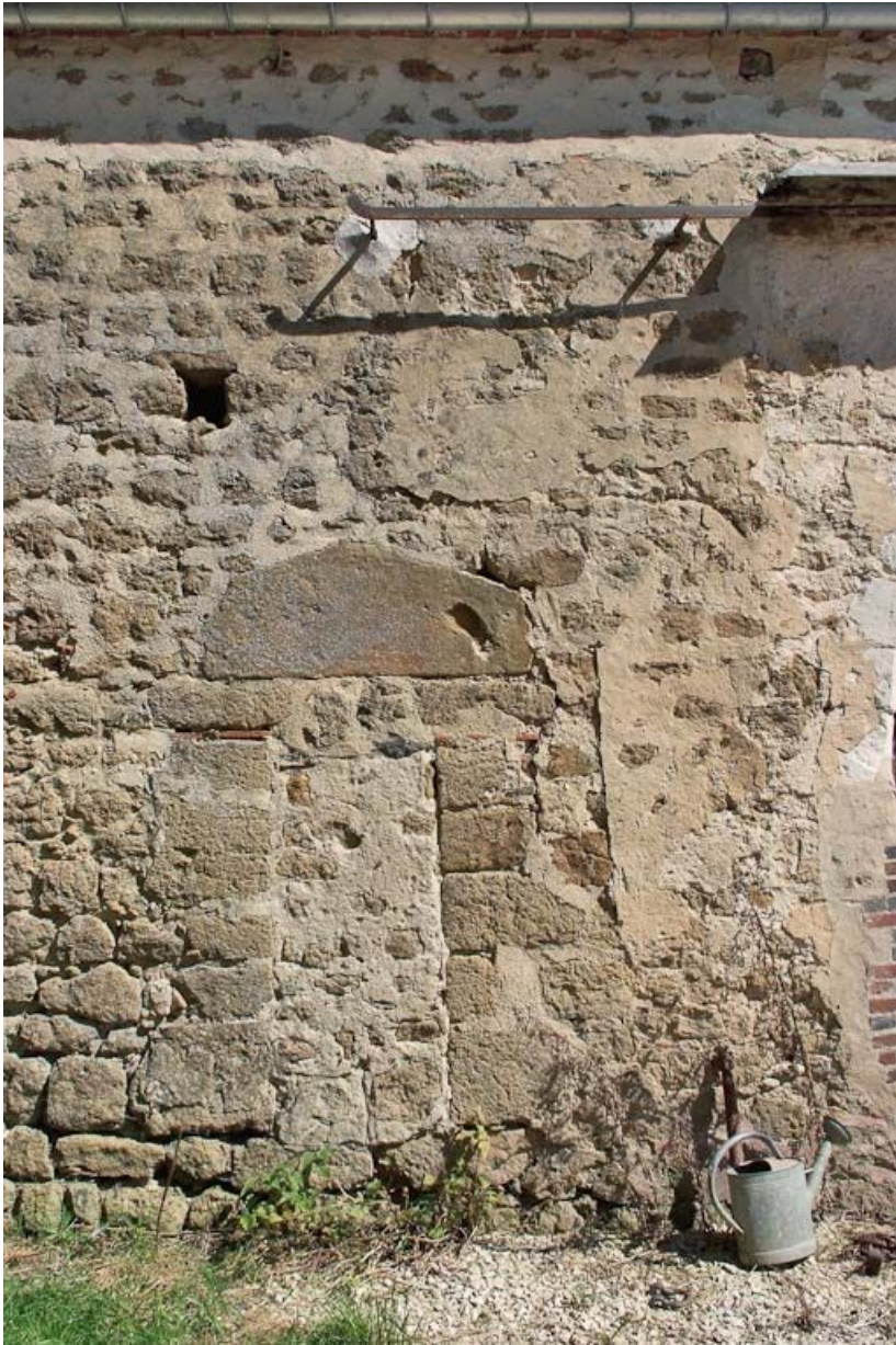
Chapelle : étroite porte murée dans le mur de long-pan sur cour.

89, Saint-Florentin, lieudit : la Maladrerie