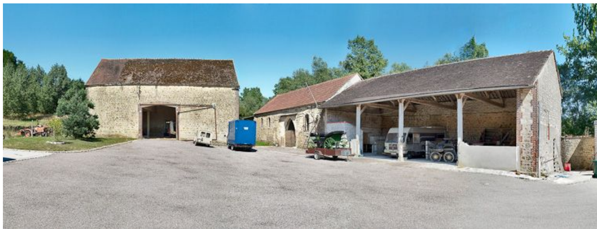
Vue d'ensemble de la grange, l'ancienne chapelle et le hangar depuis la cour.

89, Saint-Florentin, lieudit : la Maladrerie