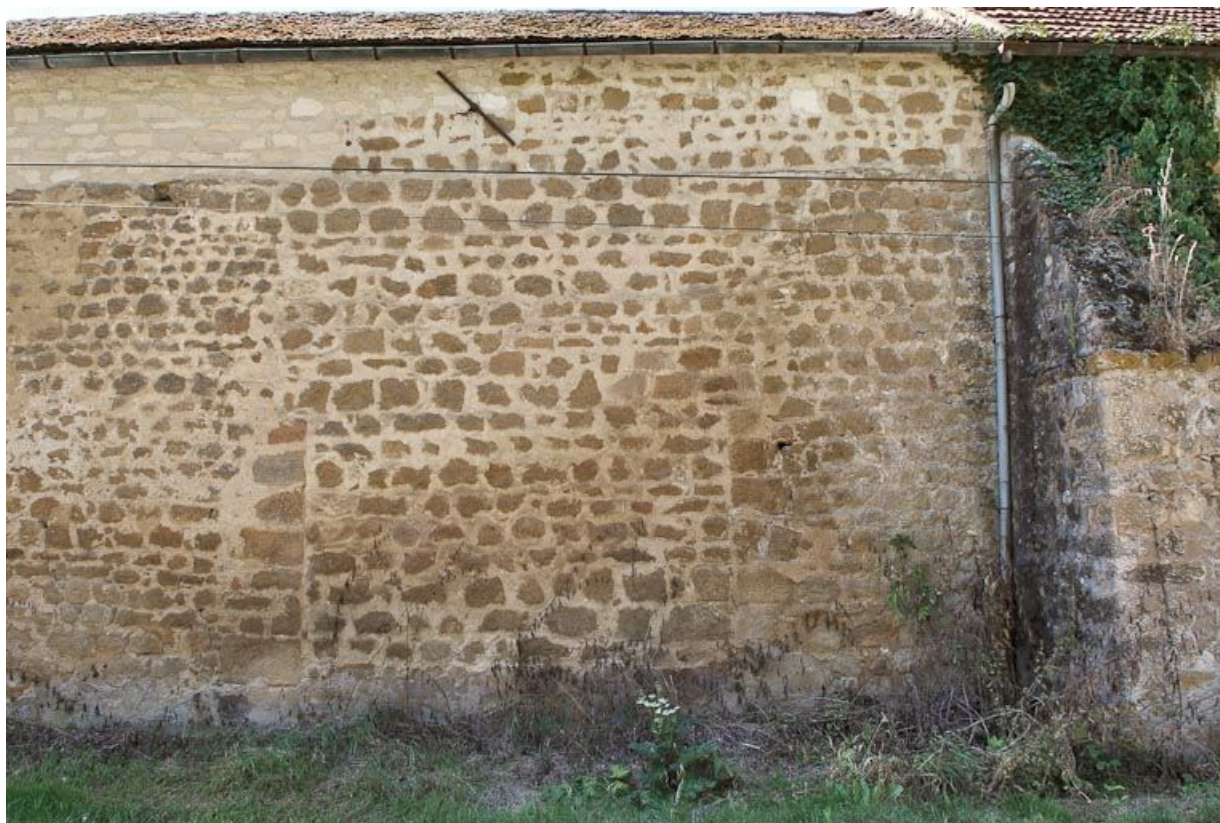
Hangar : mur postérieur sur rue avec traces d'un ancien portail.

89, Saint-Florentin, lieudit : la Maladrerie