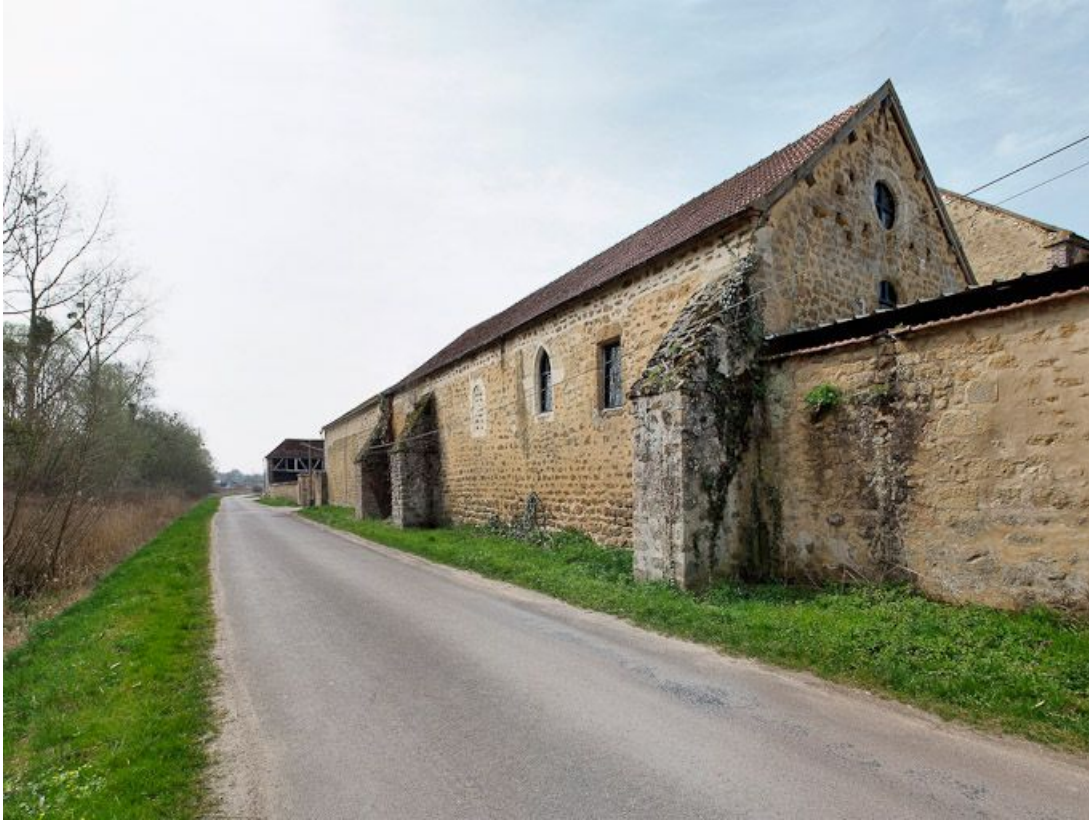
Chapelle, vue d'ensemble depuis la rue.

89, Saint-Florentin, lieudit : la Maladrerie