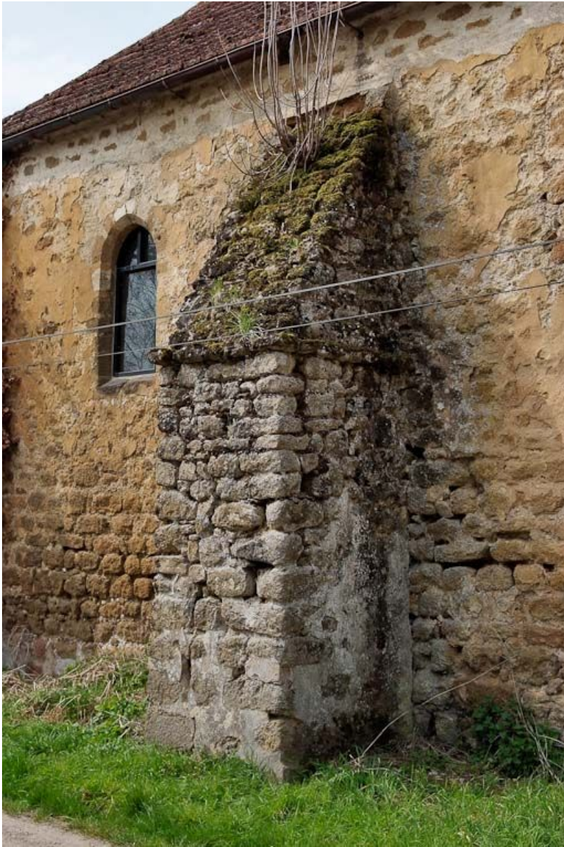
Chapelle : première fenêtre et deuxième contrefort du mur de long-pan sur rue. 89, Saint-Florentin, lieudit : la Maladrerie