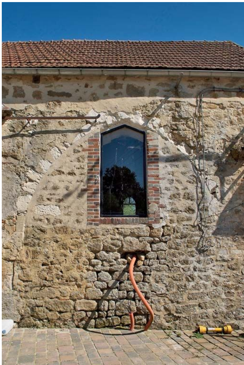
Chapelle : arcade en partie murée du mur de long-pan sur cour. 89, Saint-Florentin, lieudit : la Maladrerie