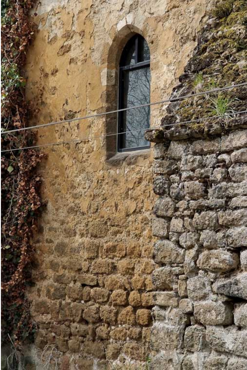
Chapelle : première fenêtre du mur de long-pan sur rue.

89, Saint-Florentin, lieudit : la Maladrerie