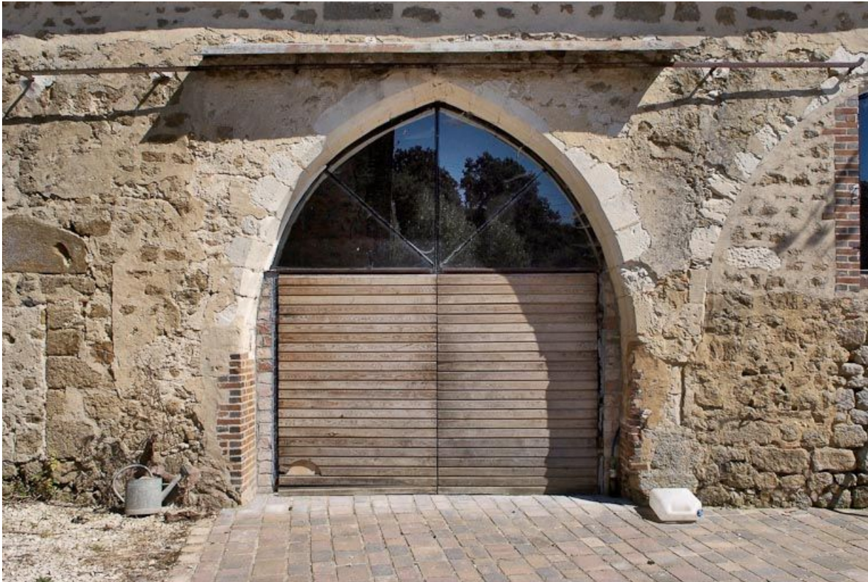
Chapelle : arcade transformée en porte du mur de long-pan sur cour.

89, Saint-Florentin, lieudit : la Maladrerie