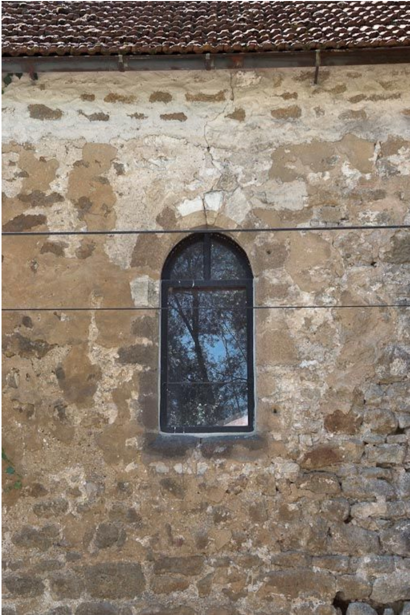
Chapelle : fenêtre en plein-cintre du mur de long-pan sur rue.

89, Saint-Florentin, lieudit : la Maladrerie