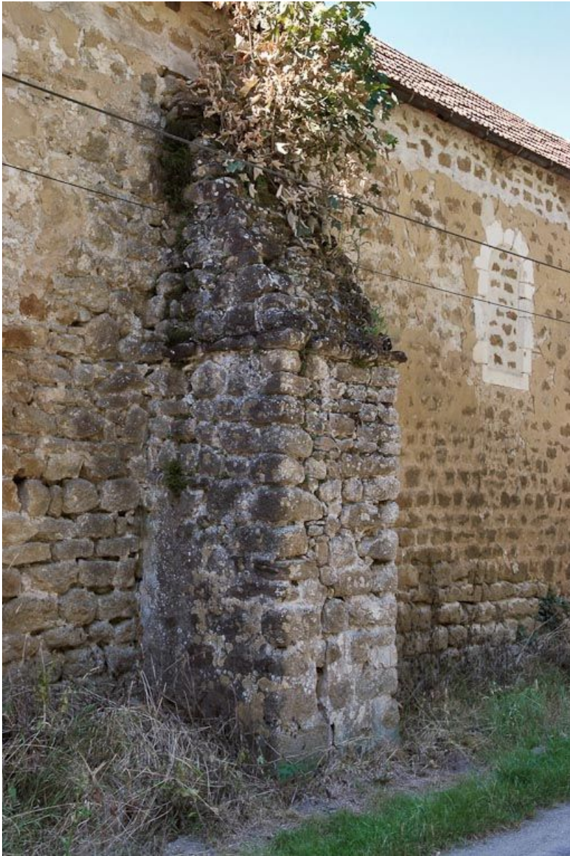
Chapelle : contrefort central du mur de long-pan sur rue. 89, Saint-Florentin, lieudit : la Maladrerie