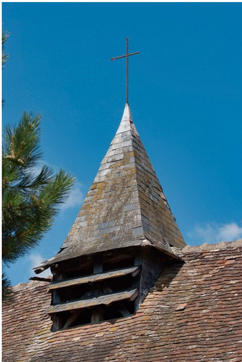
Bâtiment principal : face antérieure du clocheton.

89, Saint-Fargeau, 9 rue du Moulin de l'Arche