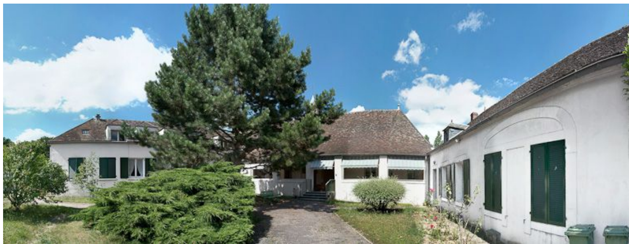
Bâtiment principal avec un des corps perpendiculaires à sa façade et un des bâtiments isolés.

89, Saint-Fargeau, 9 rue du Moulin de l'Arche