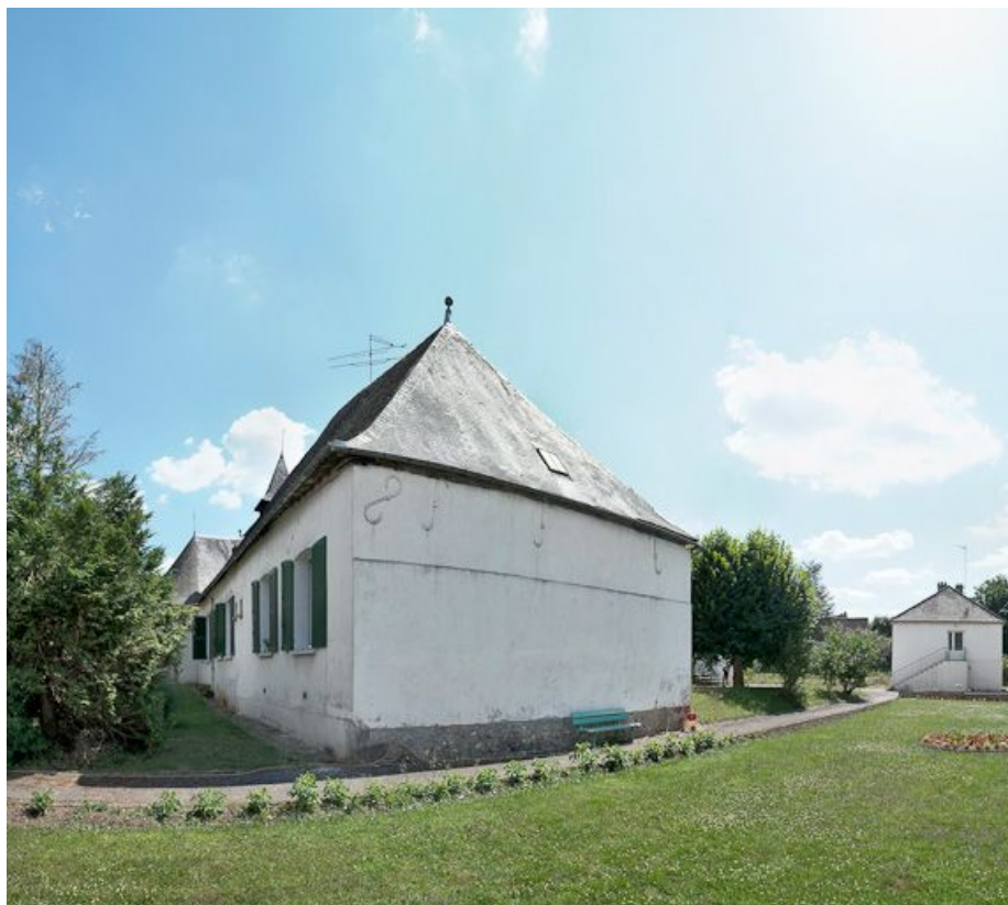
Élévation gauche du bâtiment principal et bâtiment isolé à l'ouest.

89, Saint-Fargeau, 9 rue du Moulin de l'Arche