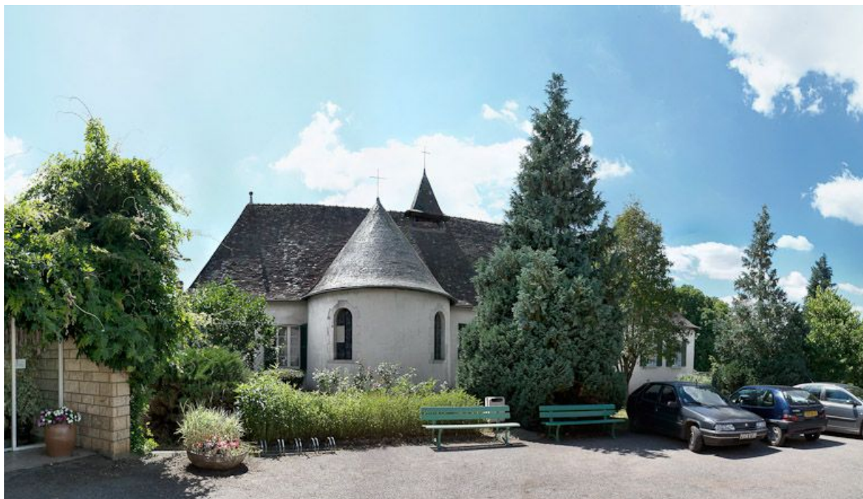
Bâtiment principal : élévation postérieure. 89, Saint-Fargeau, 9 rue du Moulin de l'Arche