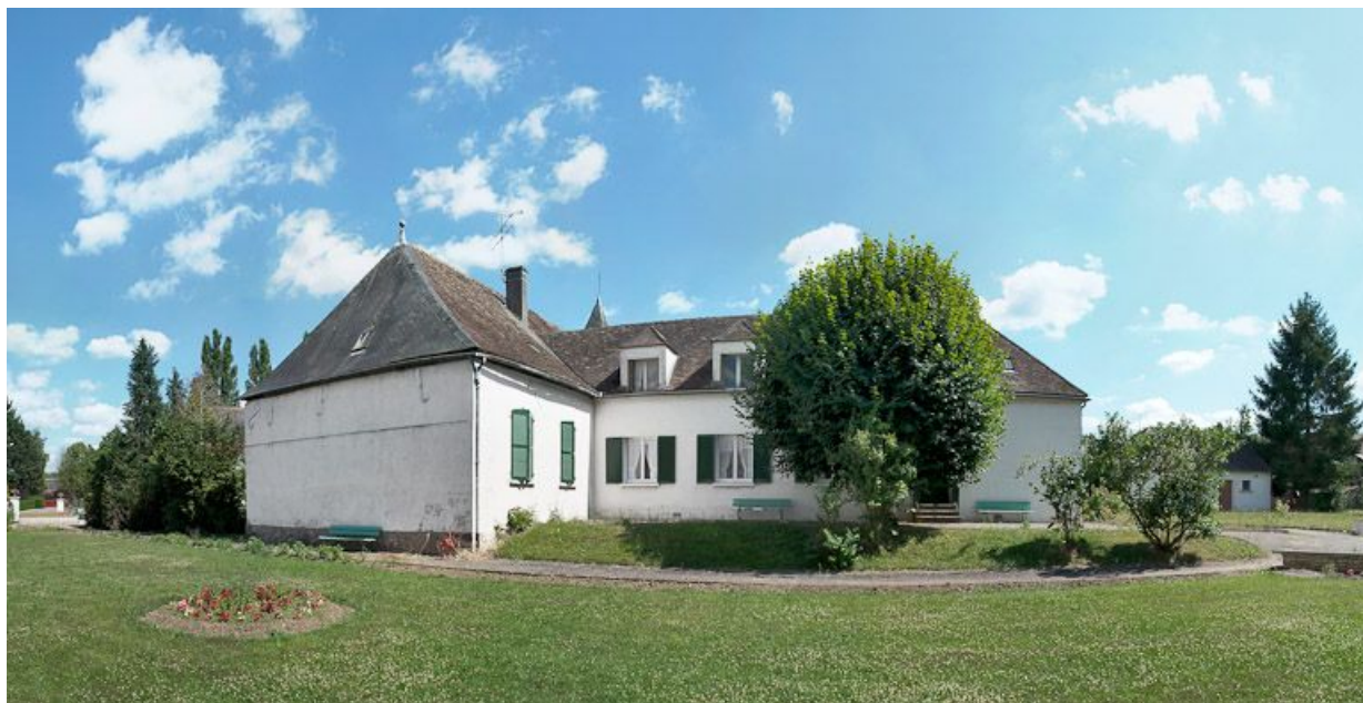
Angle formé par le bâtiment principal et un corps perpendiculaire à sa façade. 89, Saint-Fargeau, 9 rue du Moulin de l'Arche