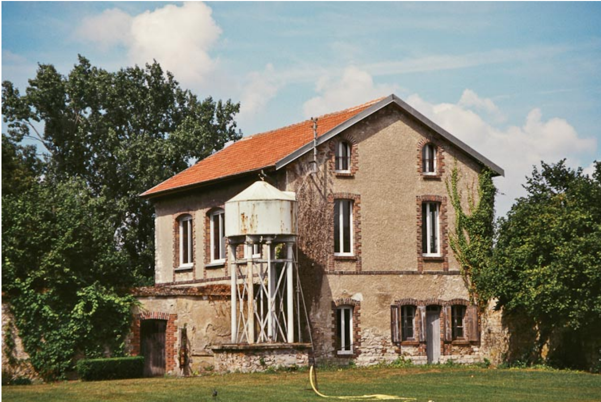
Vue de la maison adossée au mur de clôture nord, à ouvertures encadrées de briques, accostée d'un puits surmonté d'une réserve d'eau métallique.