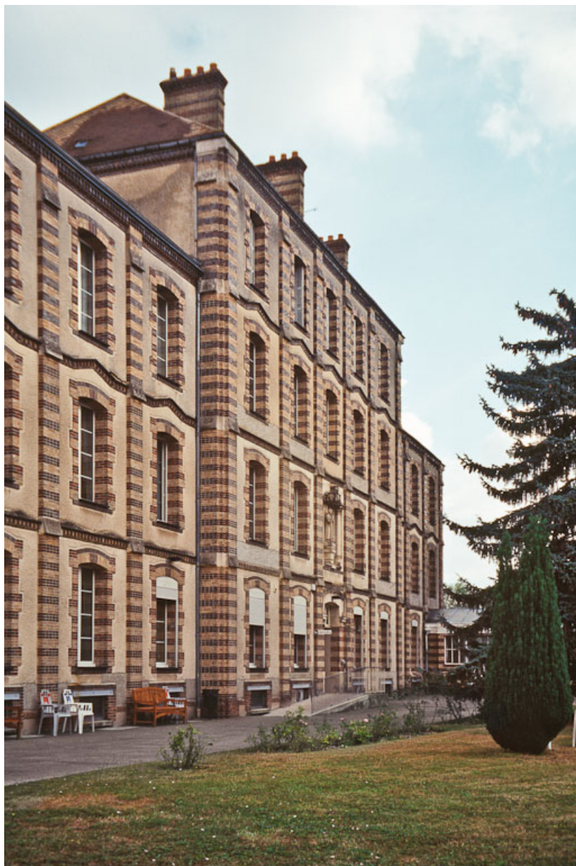
Vue du bâtiment conventuel. 89, Saint-Denis Sainte-Colombe