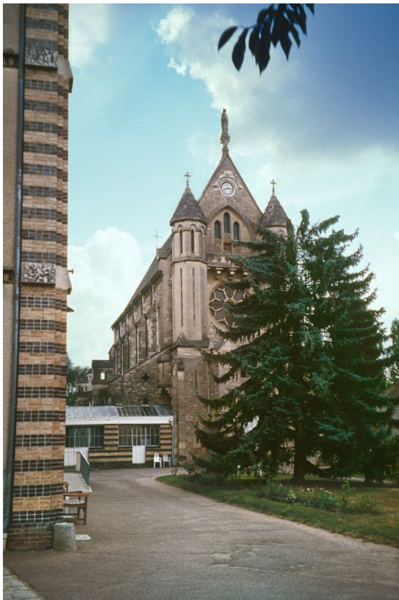
Chapelle et galerie la reliant au bâtiment conventuel.