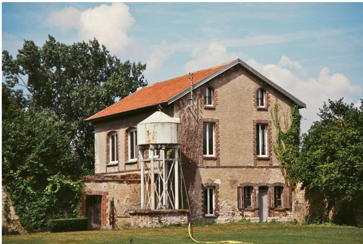
Vue de la maison adossée au mur de clôture nord, à ouvertures encadrées de briques, accostée d'un puits surmonté d'une réserve d'eau métallique.