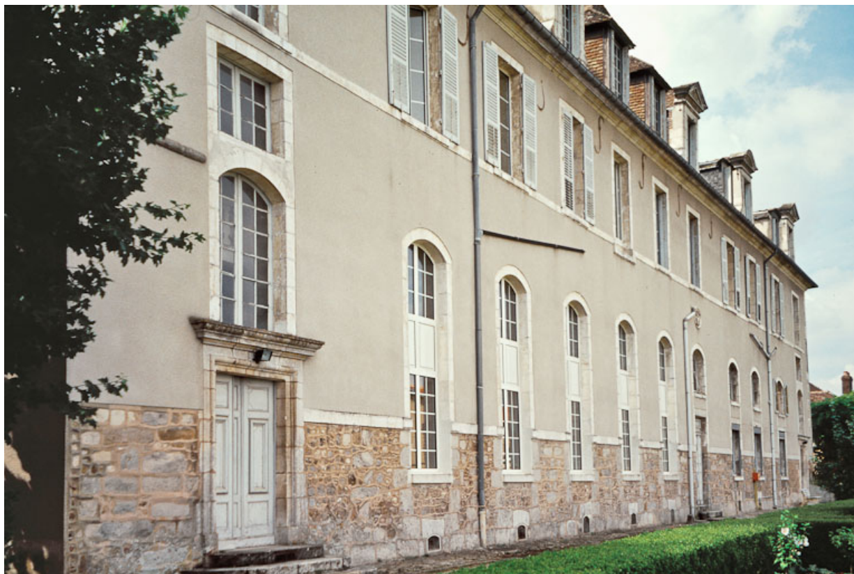
Vue du bâtiment de plan rectangulaire qui abrite au rez-de-chaussée le réfectoire de l'ancien monastère. 89, Saint-Denis Sainte-Colombe