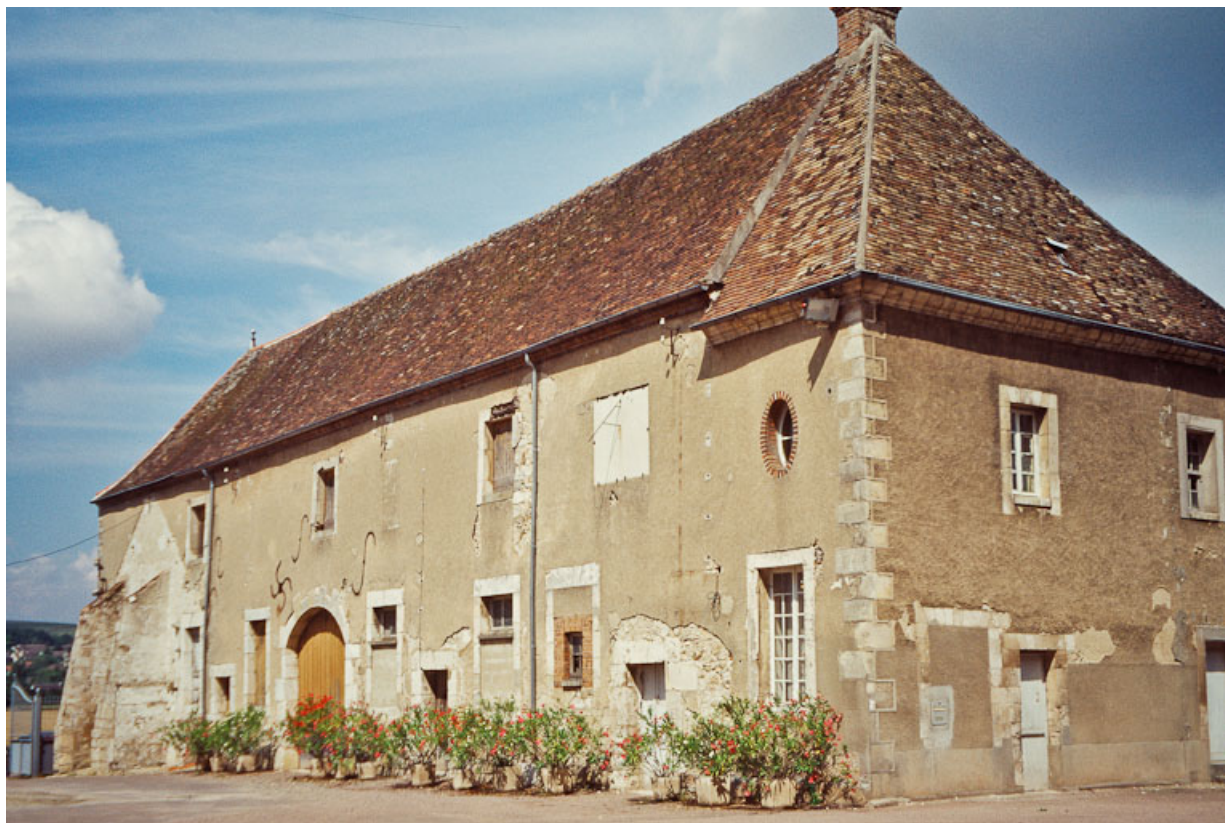
Vue du bâtiment agricole.