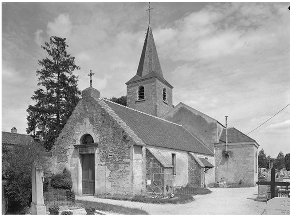
Façades ouest et sud 89, Aisy-sur-Armançon