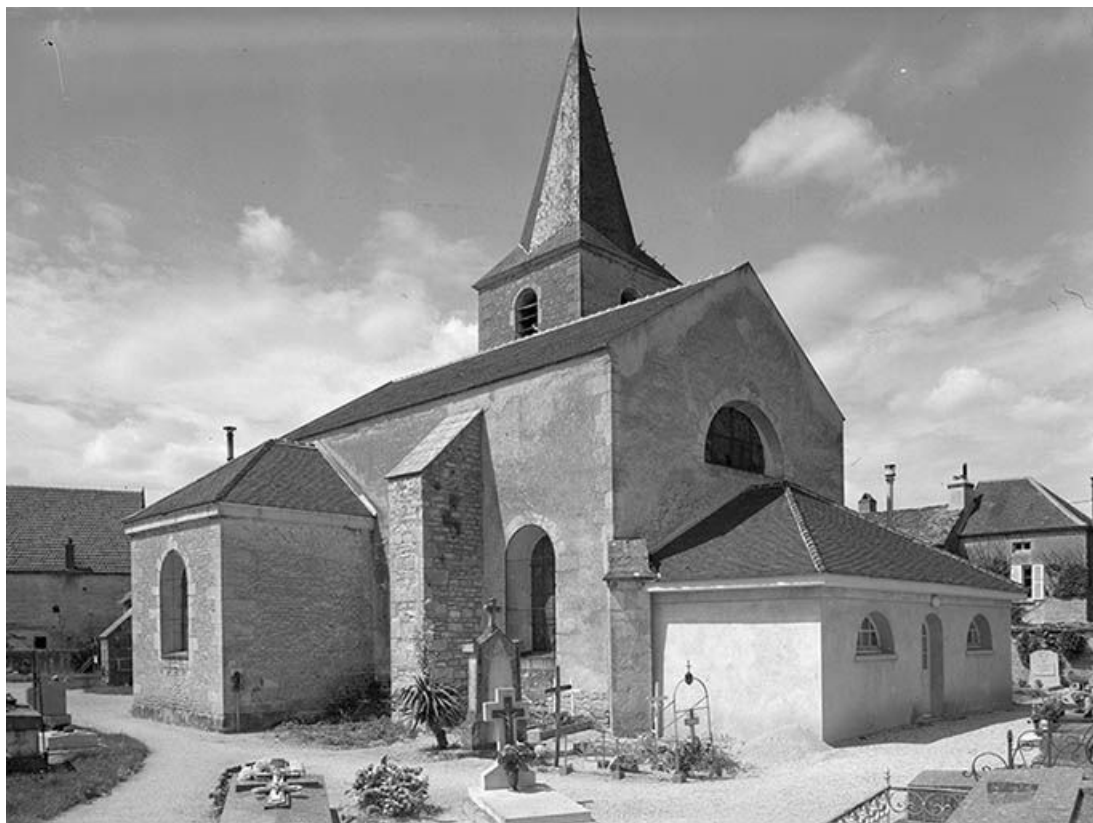
Façade sud et chevet 89, Aisy-sur-Armançon