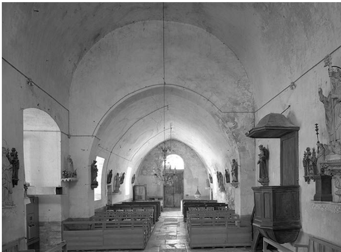
Vue de la nef depuis le chœur