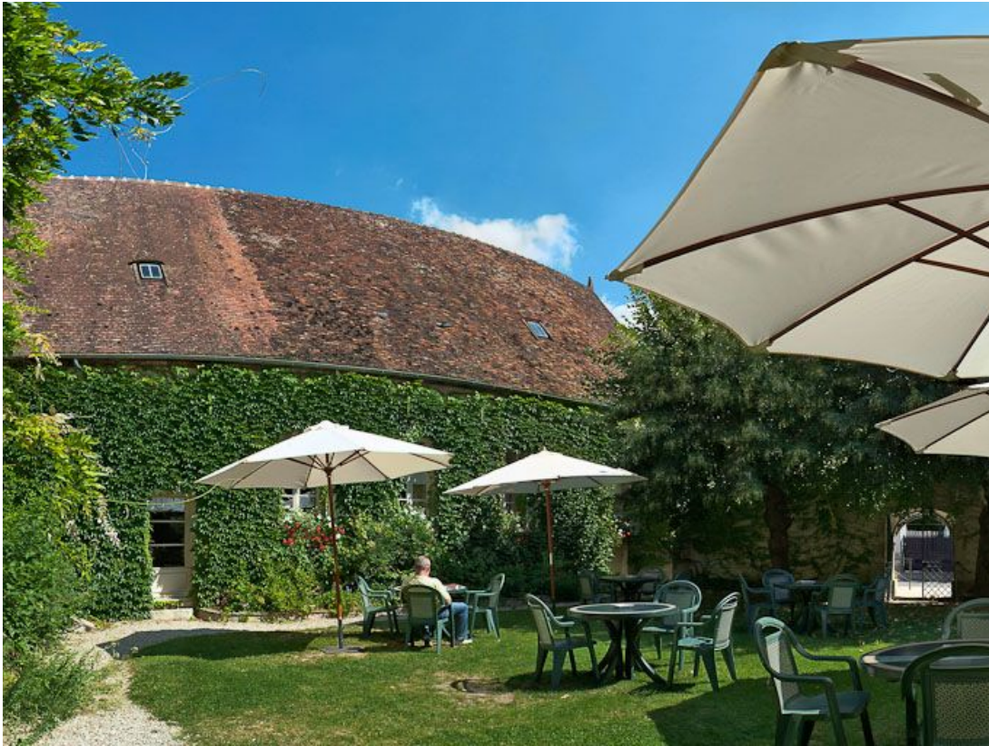
Vue de la cour.