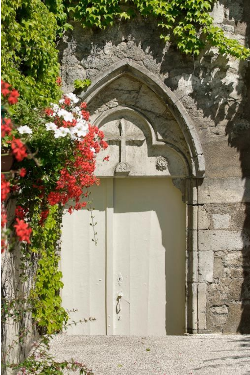
Porte de la chapelle.