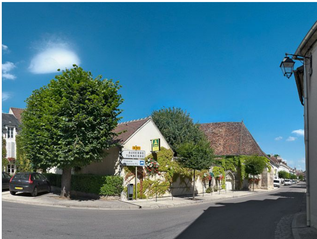
Vue d'ensemble depuis la rue. 89, Chablis, 18 rue Jules Rathier