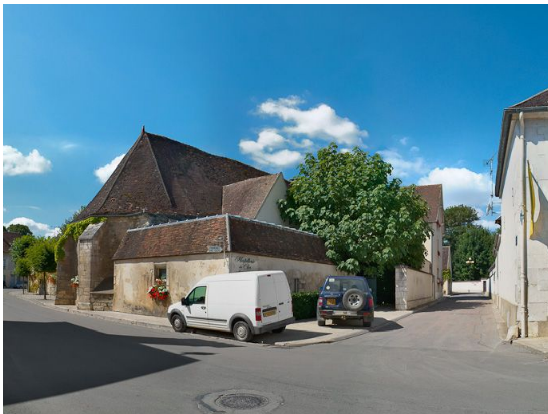
Chevet de la chapelle vu depuis la rue.