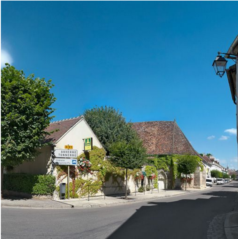
Vue des bâtiments depuis la rue.