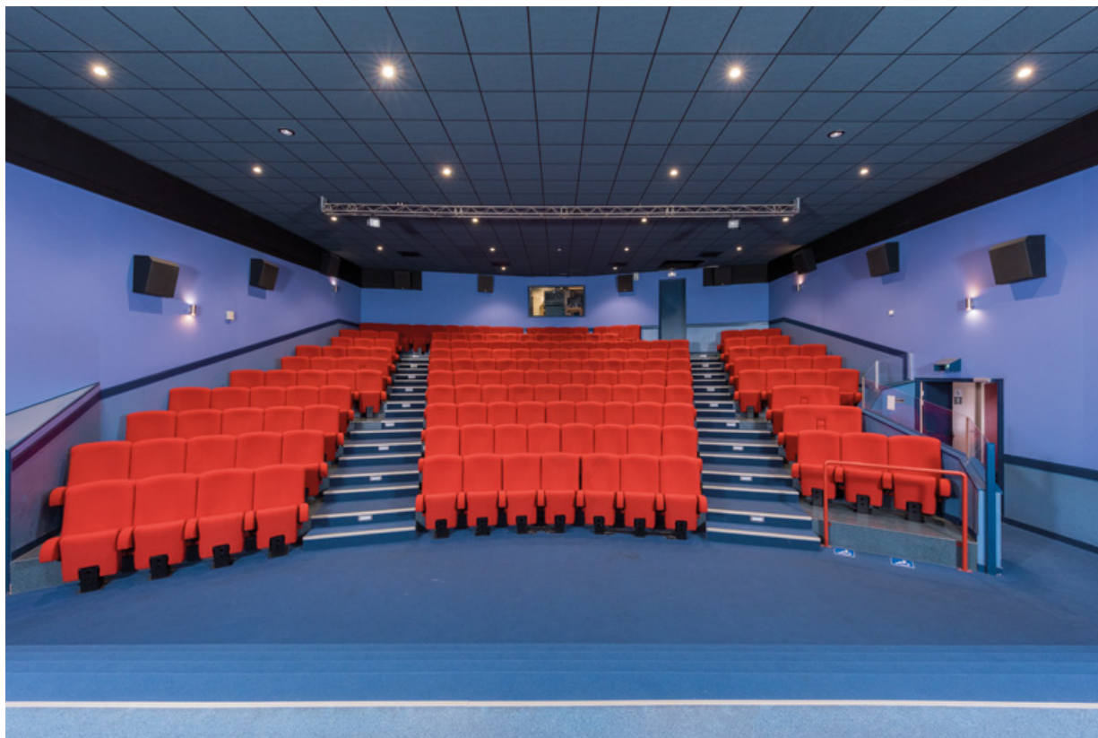
Salle, vue depuis l'écran.