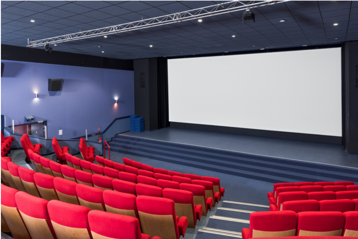
Salle, vue vers l'écran, de trois quarts droite.