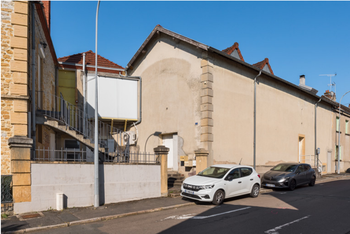
La salle, vue depuis le carrefour de la rue Danton et de la rue Renan. 71, Gueugnon, 10 rue Danton