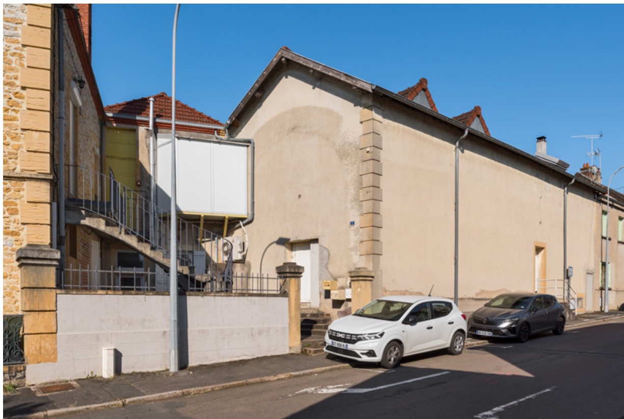
La salle, vue depuis le carrefour de la rue Danton et de la rue Renan. 71, Gueugnon, 10 rue Danton