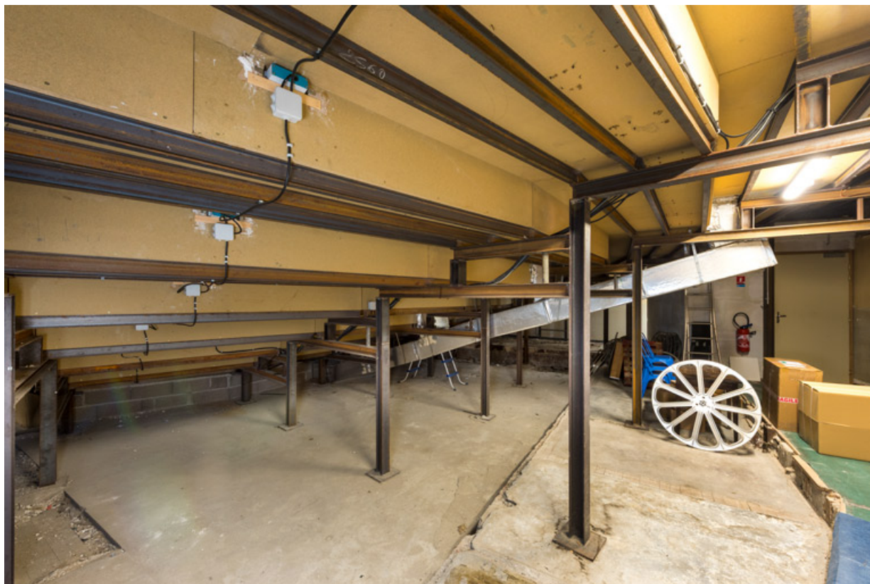
Espace sous les gradins de la salle.