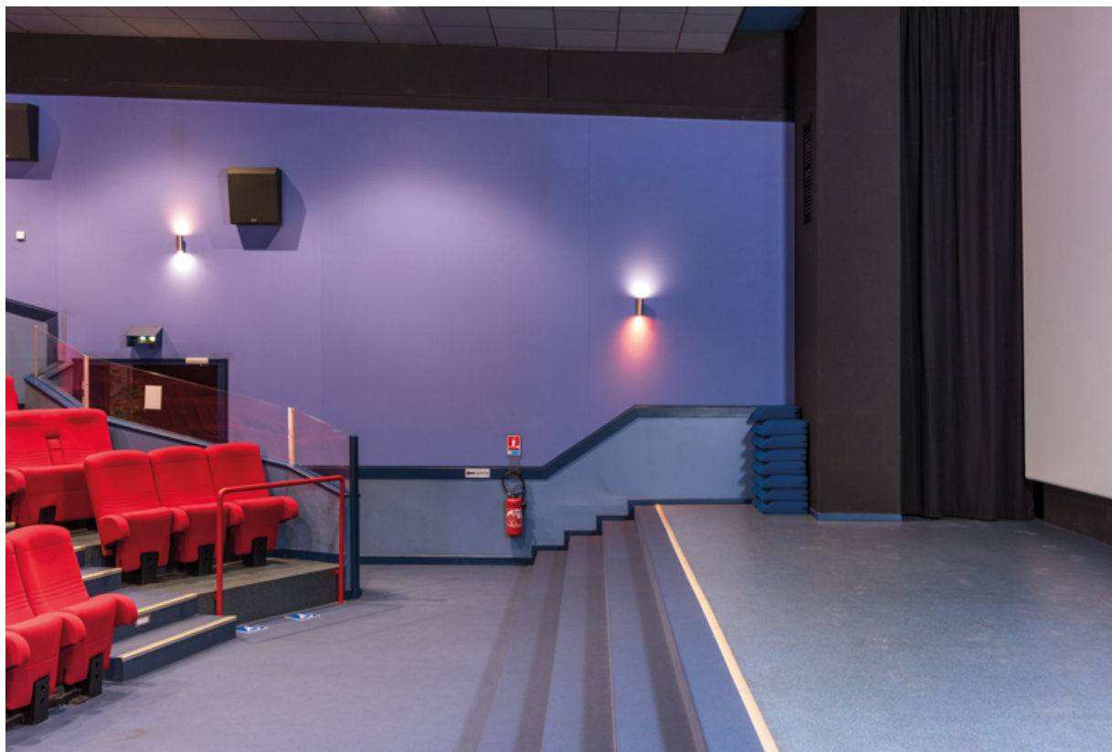
Salle : gradins et entrée à gauche, scène et écran à droite.