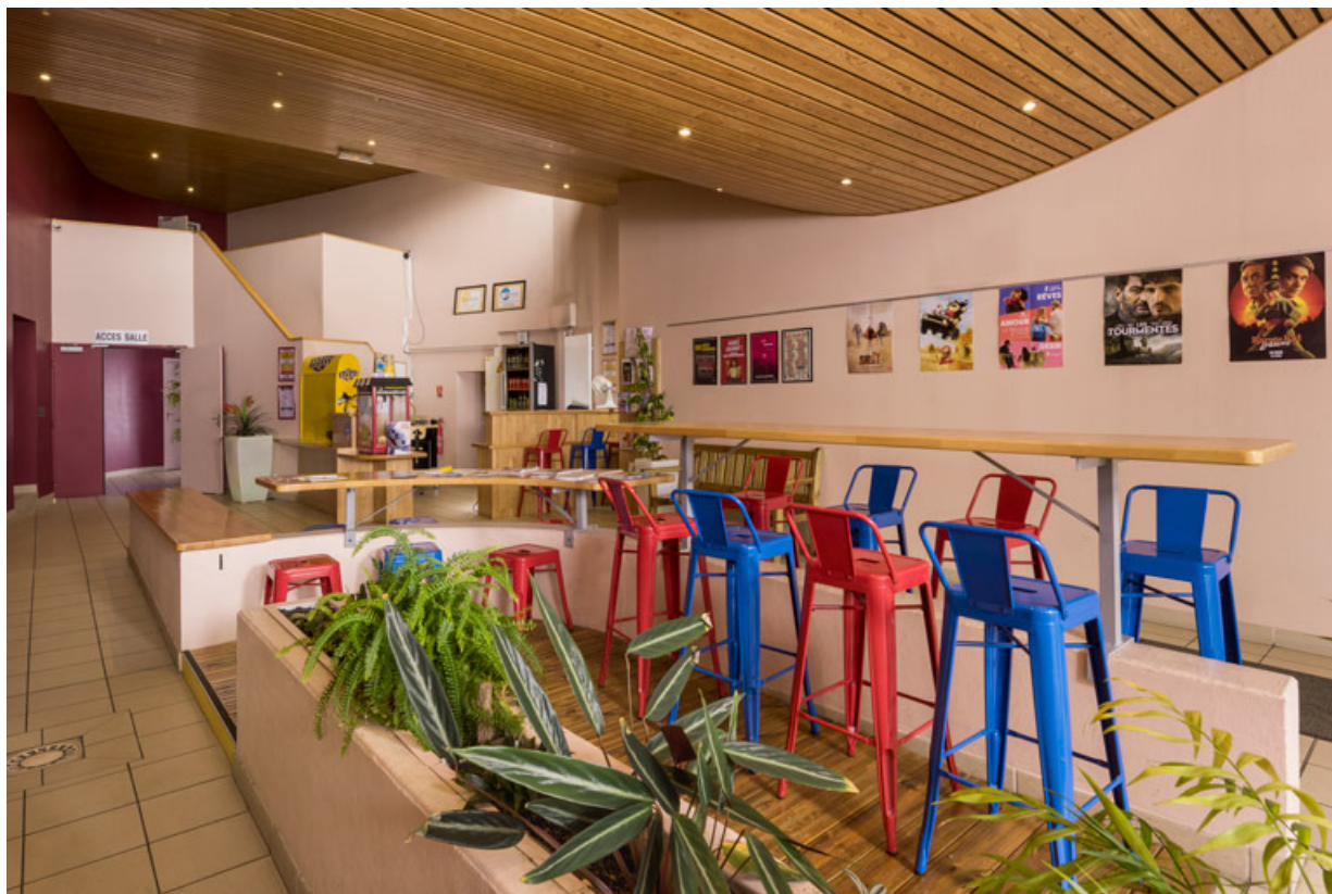
Vestibule (accueil actuel), depuis l'entrée. 71, Gueugnon, 10 rue Danton