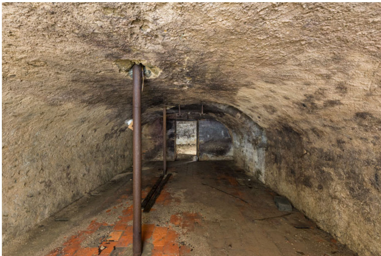
Cave voûtée sous la salle.