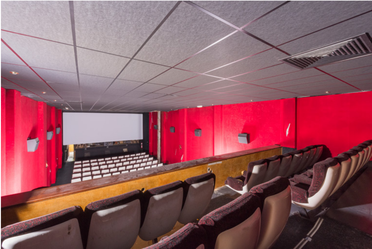
Salle 1, vue vers l'écran depuis le balcon. 71, Louhans, 13 rue des Dodanes