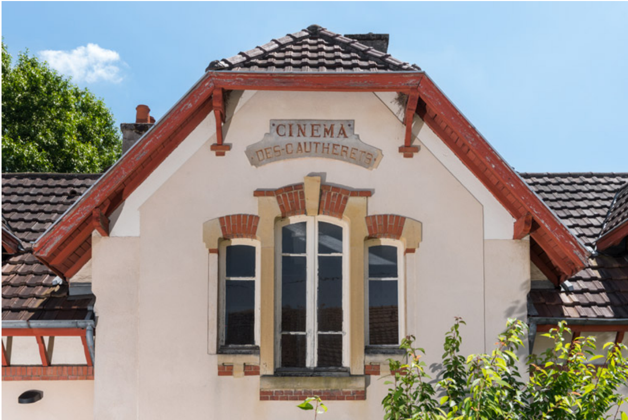
Façade antérieure : mur pignon, avec inscription. 71, Saint-Vallier rue Corneille, lieudit : les Gautherets