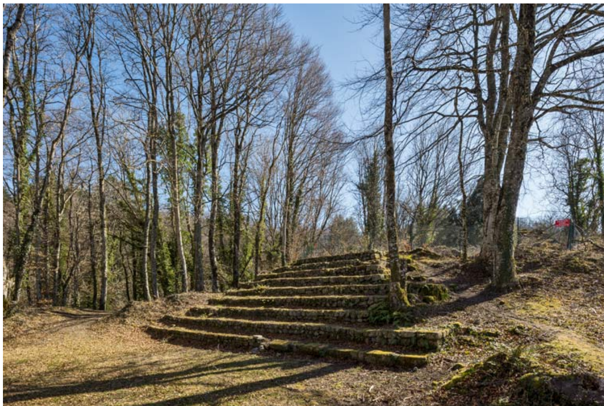
Les gradins, depuis la scène, de trois quarts droite.