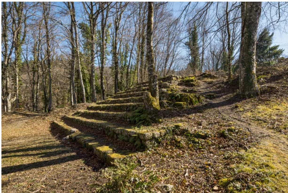
Les gradins, de trois quarts droite.