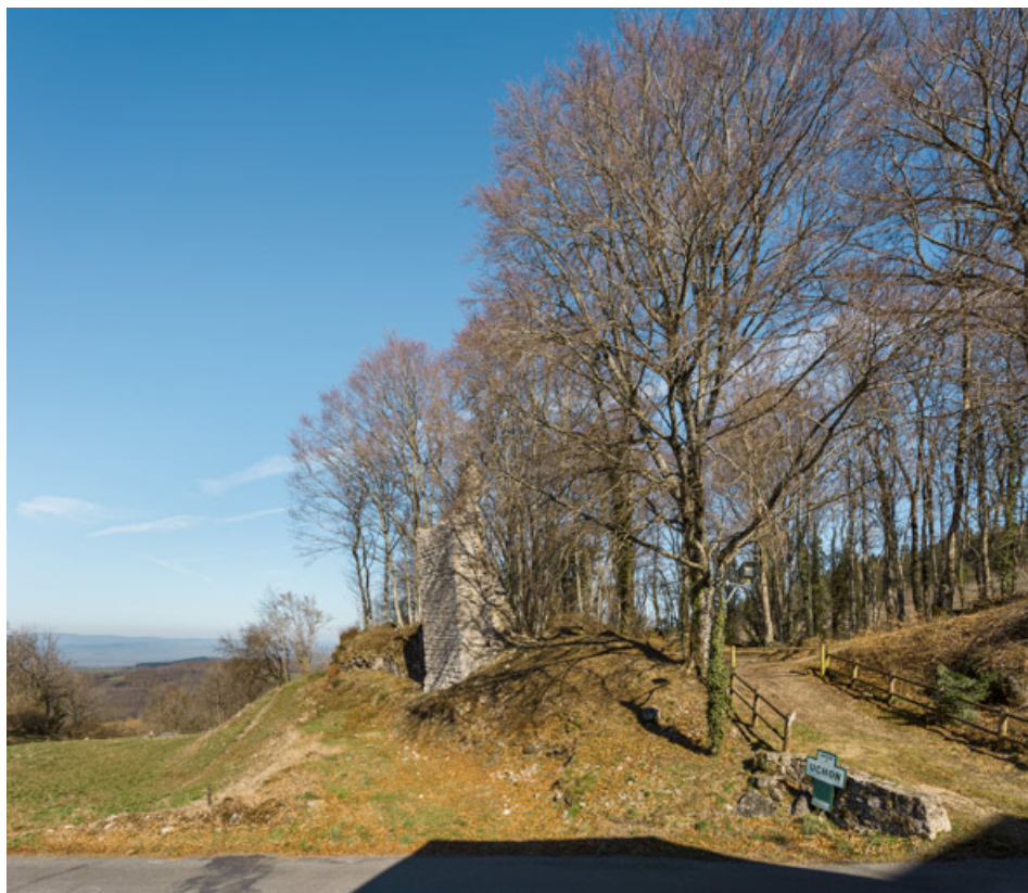
Vue d'ensemble du site, depuis le sud.