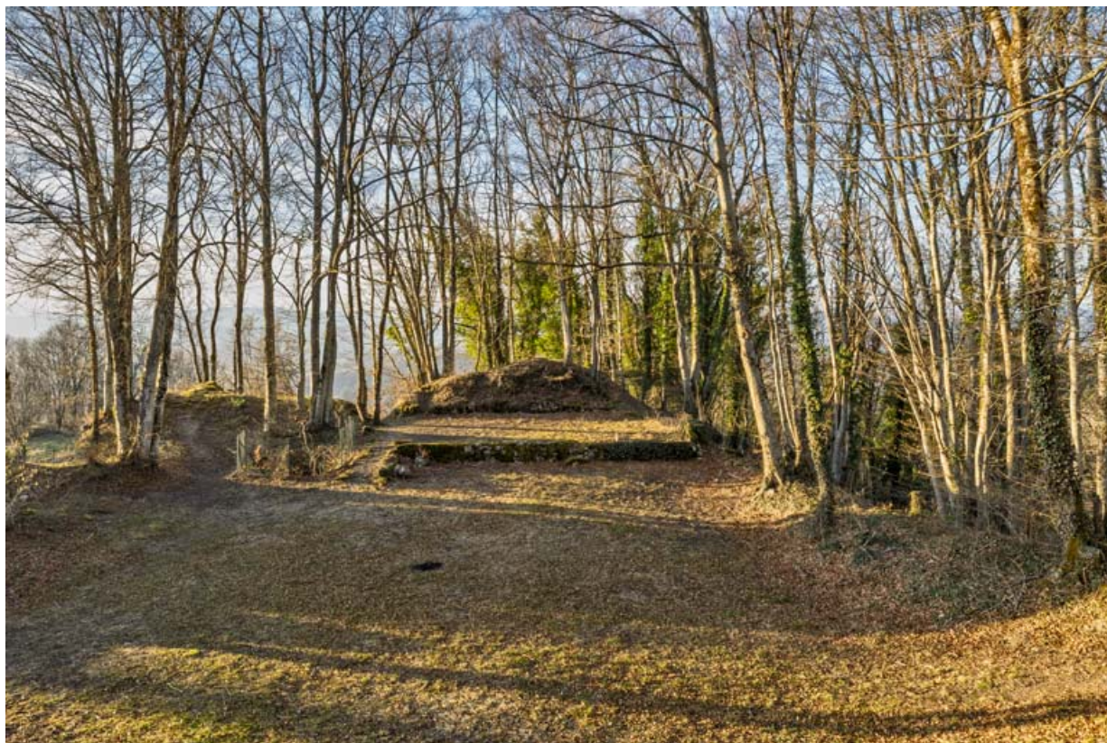
La scène, depuis les gradins.