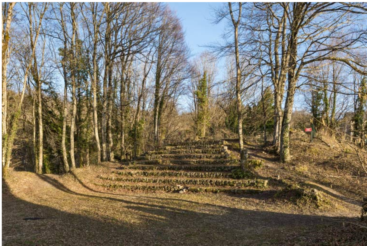
Les gradins, depuis la scène.