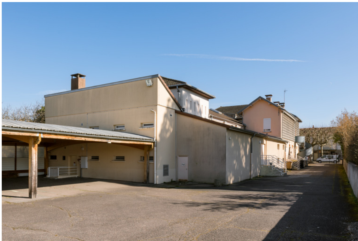
Vue d'ensemble, depuis les garages au sud-ouest.

71, Montchanin, 102 avenue de la République