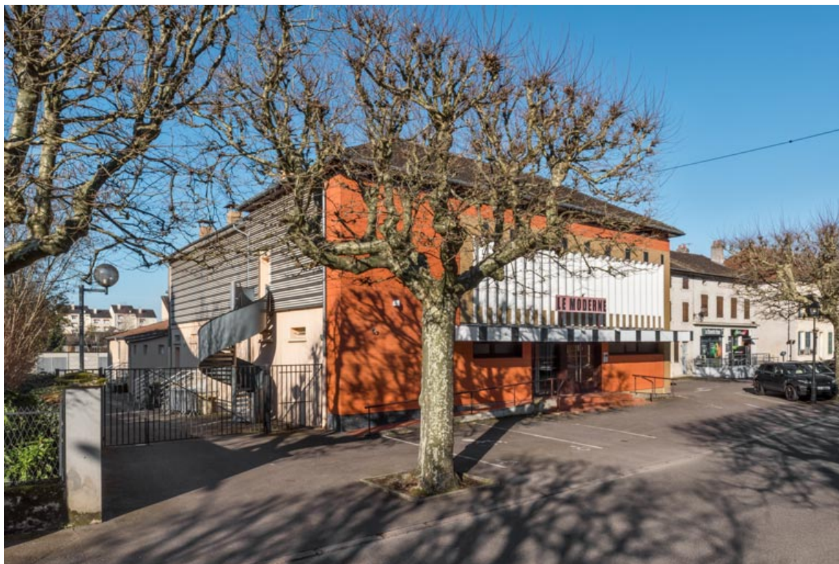
Vue d'ensemble, depuis l'avenue au sud-est. 71, Montchanin, 102 avenue de la République