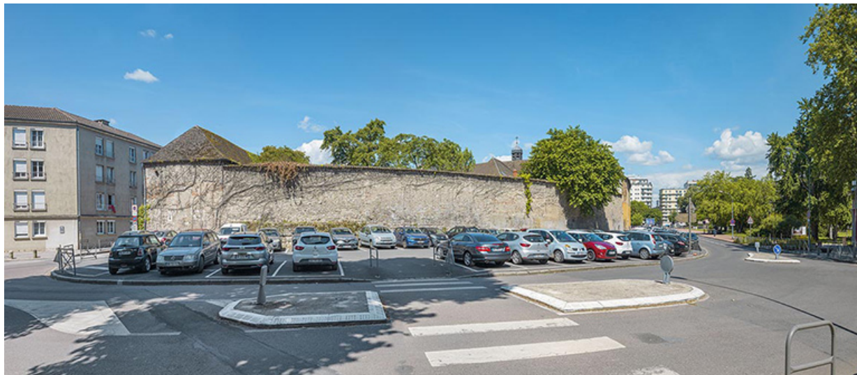
Vue prise depuis la promenade Sainte-Marie.