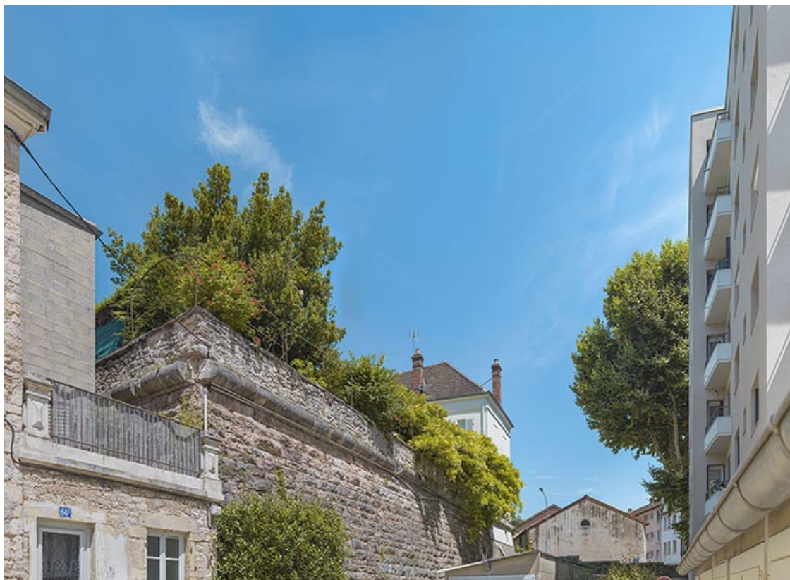
Angle sud de la face et du flanc au niveau du parapet.

71, Chalon-sur-Saône rue Philibert Guide