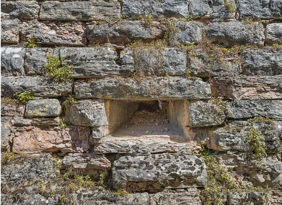
Ouverture de tir au flanc du bastion (galerie de contrescarpe).

71, Chalon-sur-Saône rue Philibert Guide