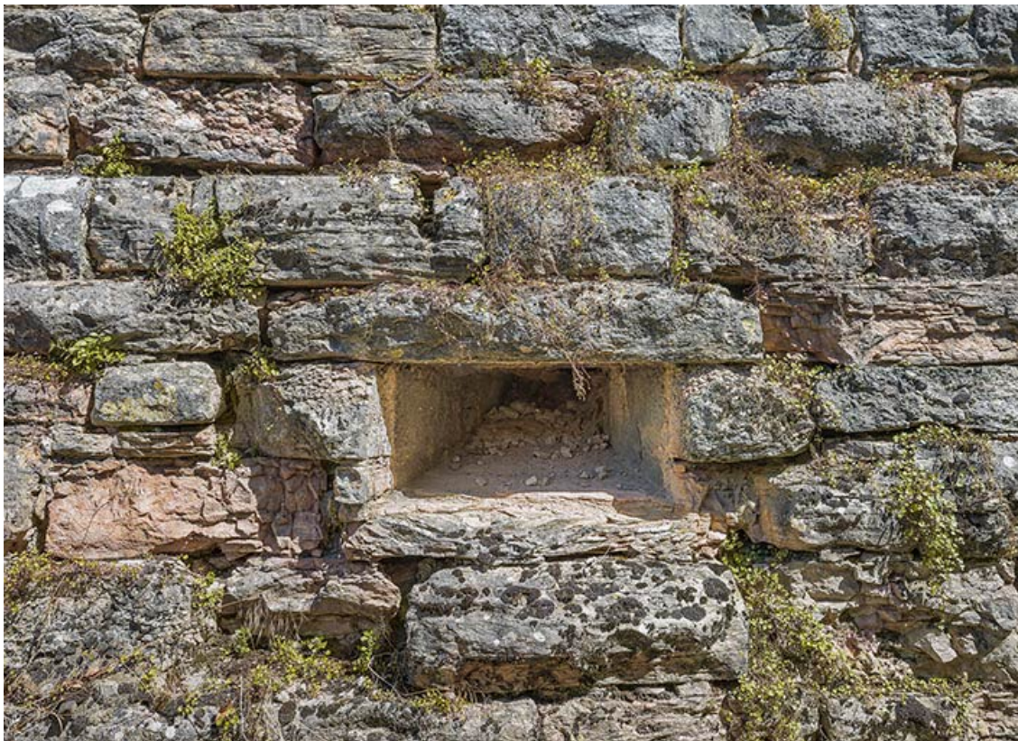
Ouverture de tir au flanc du bastion (galerie de contrescarpe).

71, Chalon-sur-Saône rue Philibert Guide