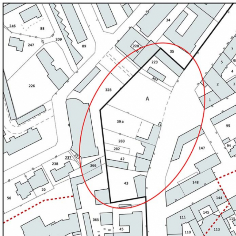
Plan-masse et de situation. Extrait du plan cadastral, 2025, 1/1 000.

71, Chalon-sur-Saône rue Philibert Guide