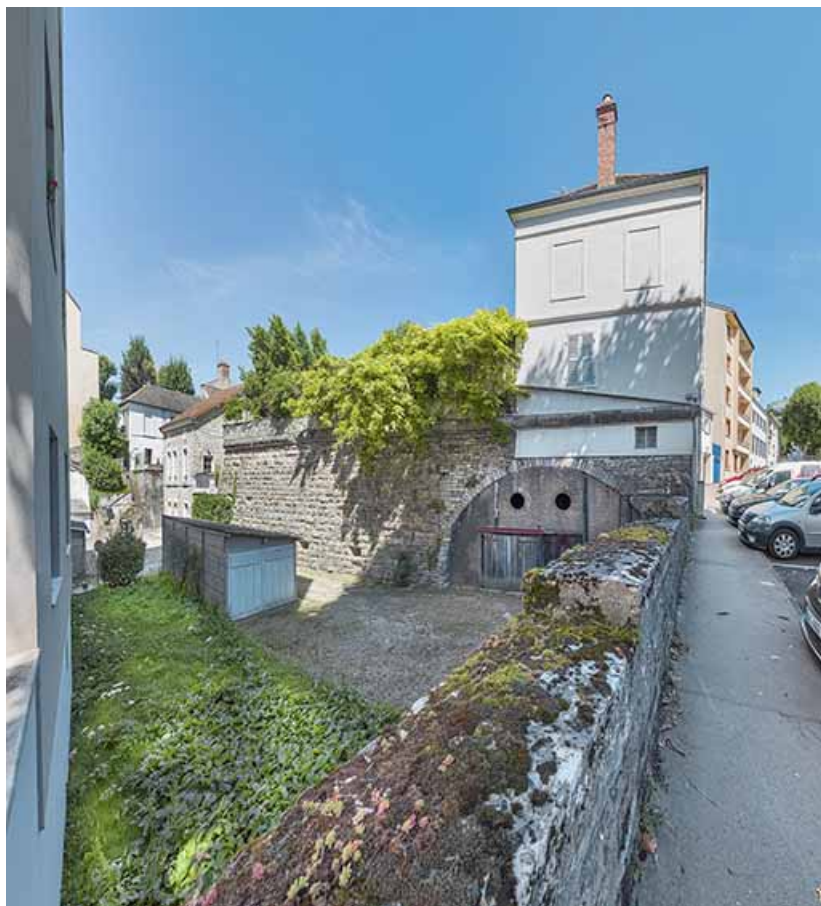
Flanc sud du bastion Saint-Paul.

71, Chalon-sur-Saône rue Philibert Guide