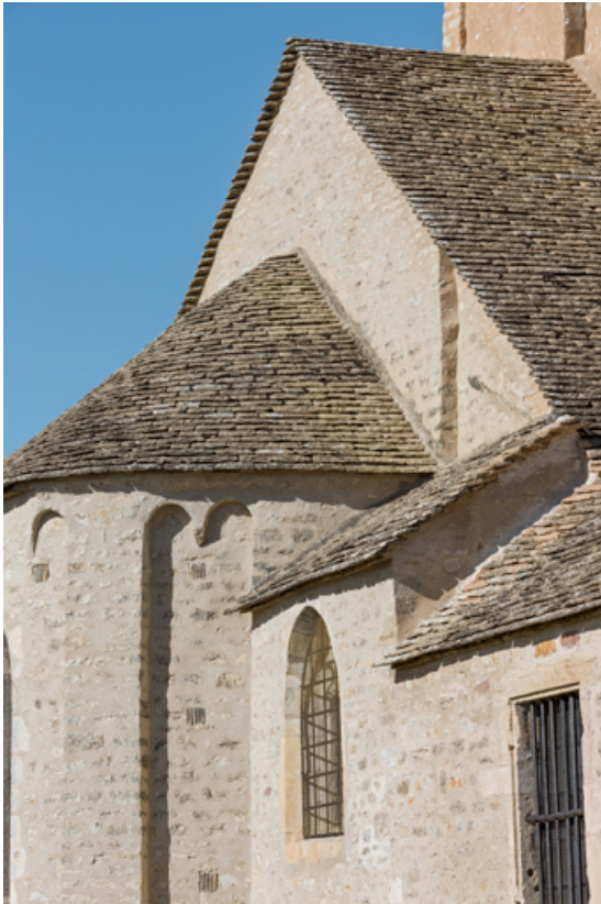
Couverture du chevet, détail.

71, Laives, lieudit : Montagne de Saint-Martin