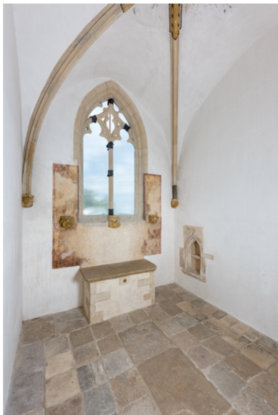
Chapelle de Jehan Geliot, vue intérieure en direction de l'autel.

71, Laives, lieudit : Montagne de Saint-Martin