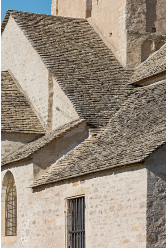
Couverture du chevet, détail.

71, Laives, lieudit : Montagne de Saint-Martin