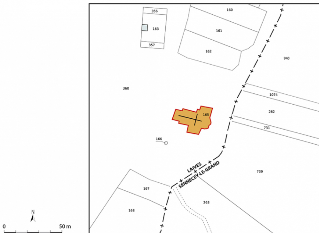
Plan-masse et de situation. Extrait du plan cadastral, 2024. Laives, section C. Échelle 1/1000.

71, Laives, lieudit : Montagne de Saint-Martin