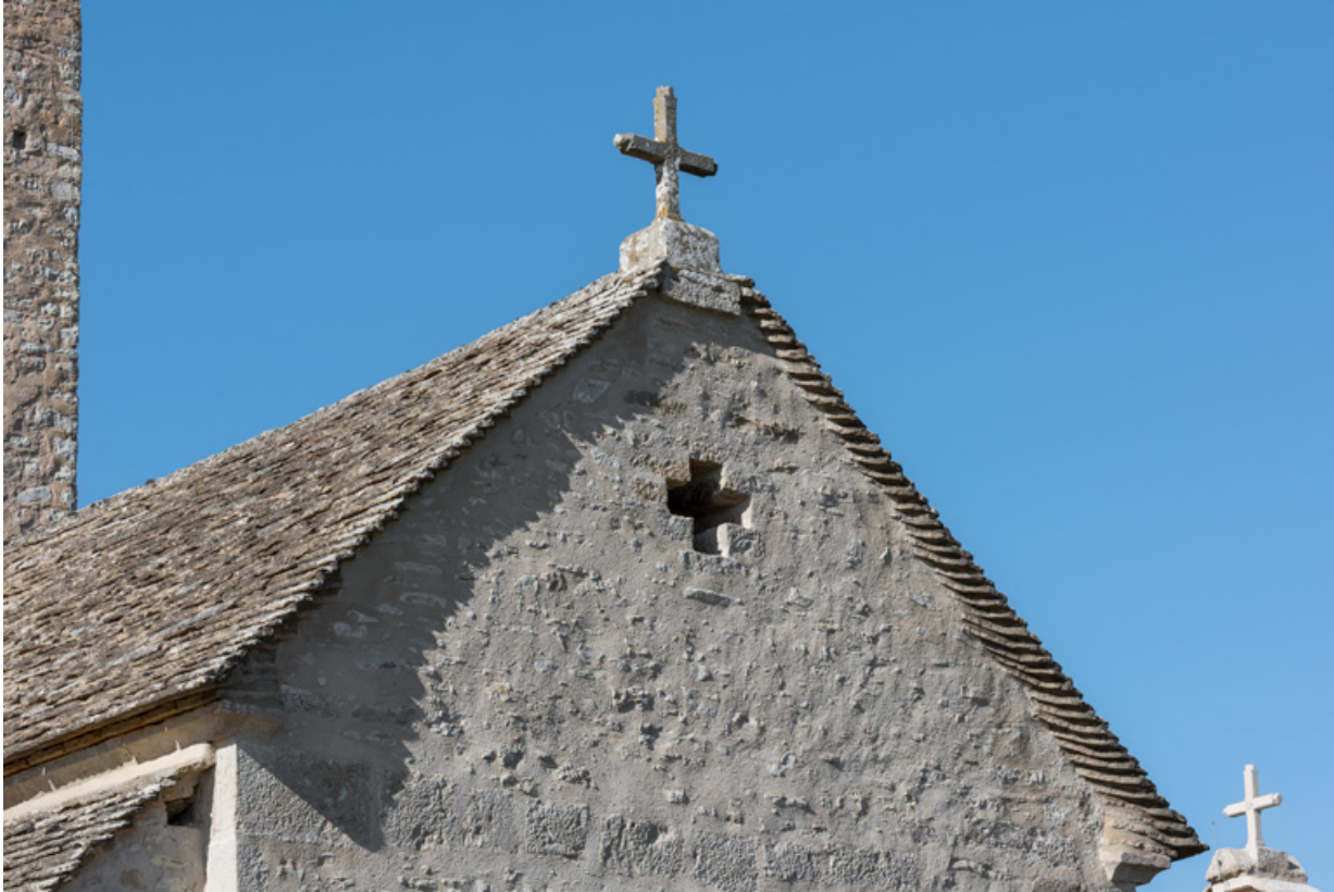
Pignon couvert de la façade.

71, Laives, lieudit : Montagne de Saint-Martin