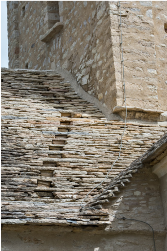
Marches sur le toit de la nef.

71, Laives, lieudit : Montagne de Saint-Martin