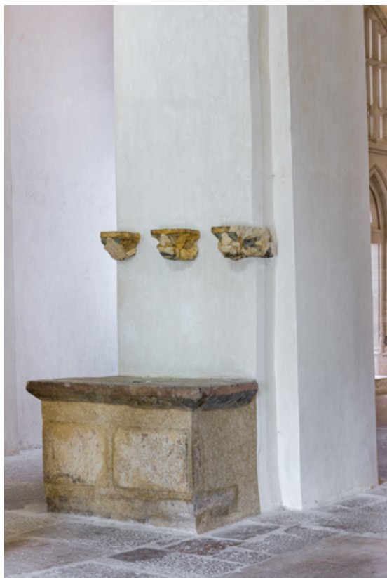
Autel du deuxième pilier nord de la nef.

71, Laives, lieu-dit : Montagne de Saint-Martin