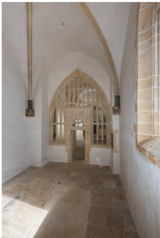
Vue intérieure de chapelle vers le nord.

71, Laives, lieudit : Montagne de Saint-Martin