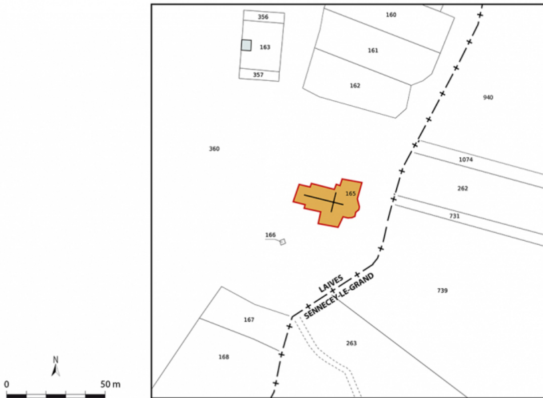
Plan-masse et de situation. Extrait du plan cadastral, 2024. Laives, section C. Échelle 1/1000.

71, Laives, lieudit : Montagne de Saint-Martin