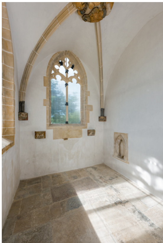
Vue intérieure de chapelle vers le sud.

71, Laives, lieudit : Montagne de Saint-Martin