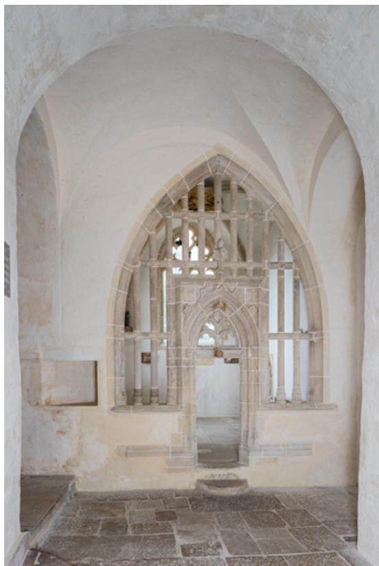
Chapelle de Jehan de La Grange, clôture vue depuis l'extérieur de la chapelle. 71, Laives, lieudit : Montagne de Saint-Martin