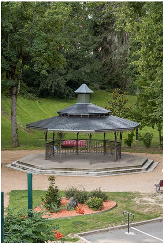
Vue actuelle de l'abri dans le parc thermal.