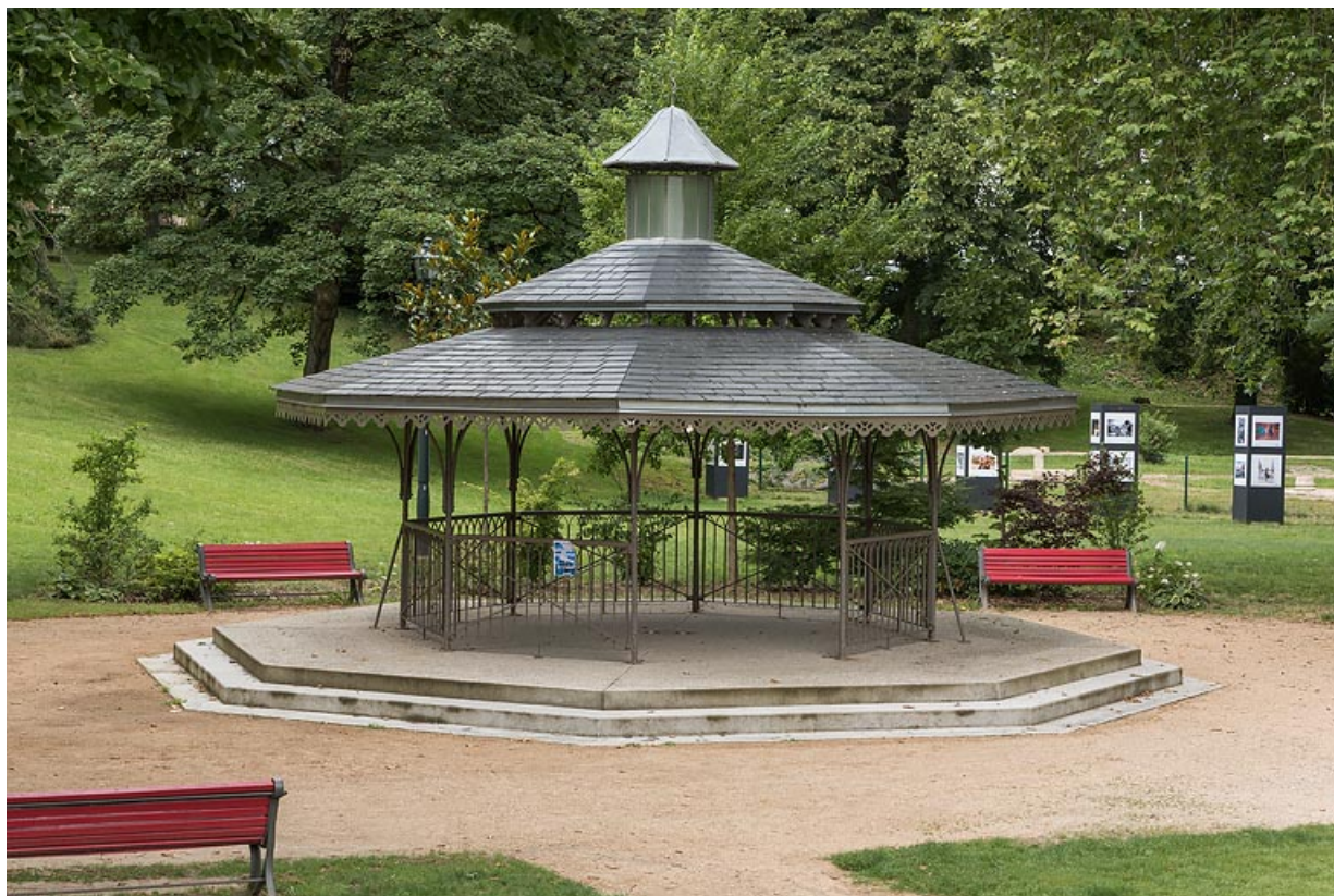
Vue actuelle de l'abri dans le parc thermal.