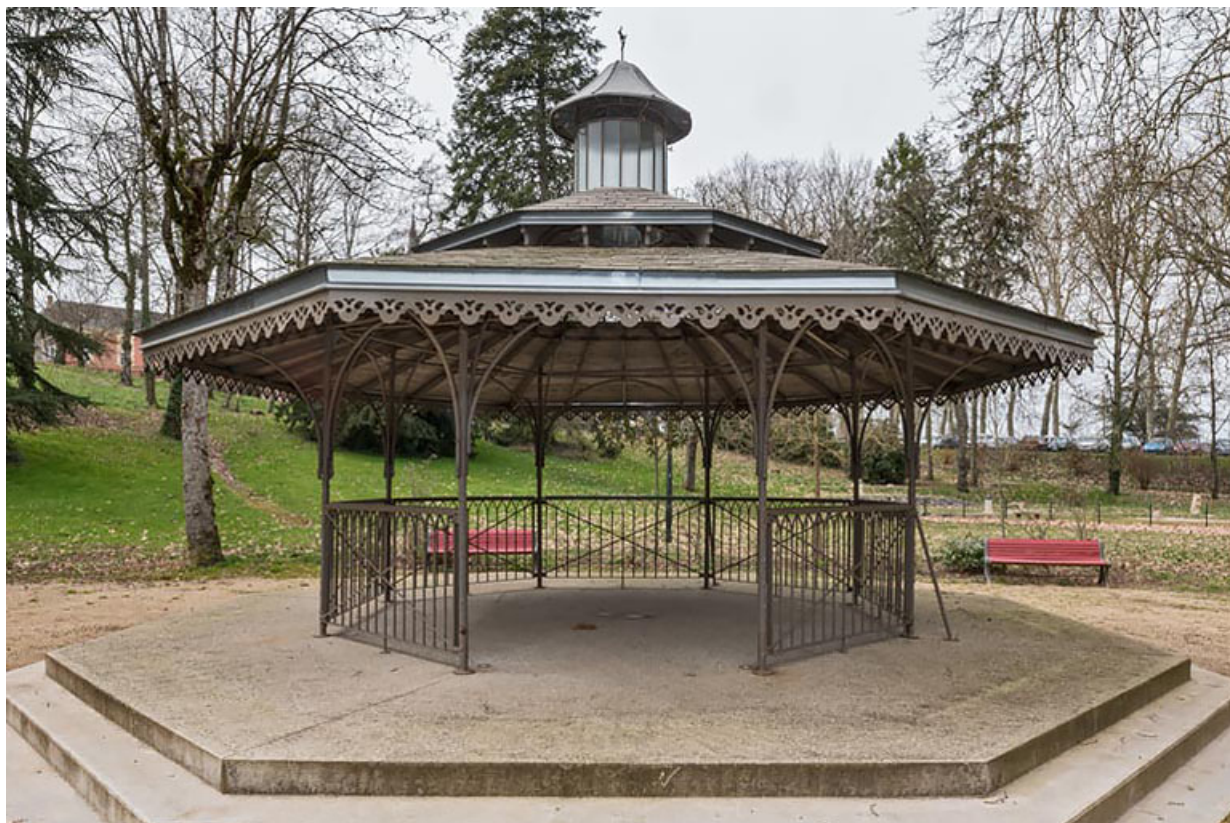
Vue actuelle de l'abri dans le parc thermal.