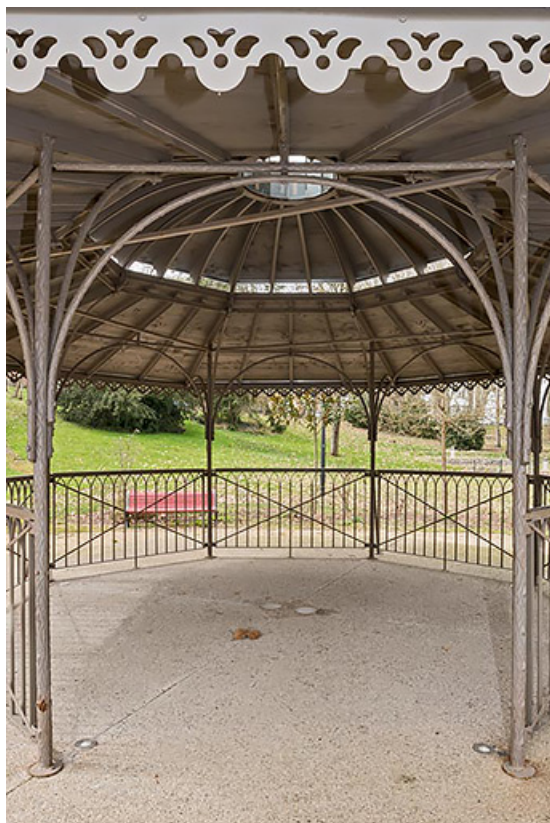
Vue actuelle de l'abri dans le parc thermal.