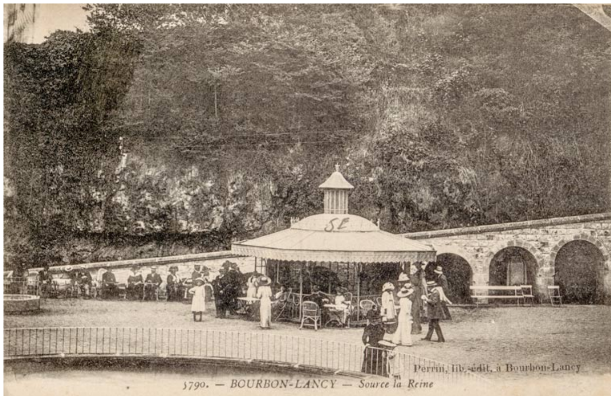
Vue ancienne de l'abri dans la cour des thermes.