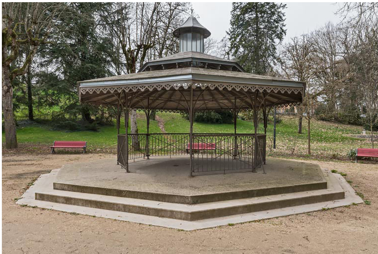
Vue actuelle de l'abri dans le parc thermal.