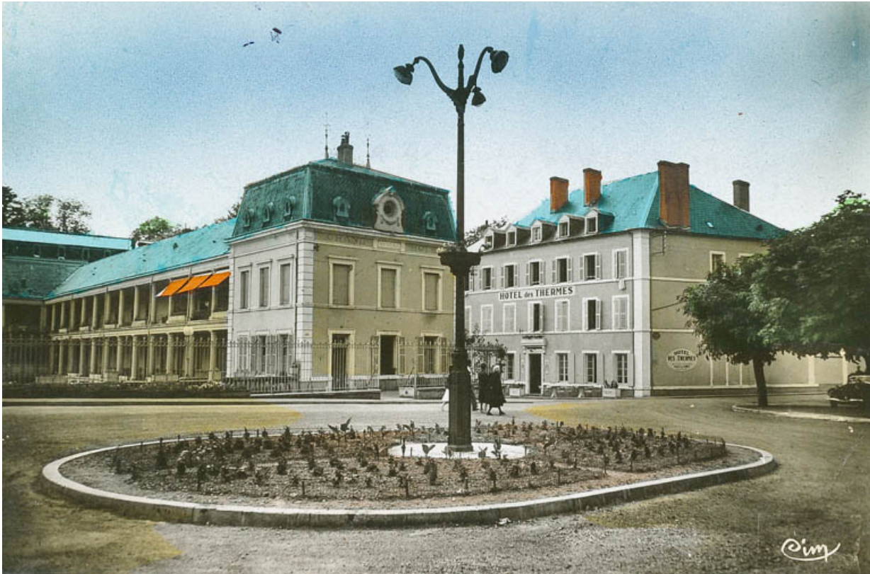
Situation de l'hôtel des Thermes (à droite), près de l'établissement thermal (à gauche).