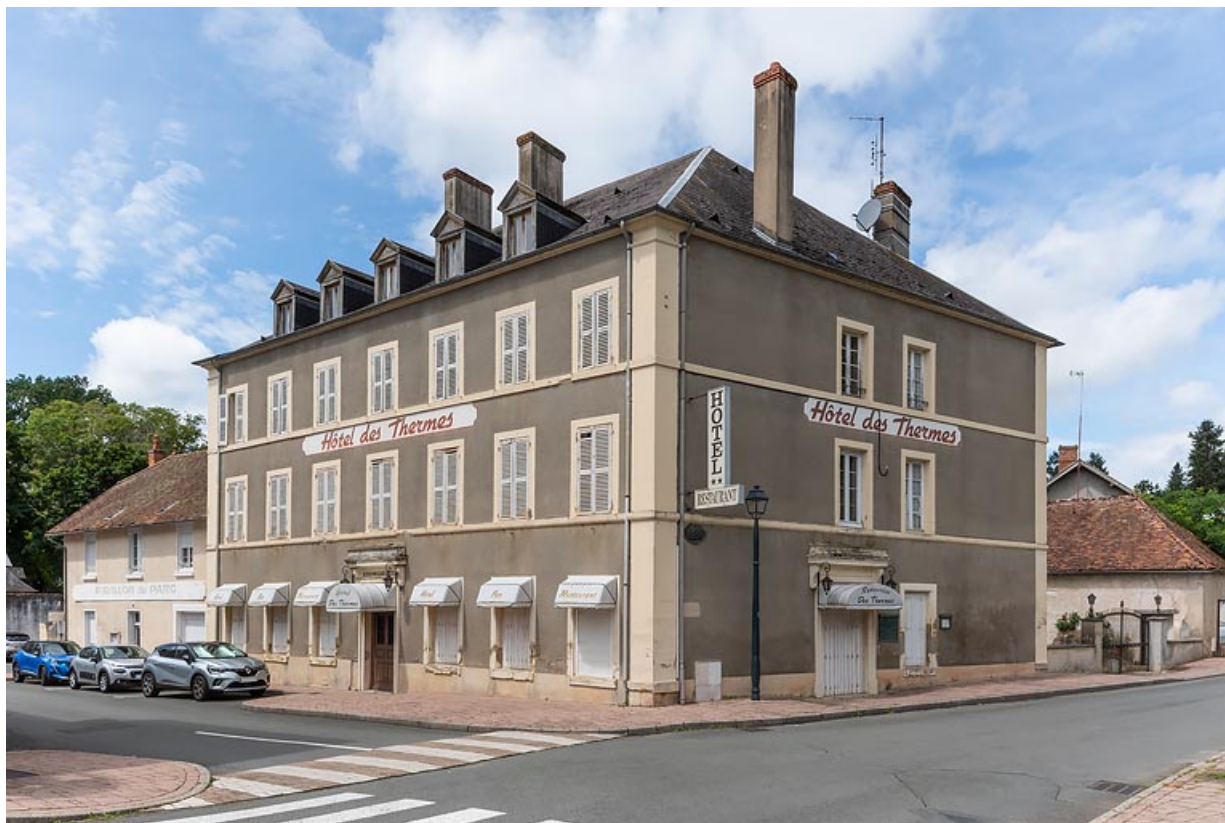
Façade sud et façade est.