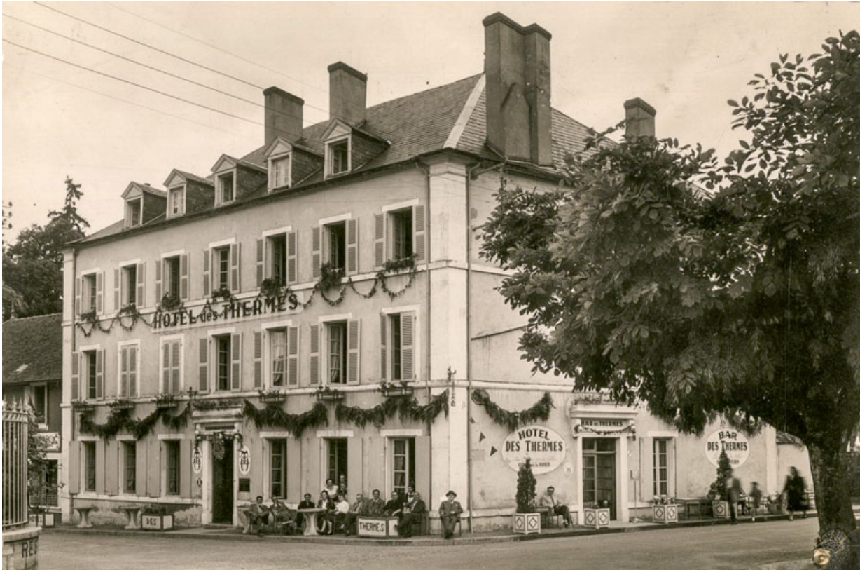
Vue ancienne (milieu du 20e siècle).