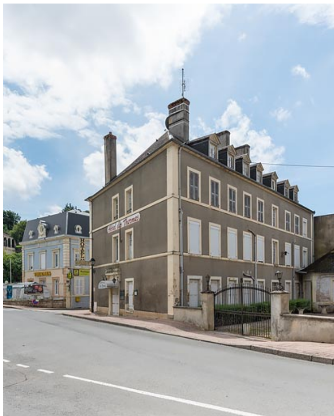
Façade est et façade nord.