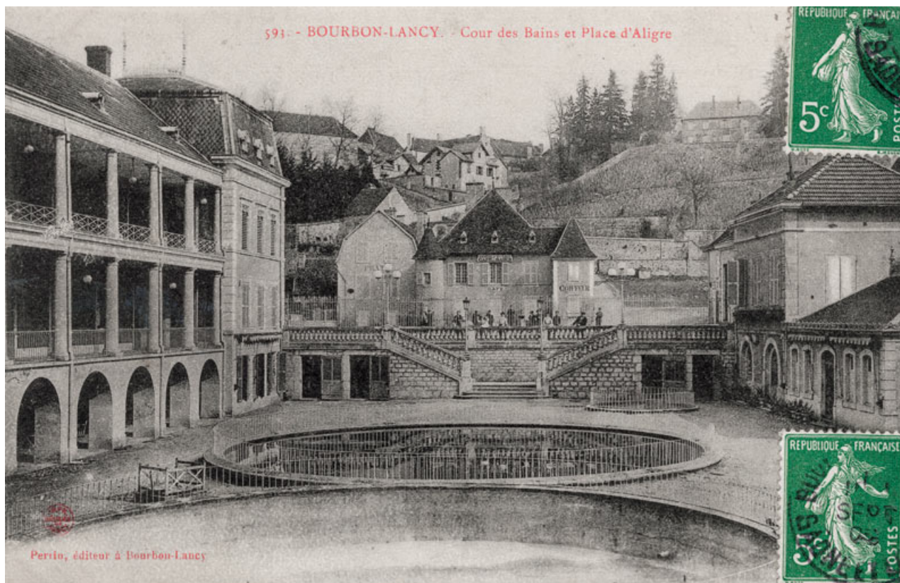
Vue ancienne, depuis la cour de l'établissement thermal.