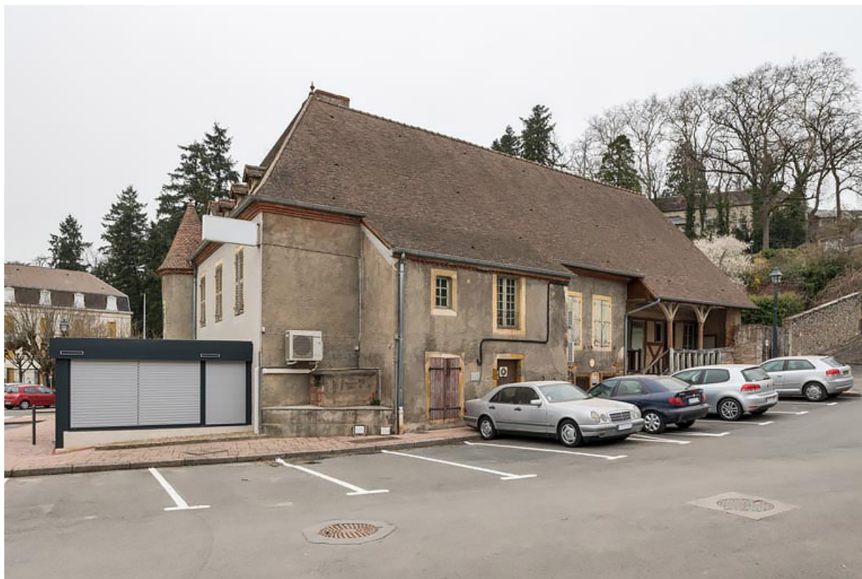
Vue actuelle depuis le sud.