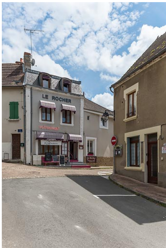
Façade de la maison sur la place du Tourniquet.