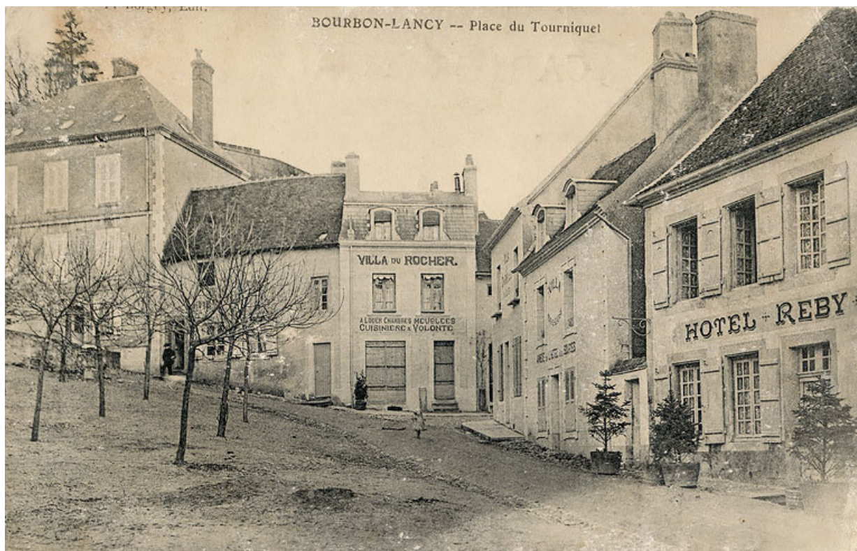
Façade de la maison sur la place du Tourniquet.