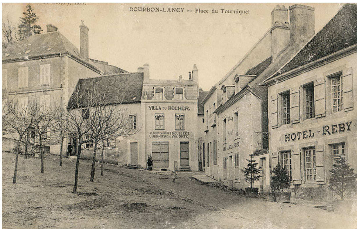
Façade de la maison sur la place du Tourniquet.