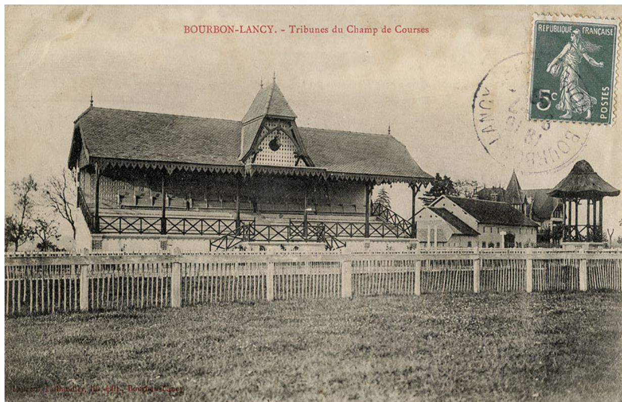
Vue de la tribune du public au début du 20 e siècle.

71, Bourbon-Lancy, lieudit : Le Grand Sornat