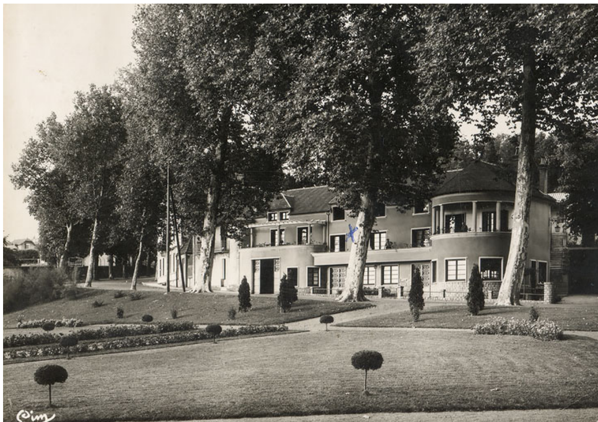
Vue, troisième quart du 20e siècle.

71, Bourbon-Lancy, 7 avenue de la Libération