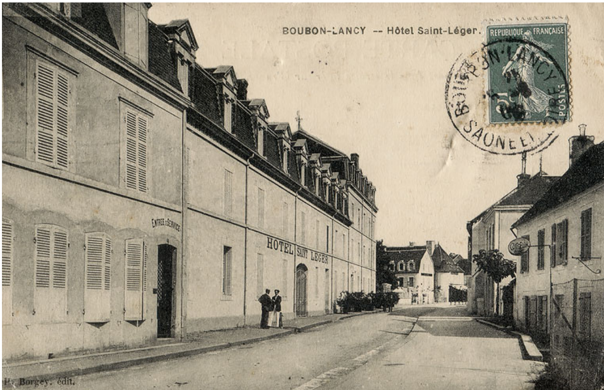
Façade sur l'avenue, vue en direction du sud-est. 71, Bourbon-Lancy, 25-27 avenue de la Libération