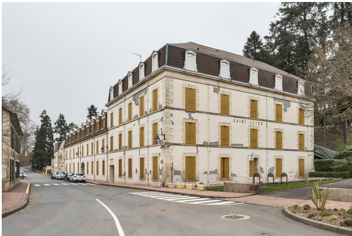
Façade sur l'avenue, vue en direction du nord-ouest.

71, Bourbon-Lancy, 25-27 avenue de la Libération