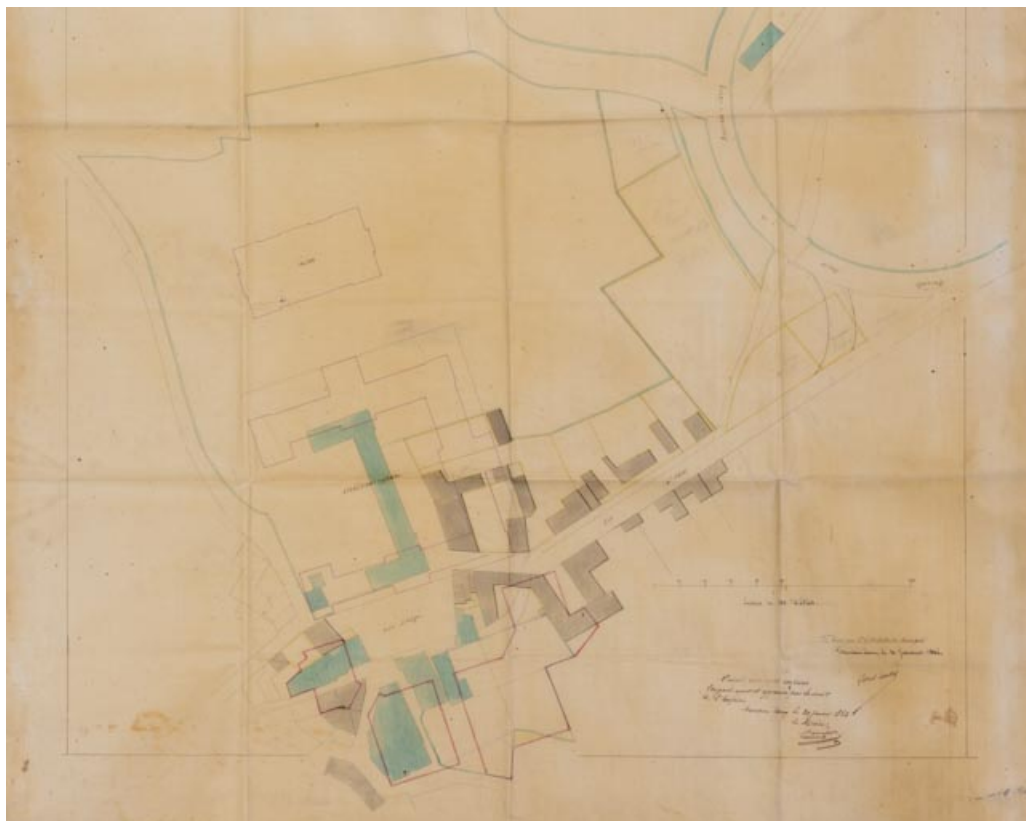
Plan des parcelles à acquérir pour la mise en œuvre du projet de Lambert (30 janvier 1852).