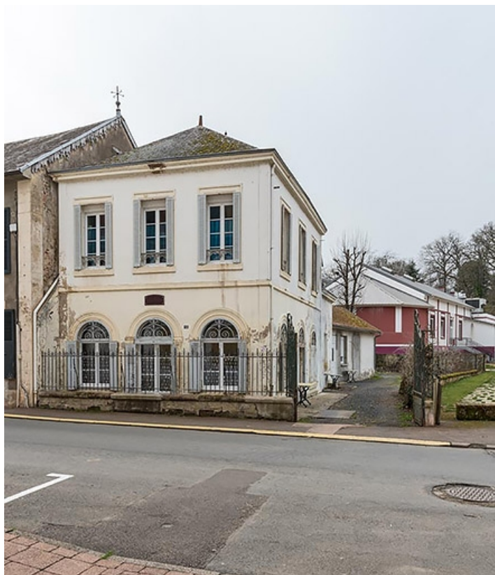
Demeure 12 avenue de la Libération dite Villa des Fleurs. 71, Bourbon-Lancy