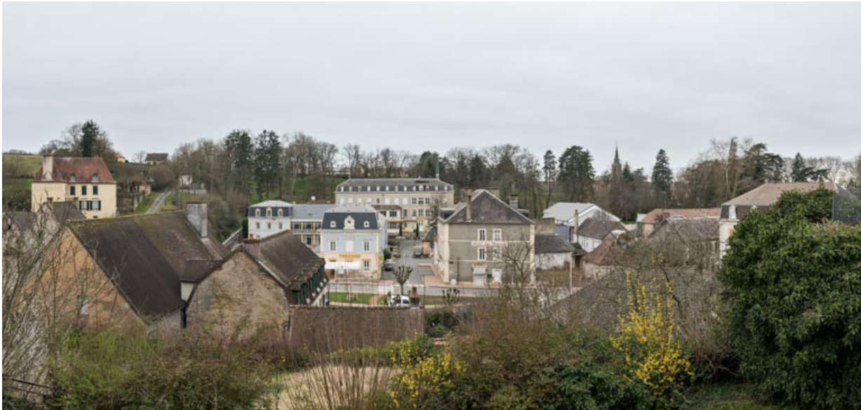
Vue actuelle du quartier thermal.