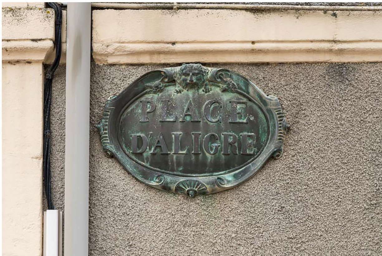
Plaque ("PLACE D'ALIGRE").