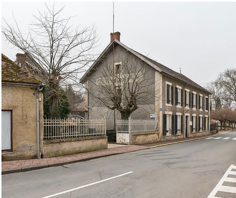
Hôtel La Roseraie. 71, Bourbon-Lancy