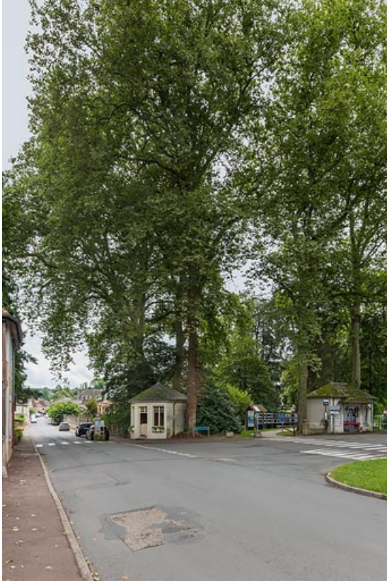
Entrée du parc, carrefour de l'avenue de la Libération et de l'allée d'Aligre.