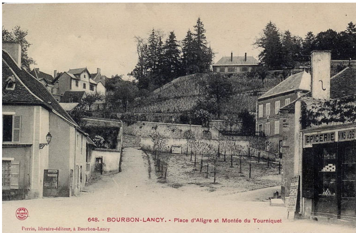
Vue ancienne de la place d'Aligre.