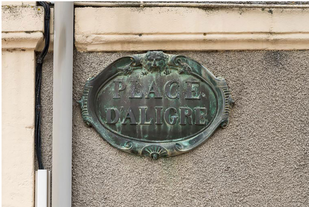
Plaque ("PLACE D'ALIGRE").