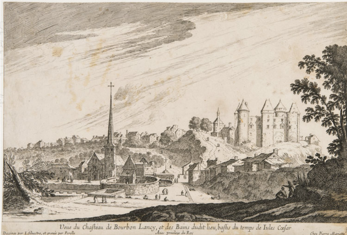
Vue des bains au 17e siècle, gravure de Nicolas Perelle d'après Israël Silvestre.