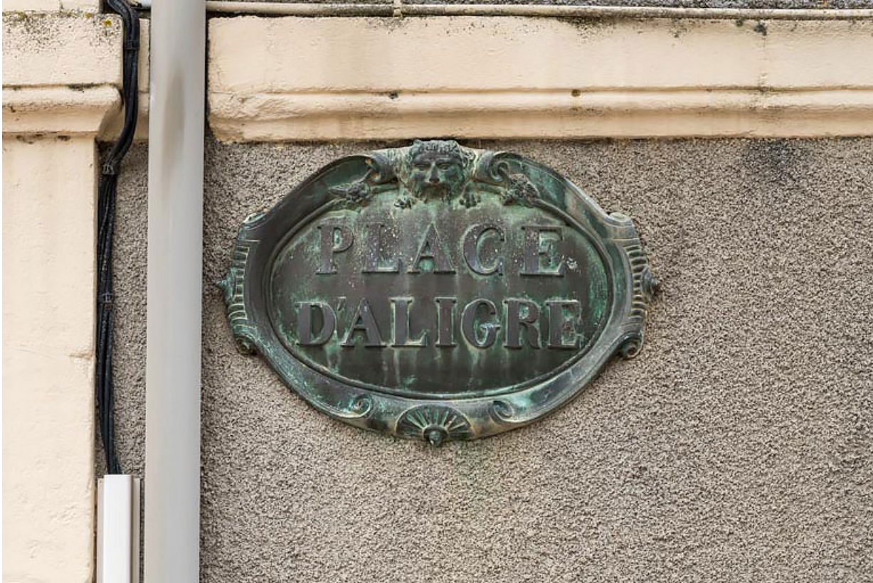
Plaque ("PLACE D'ALIGRE").