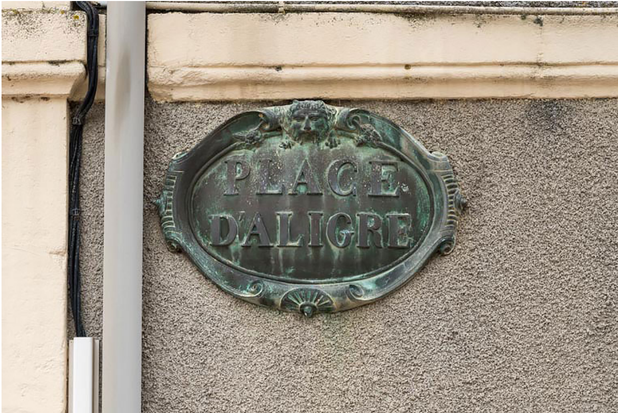
Plaque ("PLACE D'ALIGRE").