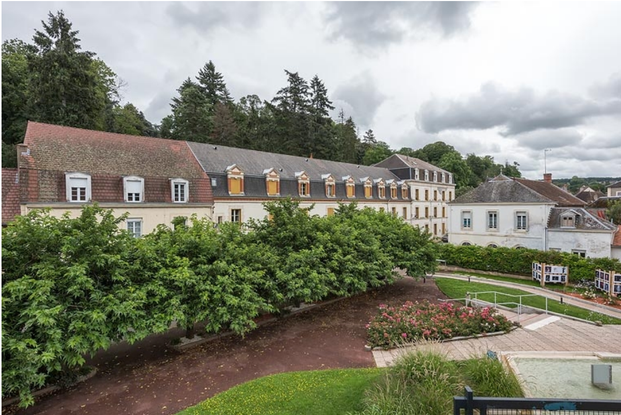
Toits brisés du bâtiment des services (en bitume) et de l'hôtel (en ardoise).