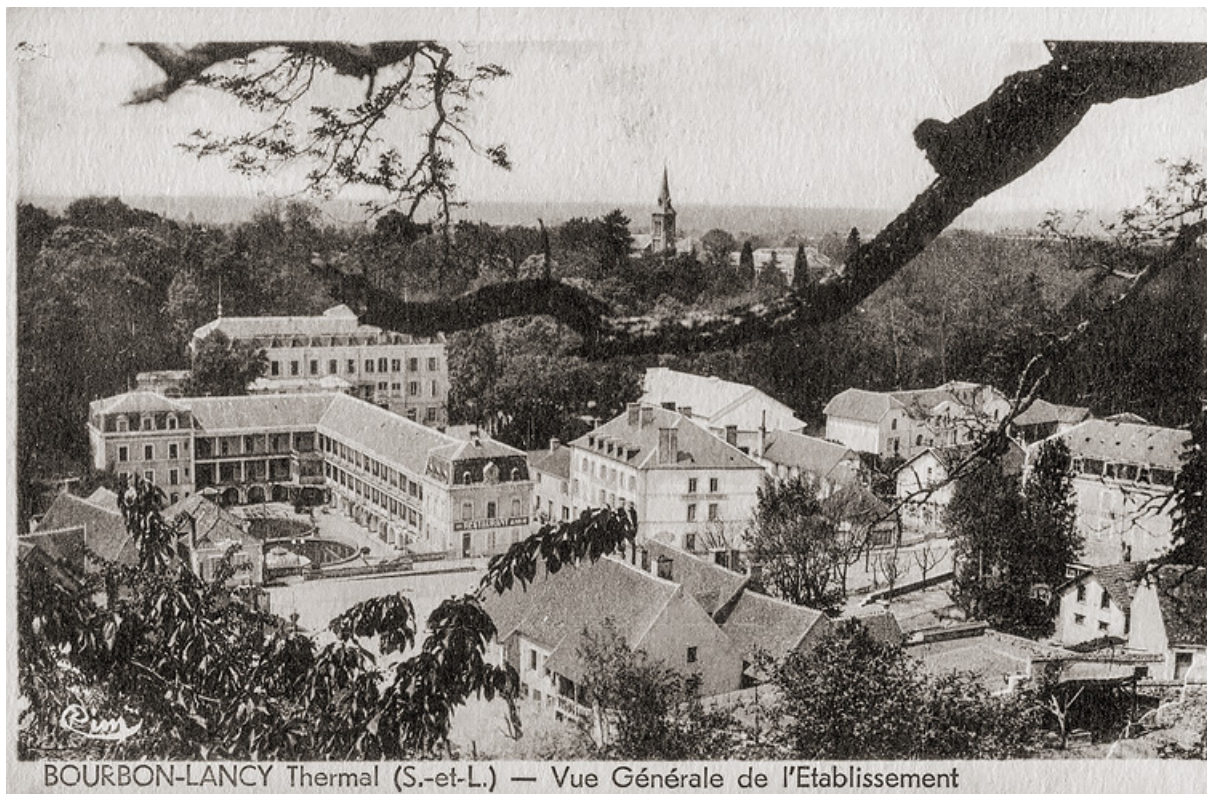
Vue ancienne du quartier thermal.