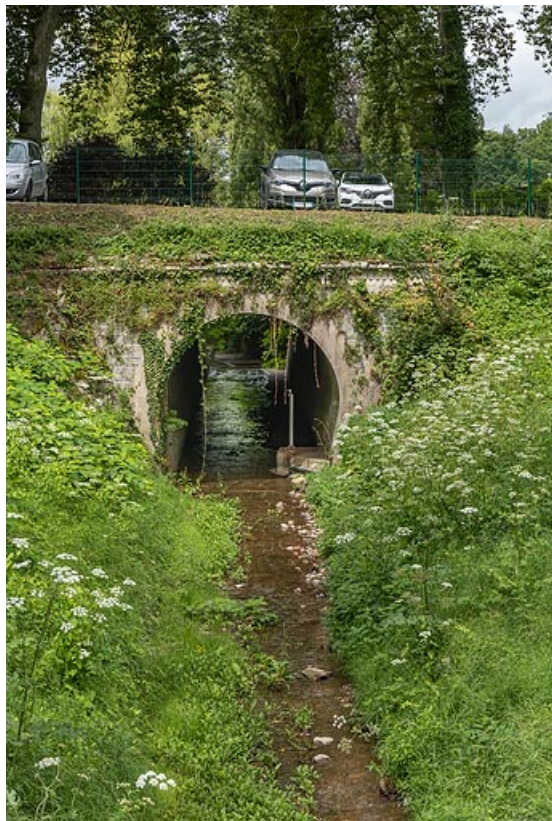
Tunnel du Borne sous l'allée d'Aligre.