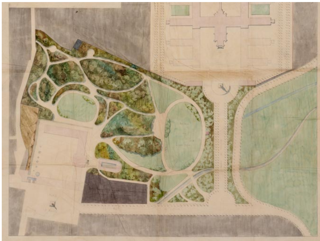
Projet d'aménagement de Léon Ohnet (1852).