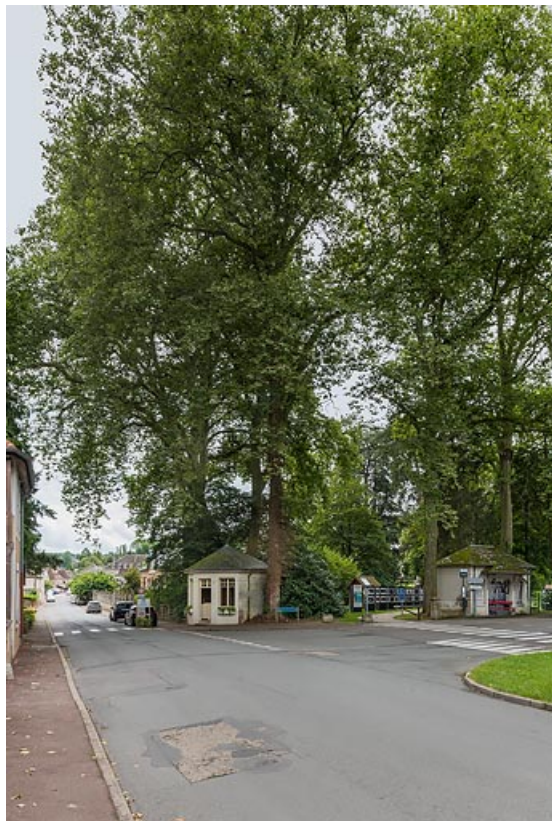
Entrée du parc, carrefour de l'avenue de la Libération et de l'allée d'Aligre. 71, Bourbon-Lancy, 1 Parc thermal