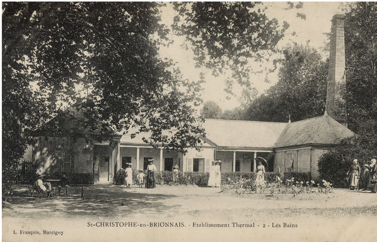
Vue des bains au début du 20e siècle.

71, Saint-Christophe-en-Brionnais route départementale n°174, lieudit : Les Bains