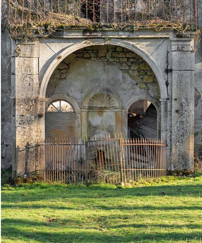
Pavillon de la source, vue rapprochée de face.

71, Saint-Christophe-en-Brionnais route départementale n°174, lieudit : Les Bains