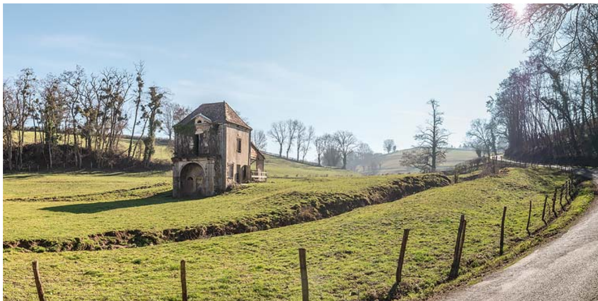
Vue générale du site, prise depuis la route (vue de l'avant du pavillon de la source). 71, Saint-Christophe-en-Brionnais route départementale n°174, lieudit : Les Bains

N° de l'illustration : 20207100784NUC2AQ