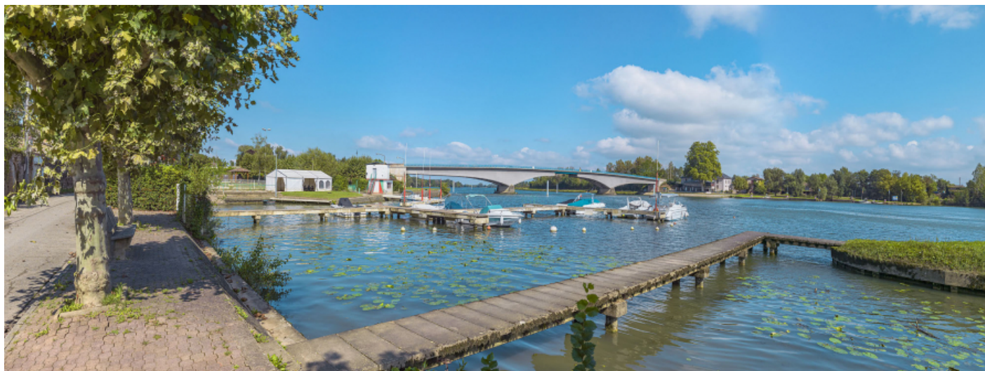
Le port et le pont de Saint-Romain, vus depuis la rive droite.

71, Saint-Symphorien-d'Ancelles route départementale 166, lieudit : Saint-Romain-des-Iles