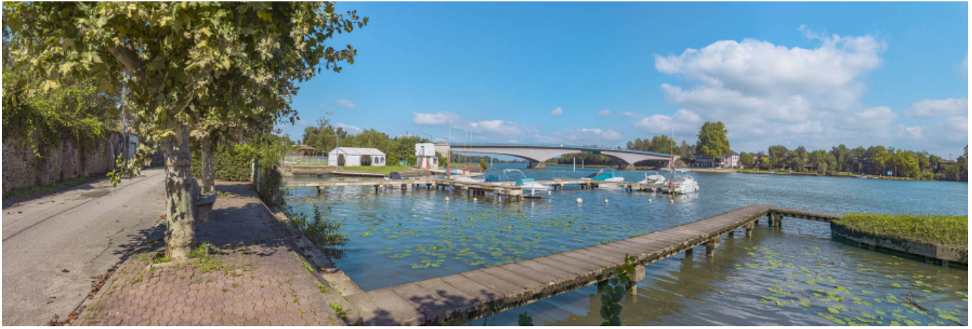
Le port et le pont de Saint-Romain, vus depuis la rive droite.

71, Saint-Symphorien-d'Ancelles route départementale 166, lieu dit : Saint-Romain-des-Iles