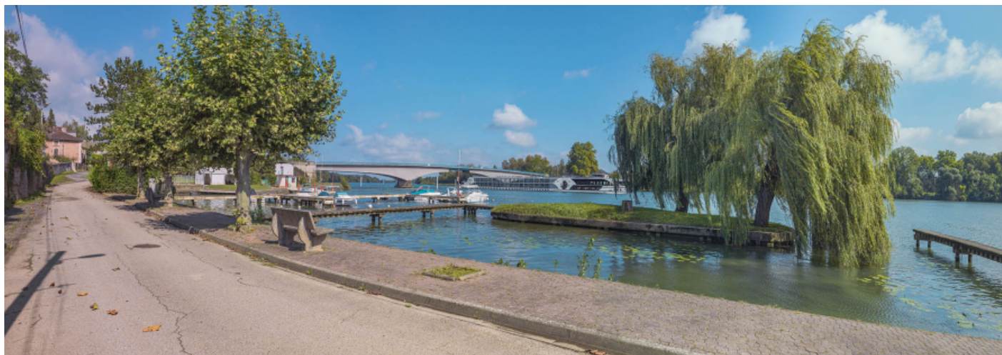
Le port et le pont de Saint-Romain, vus depuis la rive droite.

71, Saint-Symphorien-d'Ancelles route départementale 166, lieudit : Saint-Romain-des-Iles