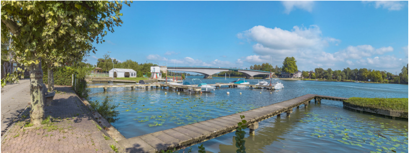
Le port et le pont de Saint-Romain, vus depuis la rive droite.

71, Saint-Symphorien-d'Ancelles route départementale 166, lieudit : Saint-Romain-des-Iles