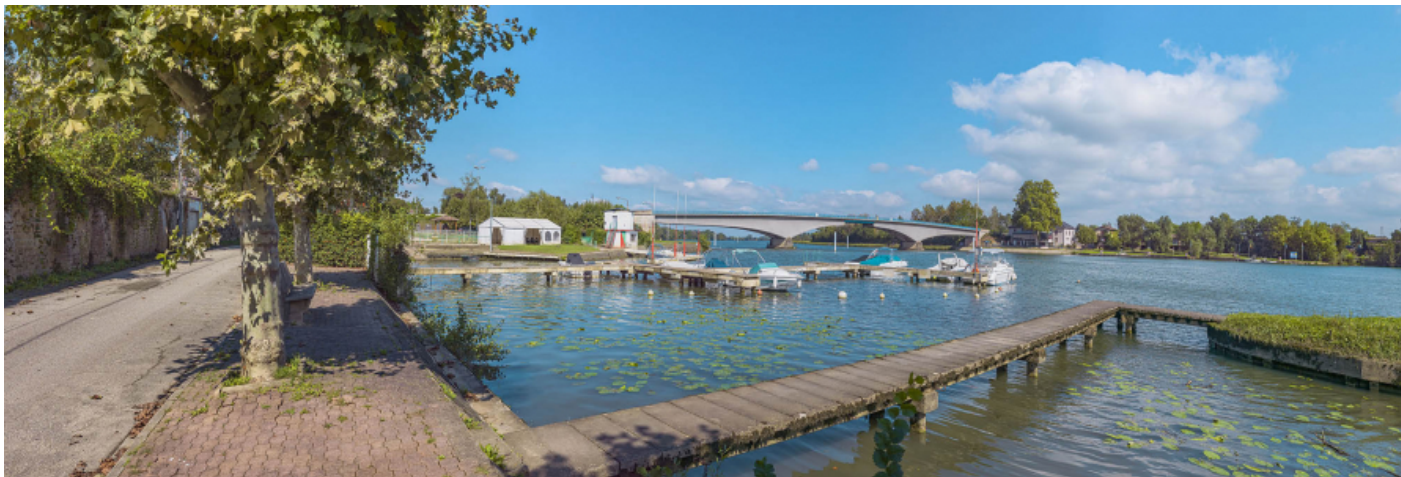
Le port et le pont de Saint-Romain, vus depuis la rive droite.

71, Saint-Symphorien-d'Ancelles route départementale 166, lieudit : Saint-Romain-des-Iles