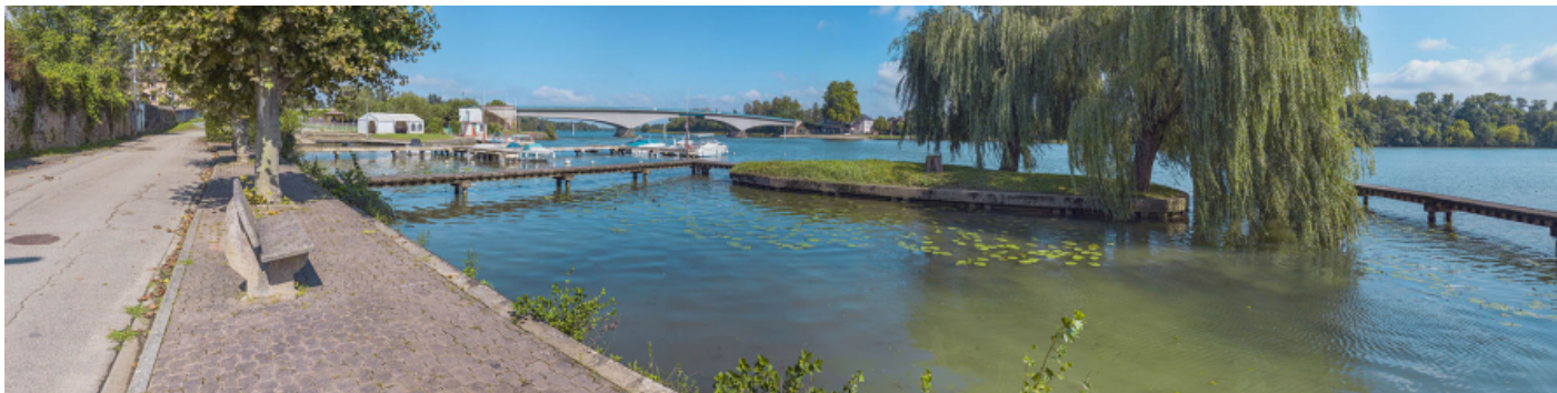
Le port et le pont de Saint-Romain, vus depuis la rive droite.

71, Saint-Symphorien-d'Ancelles route départementale 166, lieudit : Saint-Romain-des-Iles