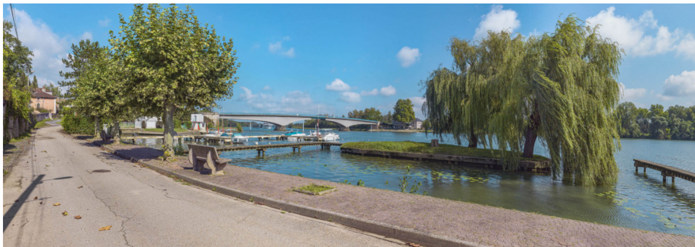
Le port et le pont de Saint-Romain, vus depuis la rive droite.

71, Saint-Symphorien-d'Ancelles route départementale 166, lieudit : Saint-Romain-des-Iles