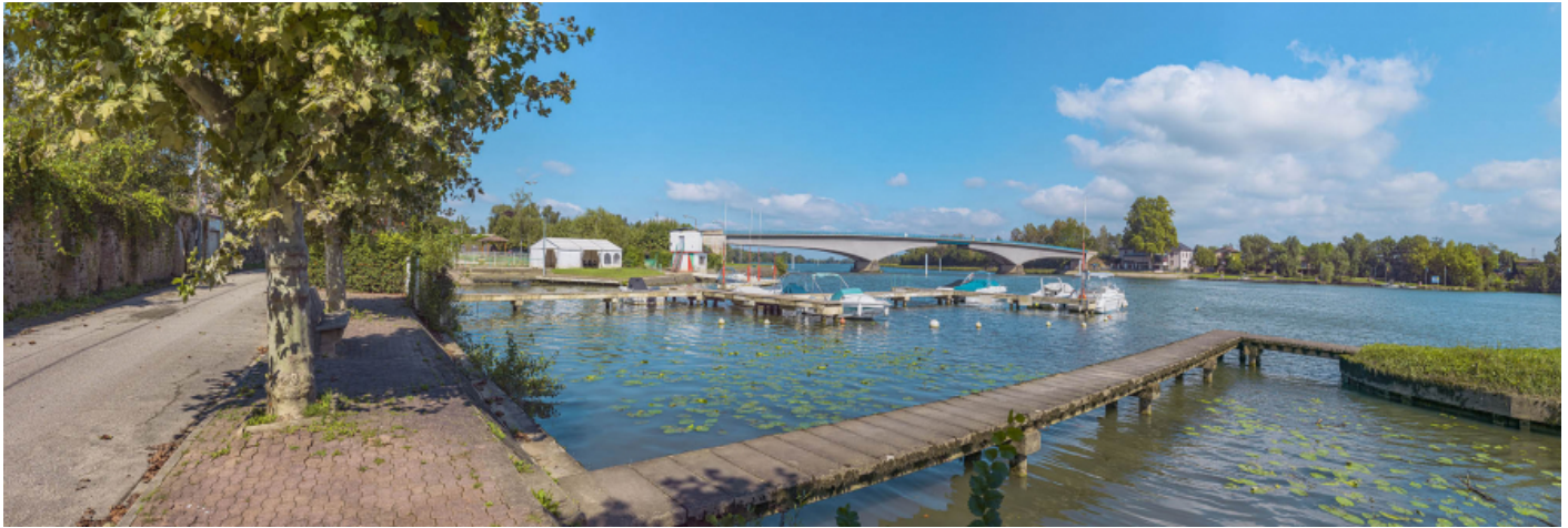
Le port et le pont de Saint-Romain, vus depuis la rive droite.

71, Saint-Symphorien-d'Ancelles route départementale 166, lieudit : Saint-Romain-des-Iles