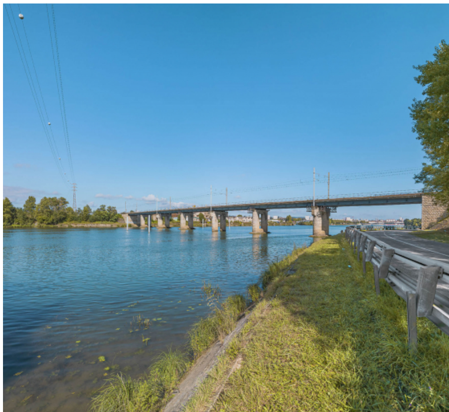
Le pont vu d'aval, rive gauche.