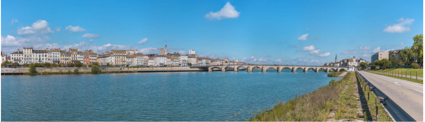
Vue d'ensemble du pont et des quais en aval, depuis la rive gauche.

71, Mâcon route départementale 1079, lieu-dit : PK 80,6