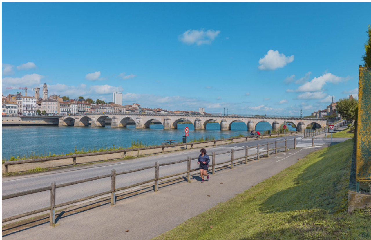
Vue d'ensemble du pont, d'aval et depuis la rive gauche.

71, Mâcon route départementale 1079, lieu-dit : PK 80,6