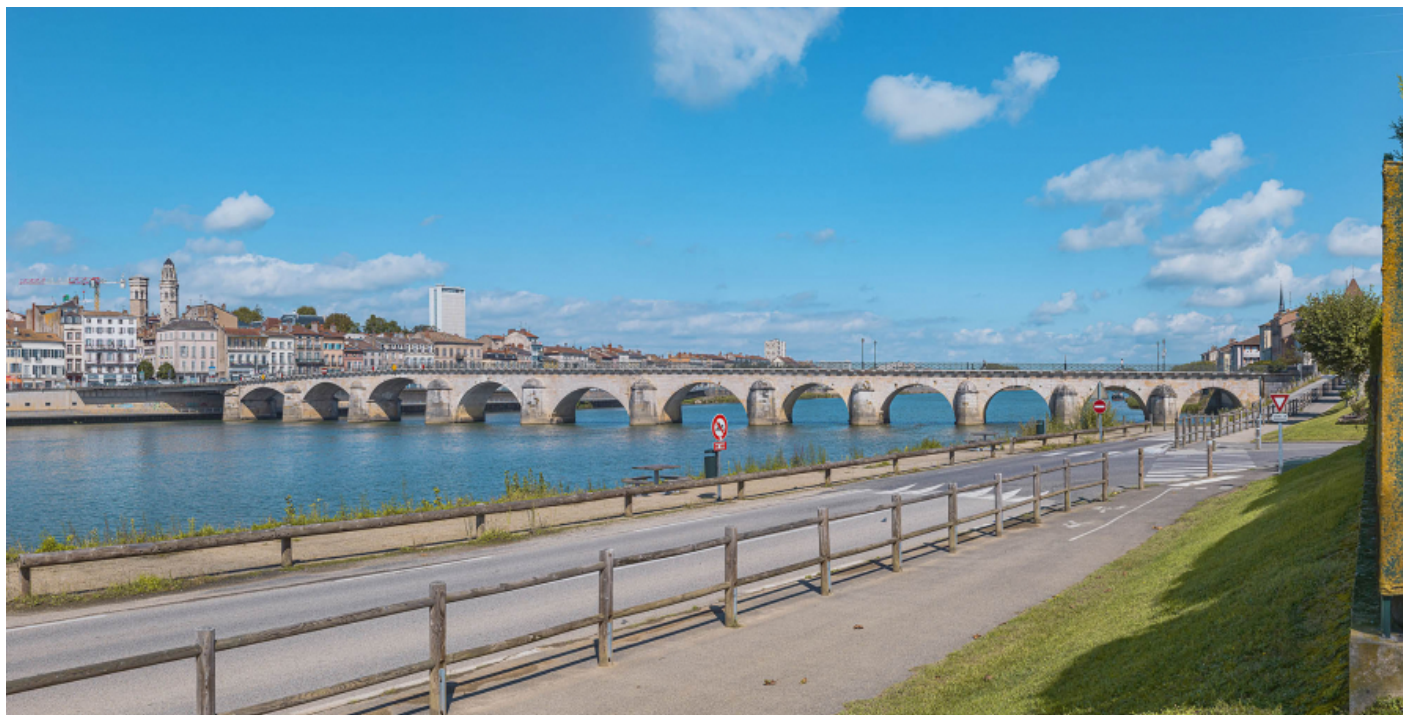
Vue d'ensemble du pont, d'aval et depuis la rive gauche.

71, Mâcon route départementale 1079, lieu-dit : PK 80,6