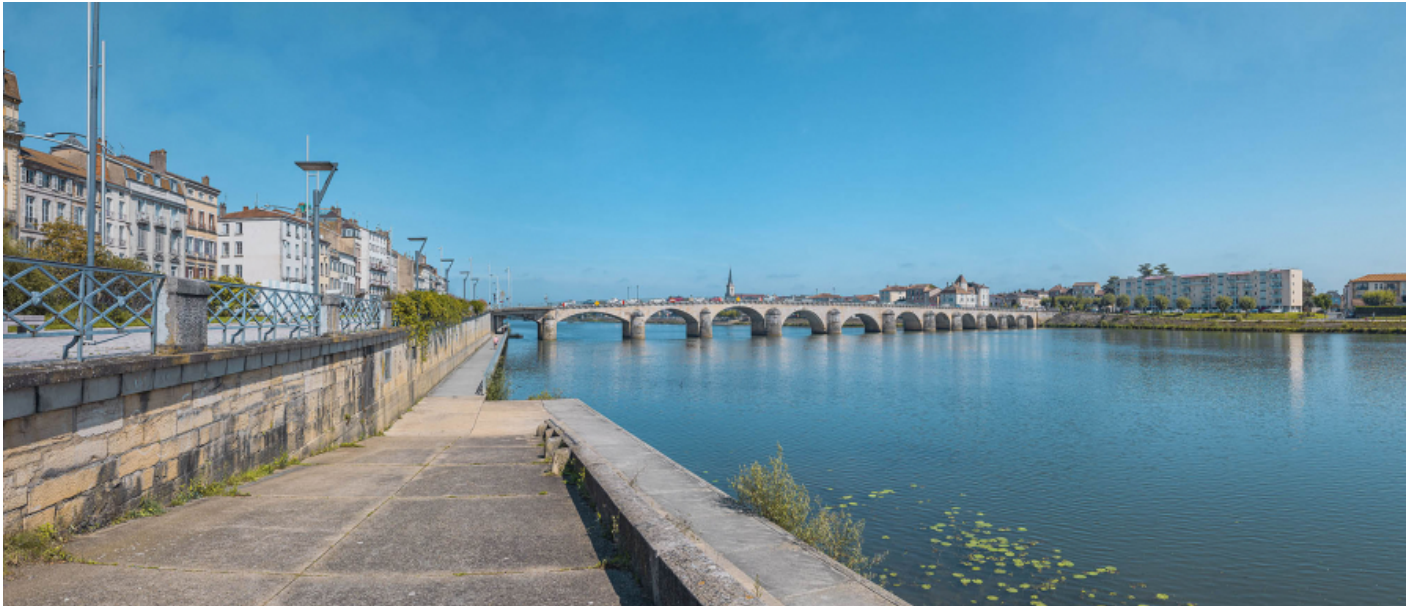
Vue d'ensemble du pont, d'aval et depuis la rive droite.

71, Mâcon route départementale 1079, lieu-dit : PK 80,6