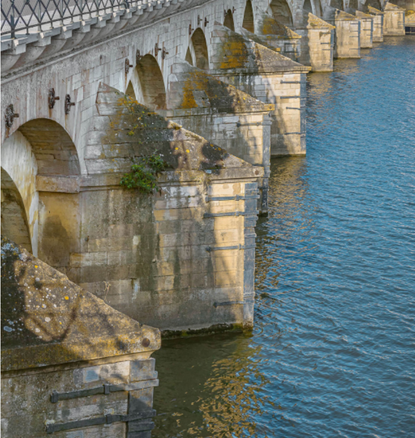
Les avant-becs du pont Saint-Laurent.

71, Mâcon route départementale 1079, lieudit : PK 80,6