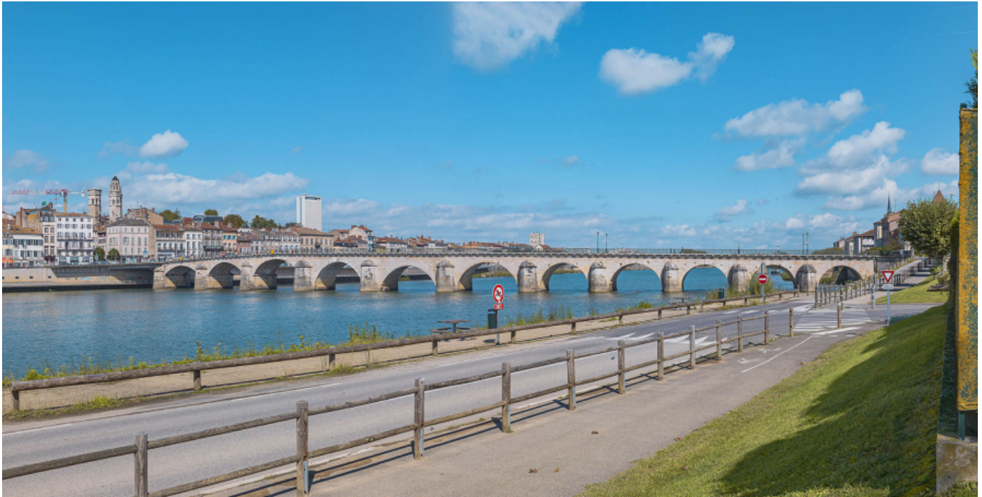
Vue d'ensemble du pont, d'aval et depuis la rive gauche.

71, Mâcon route départementale 1079, lieu-dit : PK 80,6