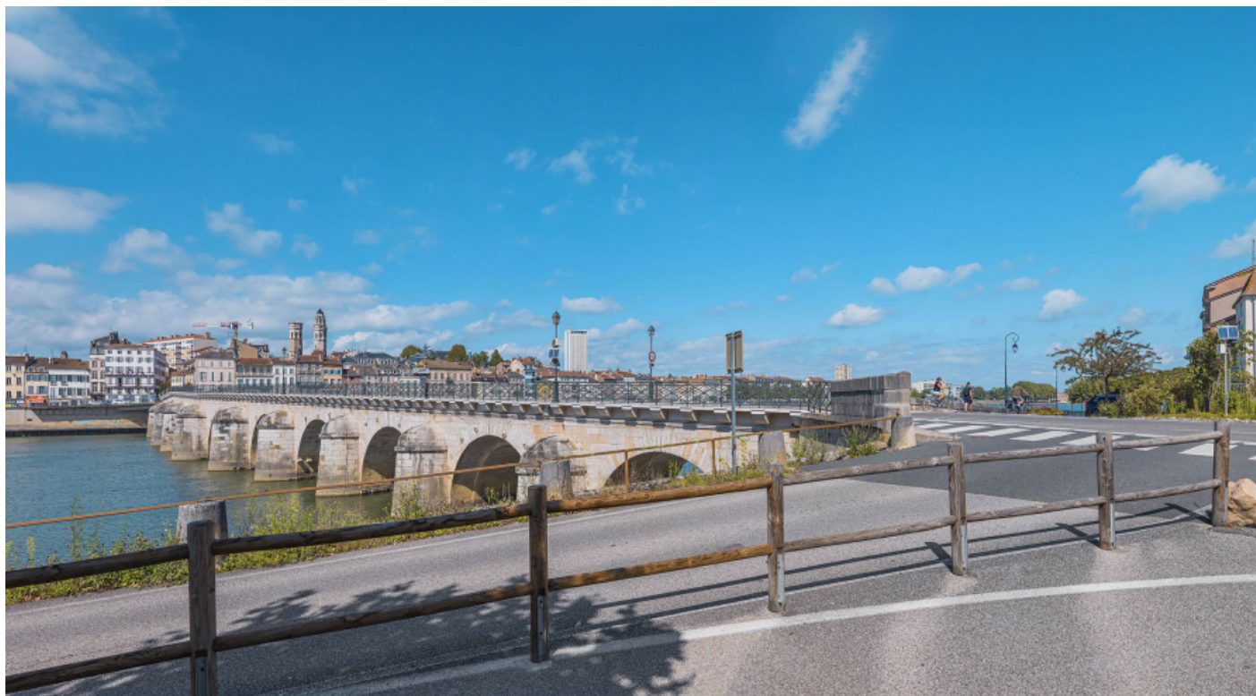
Vue d'ensemble du pont, d'aval et depuis la rive gauche.

71, Mâcon route départementale 1079, lieudit : PK 80,6