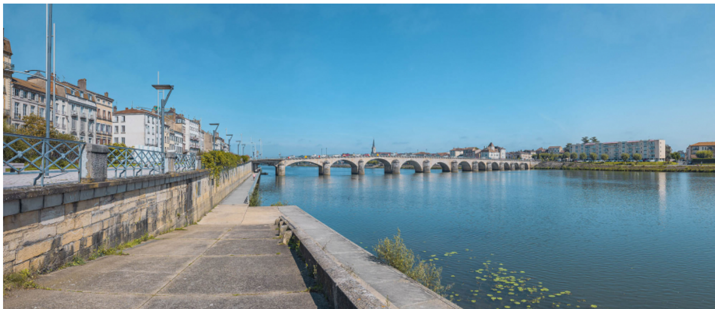
Vue d'ensemble du pont, d'aval et depuis la rive droite.

71, Mâcon route départementale 1079, lieudit : PK 80,6