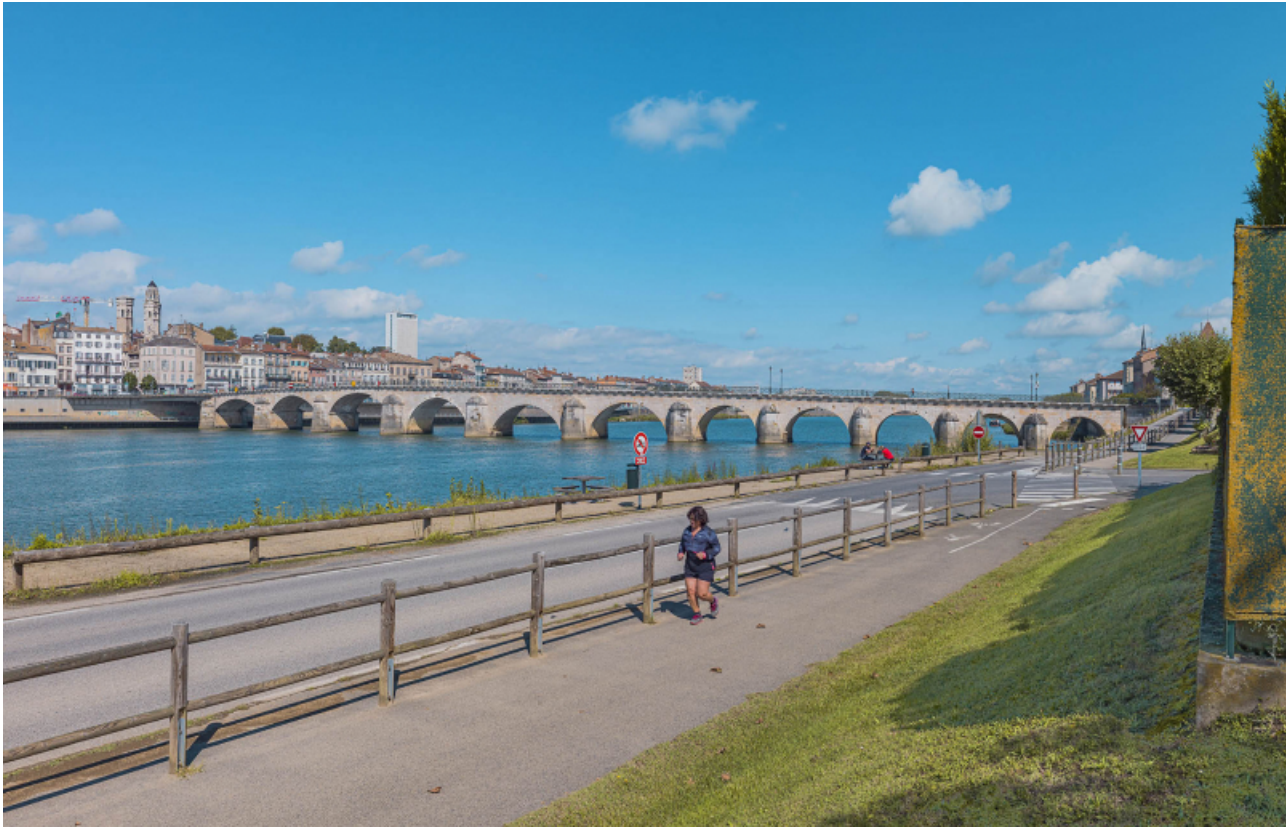
Vue d'ensemble du pont, d'aval et depuis la rive gauche.

71, Mâcon route départementale 1079, lieu-dit : PK 80,6