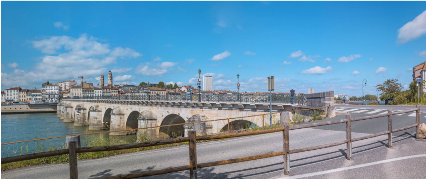
Vue d'ensemble du pont, d'aval et depuis la rive gauche.

71, Mâcon route départementale 1079, lieudit : PK 80,6