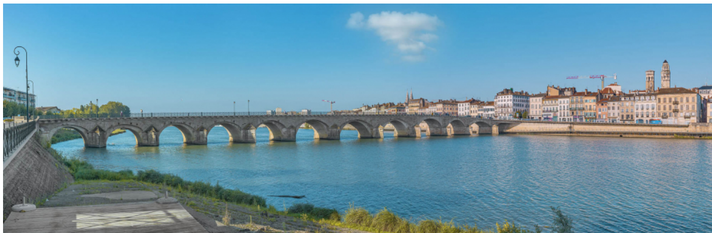
Le pont Saint-Laurent, vu d'amont, depuis la rive gauche.

71, Mâcon route départementale 1079, lieudit : PK 80,6