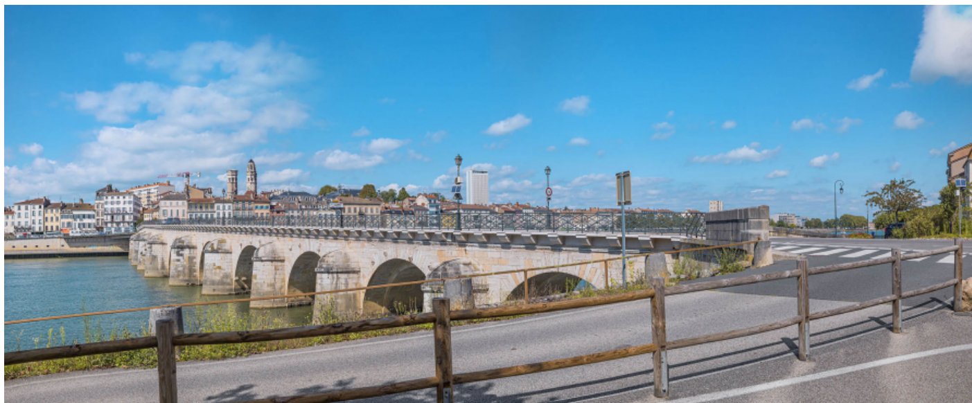
Vue d'ensemble du pont, d'aval et depuis la rive gauche.

71, Mâcon route départementale 1079, lieudit : PK 80,6