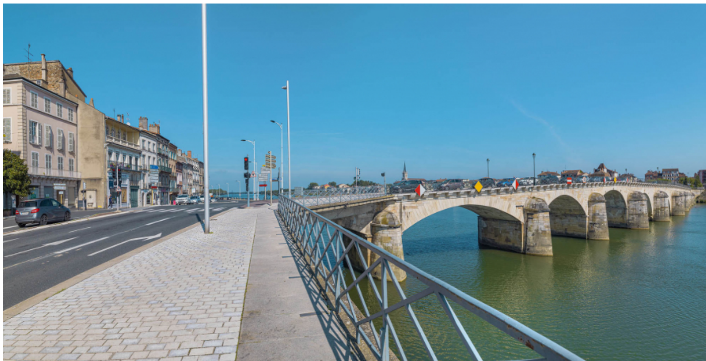
Le pont Saint-Laurent, vu d'aval, rive droite.

71, Mâcon route départementale 1079, lieu-dit : PK 80,6