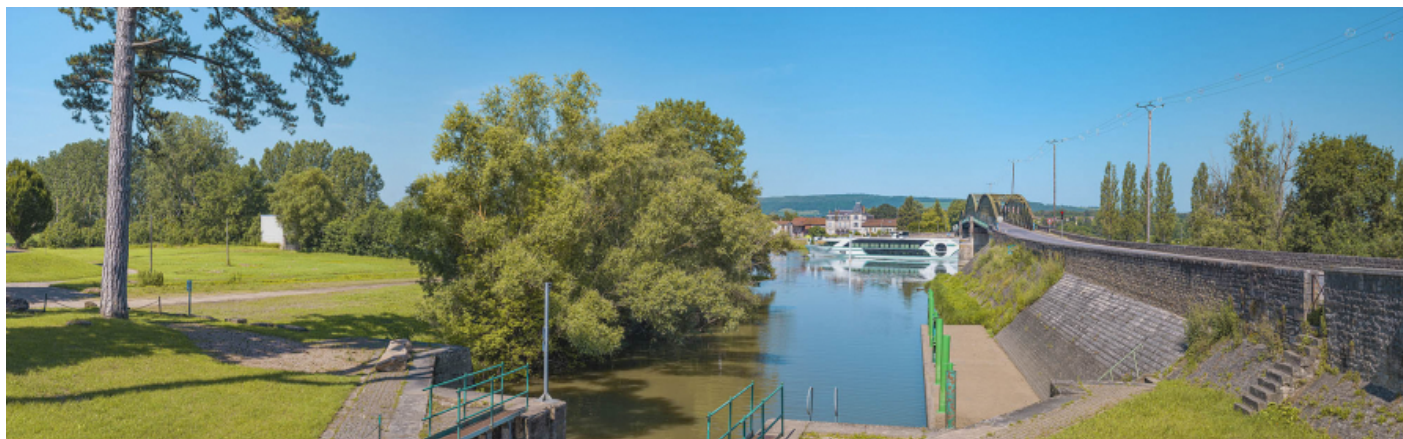
Le pont et le port de Fleurville vus depuis l'entrée du canal de Pont de Vaux, rive gauche.

71, Montbellet route départementale 933A, lieudit : PK 97,45