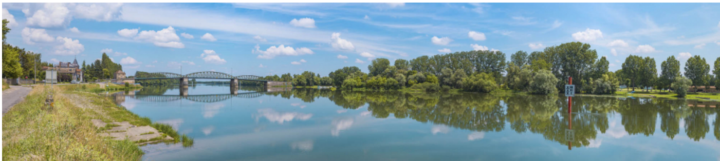
La Saône à hauteur du pont de Fleurville, vu depuis la rive droite.

71, Montbellet route départementale 933A, lieudit : PK 97,45