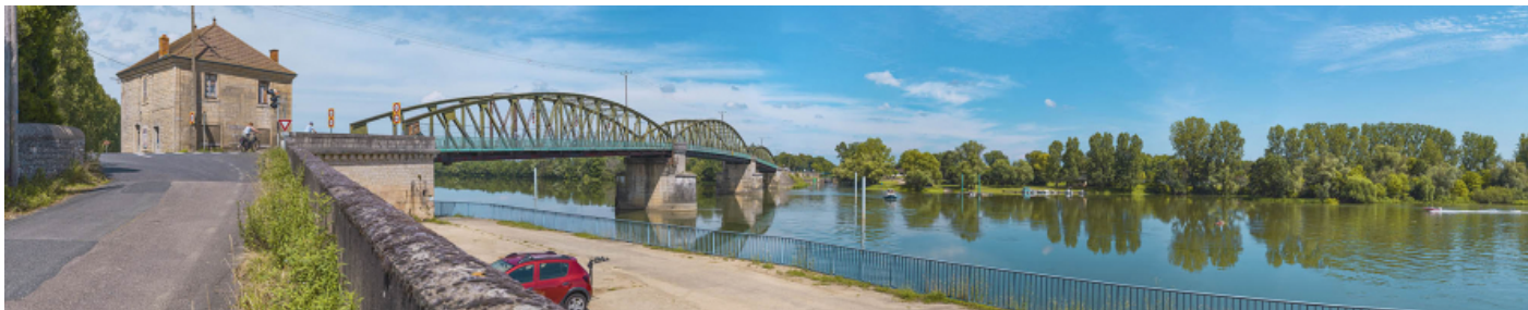
Le pont de Fleurville, vu d'aval, depuis la rive droite. La maison pontière se trouve au premier plan.

71, Montbellet route départementale 933A, lieudit : PK 97,45