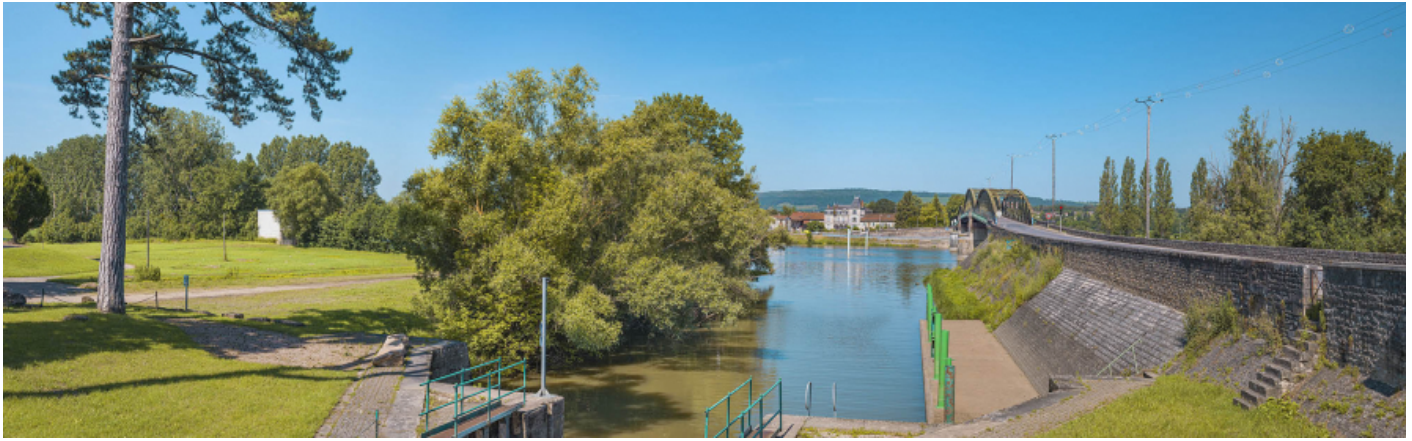
Le port et le pont de Fleurville vus depuis le canal de Pont de Vaux, rive gauche.

71, Montbellet route départementale 933A, lieudit : PK 97,45