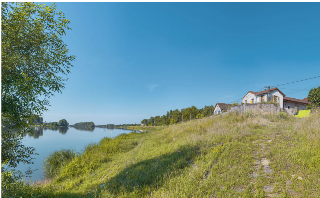
Les gradins du port de Fleurville recouverts par la végétation, rive droite.

71, Montbellet route départementale 933A, lieudit : PK 97,45