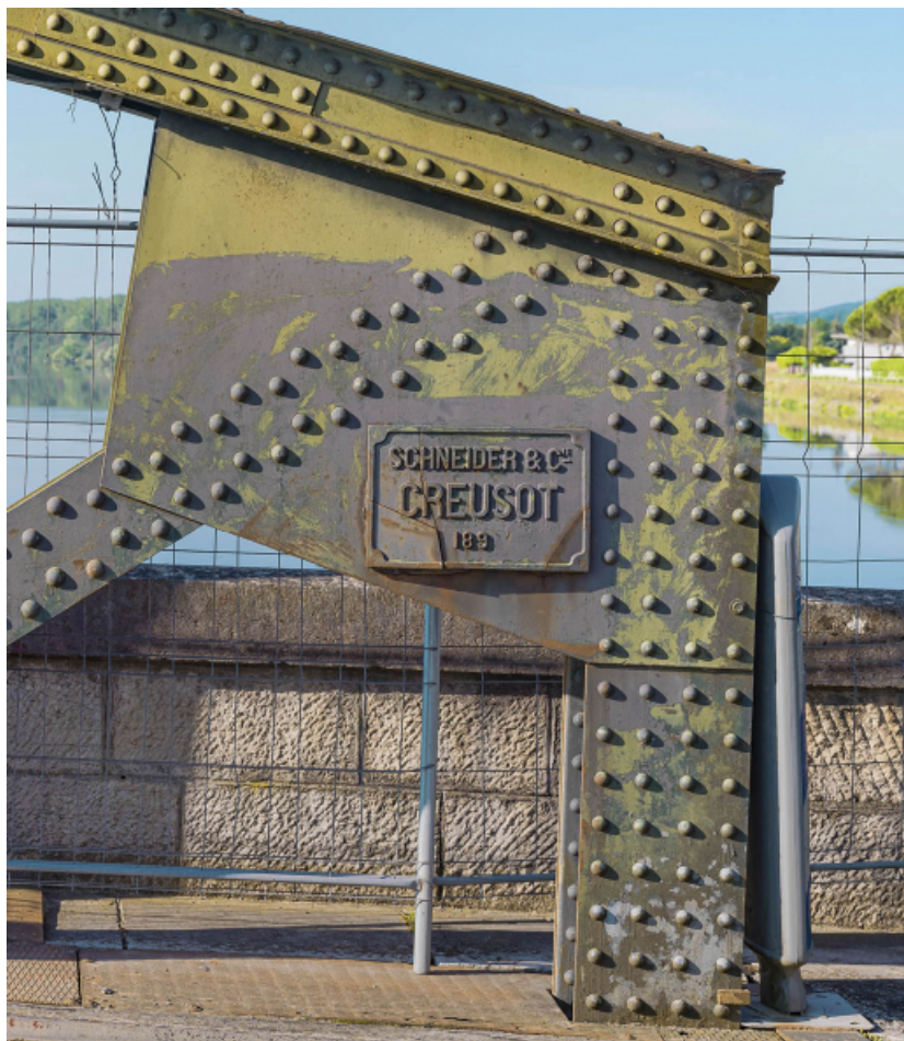
Détail de la structure métallique du pont et de la plaque "Schneider et Cie".

71, Montbellet route départementale 933A, lieudit : PK 97,45