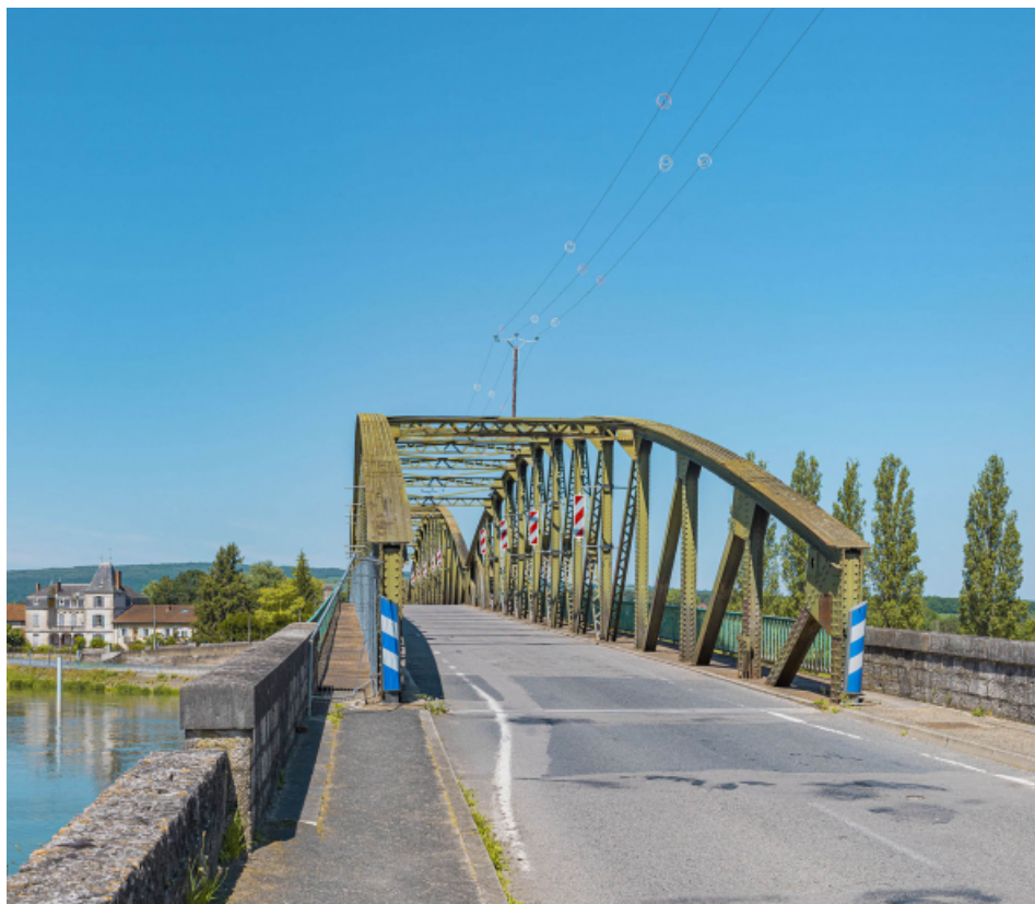
Le pont de Fleurville, depuis la rive gauche.

71, Montbellet route départementale 933A, lieudit : PK 97,45