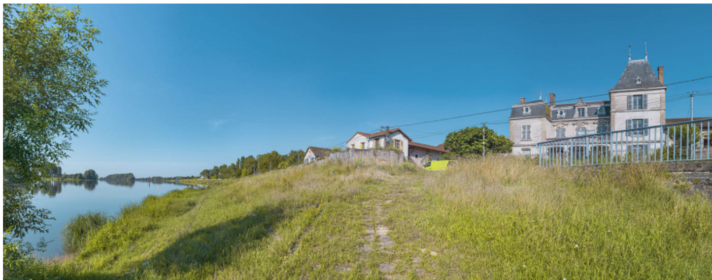
Les gradins du port de Fleurville recouverts par la végétation, rive droite.

71, Montbellet route départementale 933A, lieudit : PK 97,45