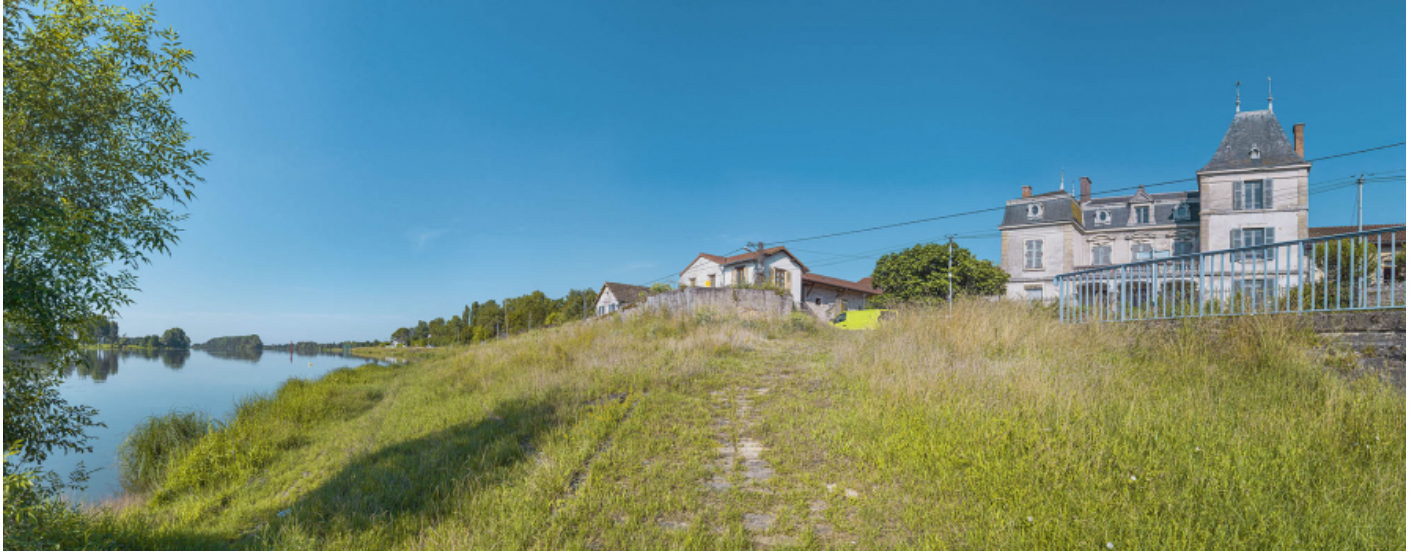
Les gradins du port de Fleurville recouverts par la végétation, rive droite.

71, Montbellet route départementale 933A, lieudit : PK 97,45