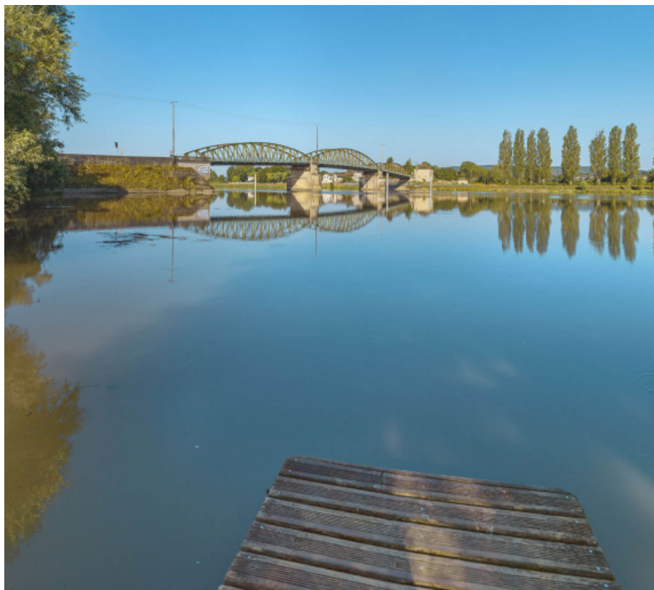
Le pont de Fleurville, vu d'amont et depuis la rive gauche.

71, Montbellet route départementale 933A, lieudit : PK 97,45