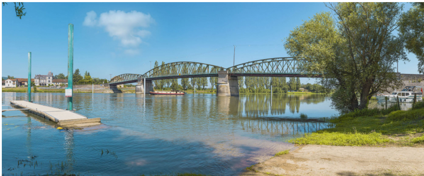
Le pont de Fleurville, vu d'aval, depuis la rive gauche.

71, Montbellet route départementale 933A, lieudit : PK 97,45