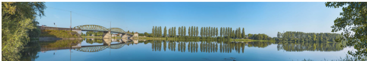
Le pont de Fleurville, vu d'amont, depuis la rive gauche. 71, Montbellet route départementale 933A, lieudit : PK 97,45