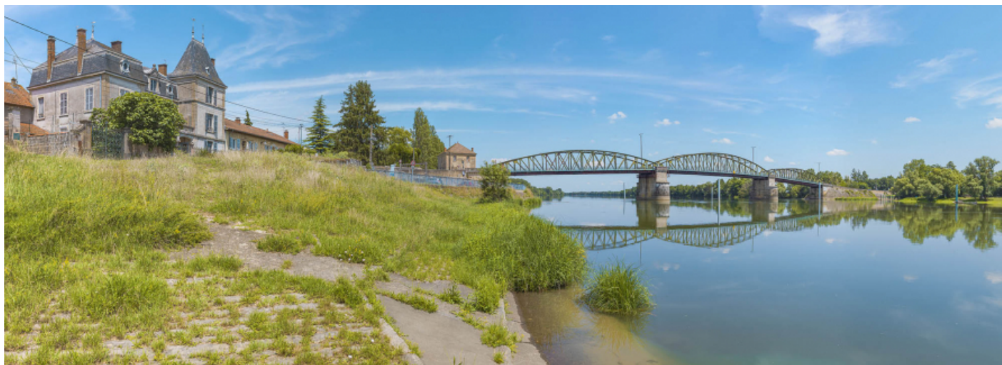
Le port à gradins de Fleurville, sur la rive droite. En arrière-plan le pont de Fleurville.

71, Montbellet route départementale 933A, lieudit : PK 97,45