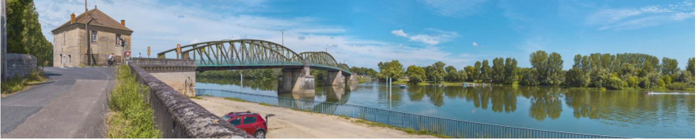
Le pont de Fleurville, vu d'aval, depuis la rive droite. La maison pontière se trouve au premier plan.

71, Montbellet route départementale 933A, lieudit : PK 97,45