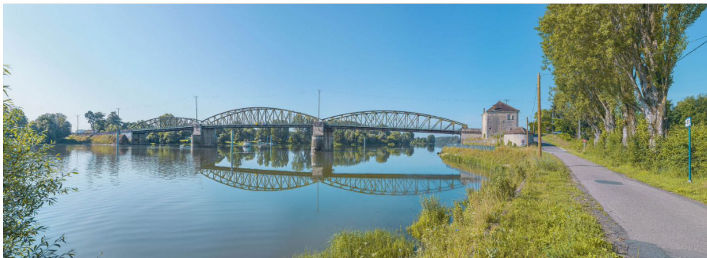
Le pont de Fleurville, vu d'amont, depuis la rive droite.

71, Montbellet route départementale 933A, lieudit : PK 97,45