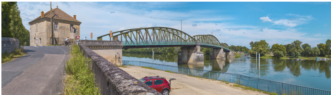
Le pont de Fleurville, vu d'aval, depuis la rive droite. La maison pontière se trouve au premier plan.

71, Montbellet route départementale 933A, lieudit : PK 97,45