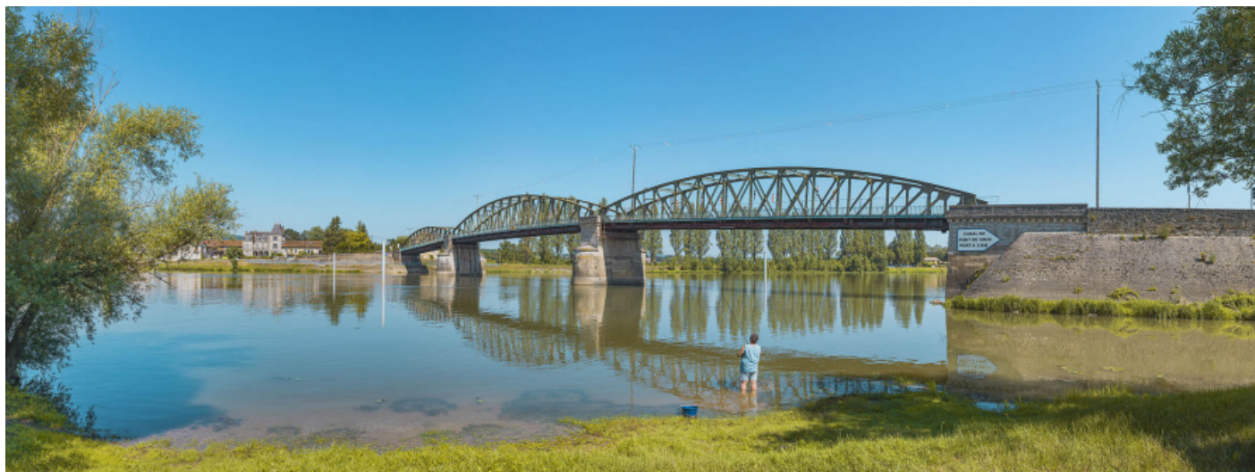
Le pont de Fleurville, vu d'aval, depuis la rive gauche.

71, Montbellet route départementale 933A, lieudit : PK 97,45