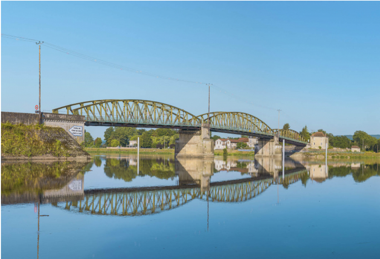
Le pont de Fleurville, vu d'amont, depuis la rive gauche. 71, Montbellet route départementale 933A, lieudit : PK 97,45