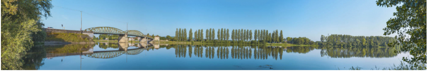
Le pont de Fleurville, vu d'amont, depuis la rive gauche. 71, Montbellet route départementale 933A, lieudit : PK 97,45