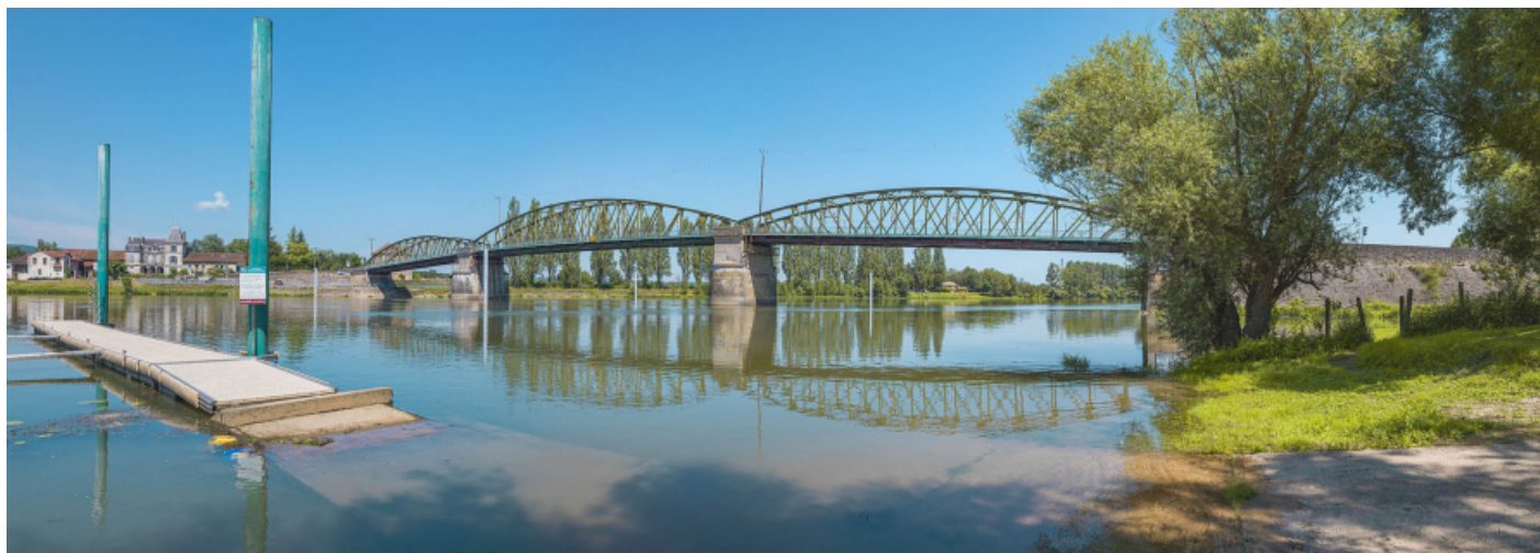
Le pont de Fleurville, vu d'aval, depuis la rive gauche.

71, Montbellet route départementale 933A, lieudit : PK 97,45