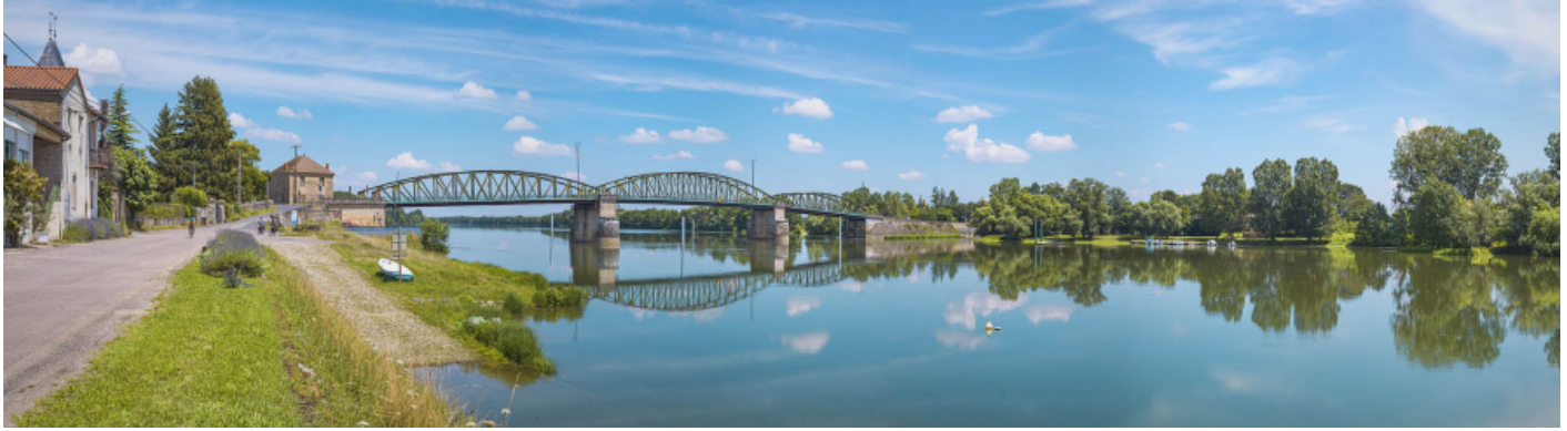
Le pont de Fleurville, vu d'aval, depuis la rive droite. Le port à gradins et la rampe se trouvent au premier plan. 71, Montbellet route départementale 933A, lieudit : PK 97,45