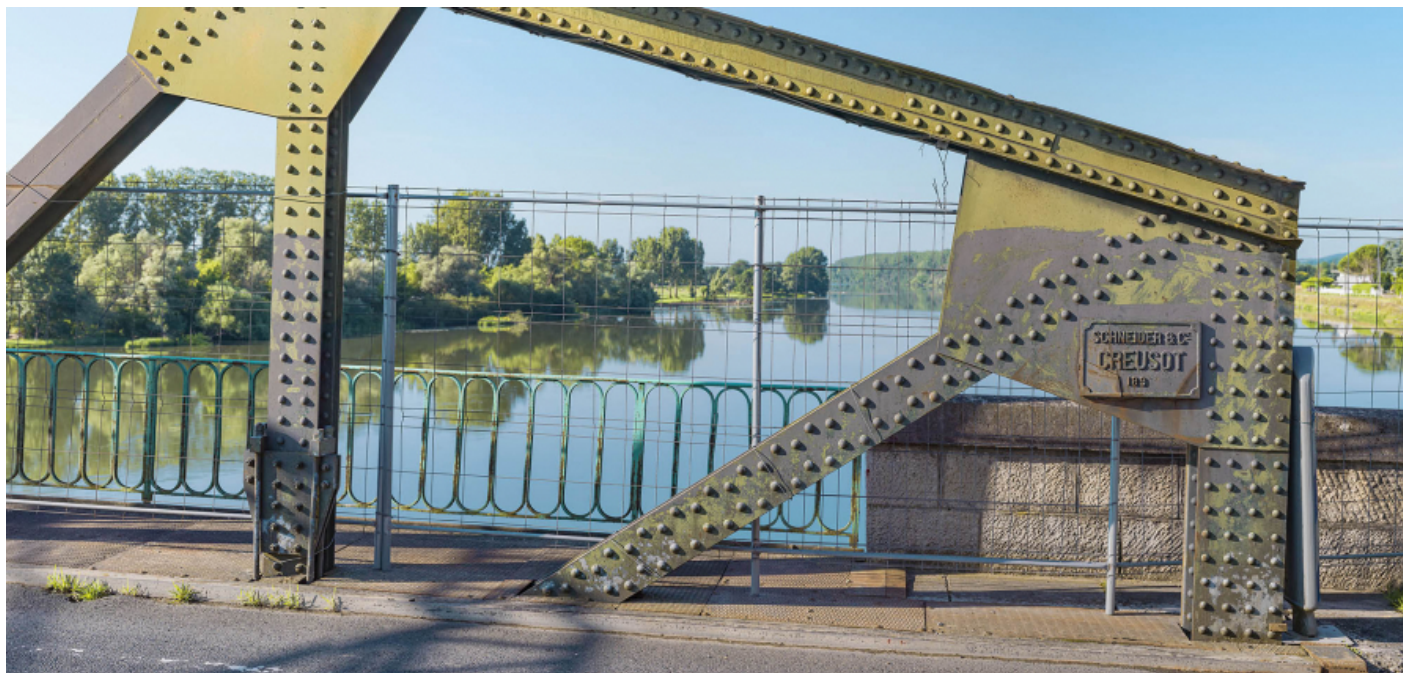
Détail de la structure métallique du pont et de la plaque "Schneider et Cie".

71, Montbellet route départementale 933A, lieudit : PK 97,45