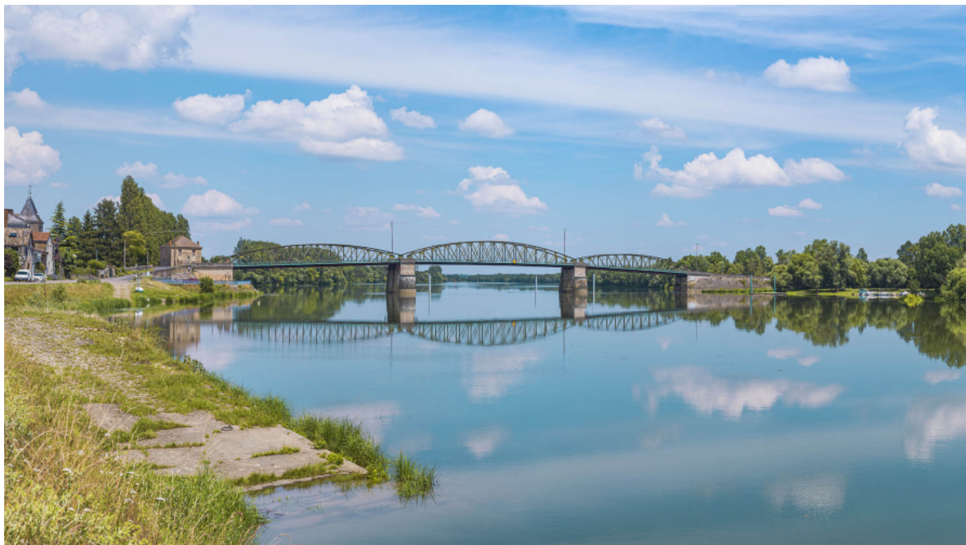
Le pont de Fleurville, vu d'aval, depuis la rive droite.

71, Montbellet route départementale 933A, lieudit : PK 97,45