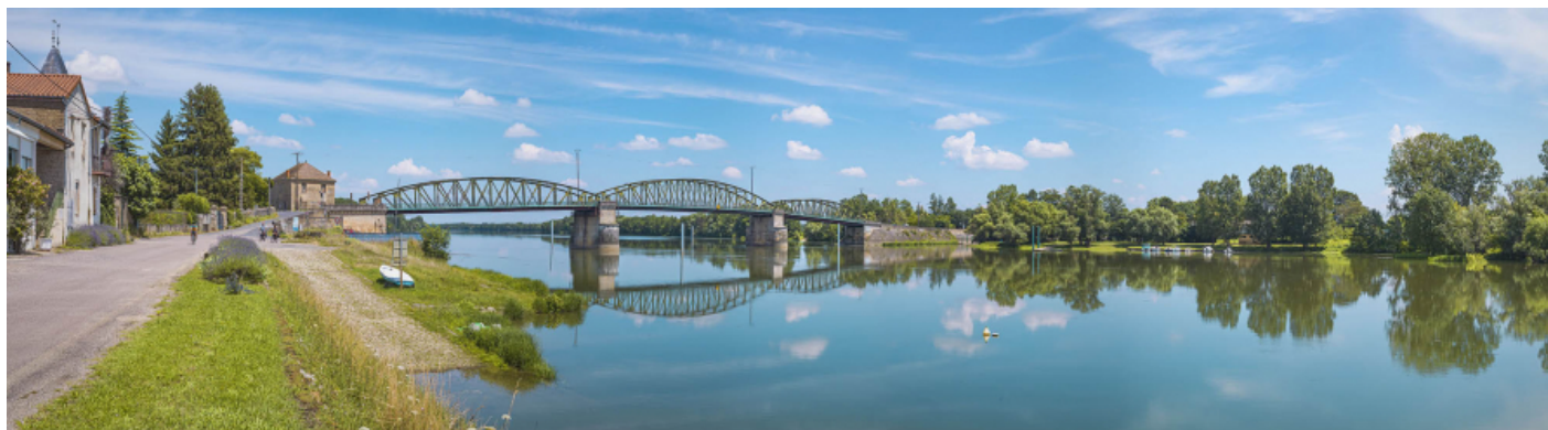
Le pont de Fleurville, vu d'aval, depuis la rive droite. Le port à gradins et la rampe se trouvent au premier plan.

71, Montbellet route départementale 933A, lieudit : PK 97,45