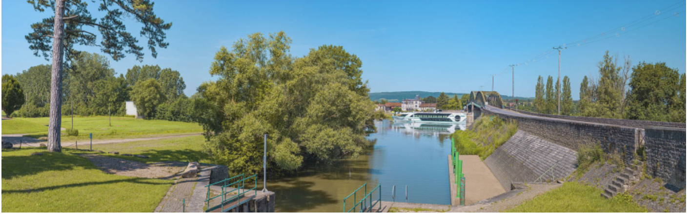
Le pont et le port de Fleurville vus depuis l'entrée du canal de Pont de Vaux, rive gauche.

71, Montbellet route départementale 933A, lieudit : PK 97,45