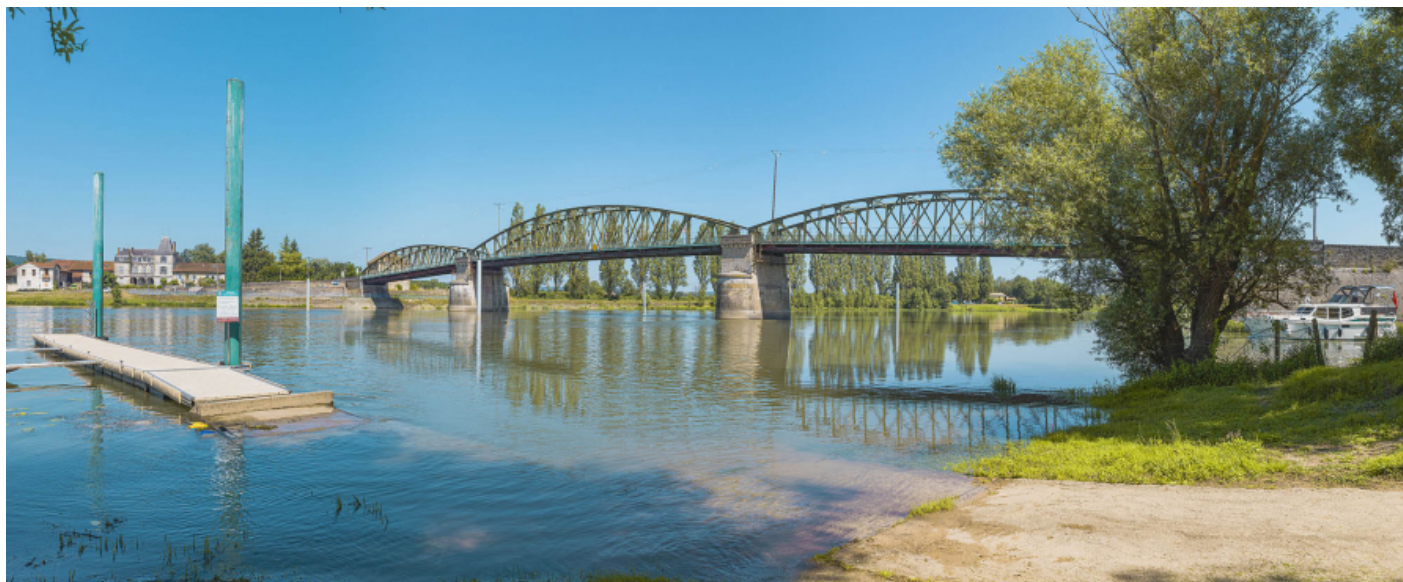
Le pont de Fleurville, vu d'aval, depuis la rive gauche.

71, Montbellet route départementale 933A, lieudit : PK 97,45