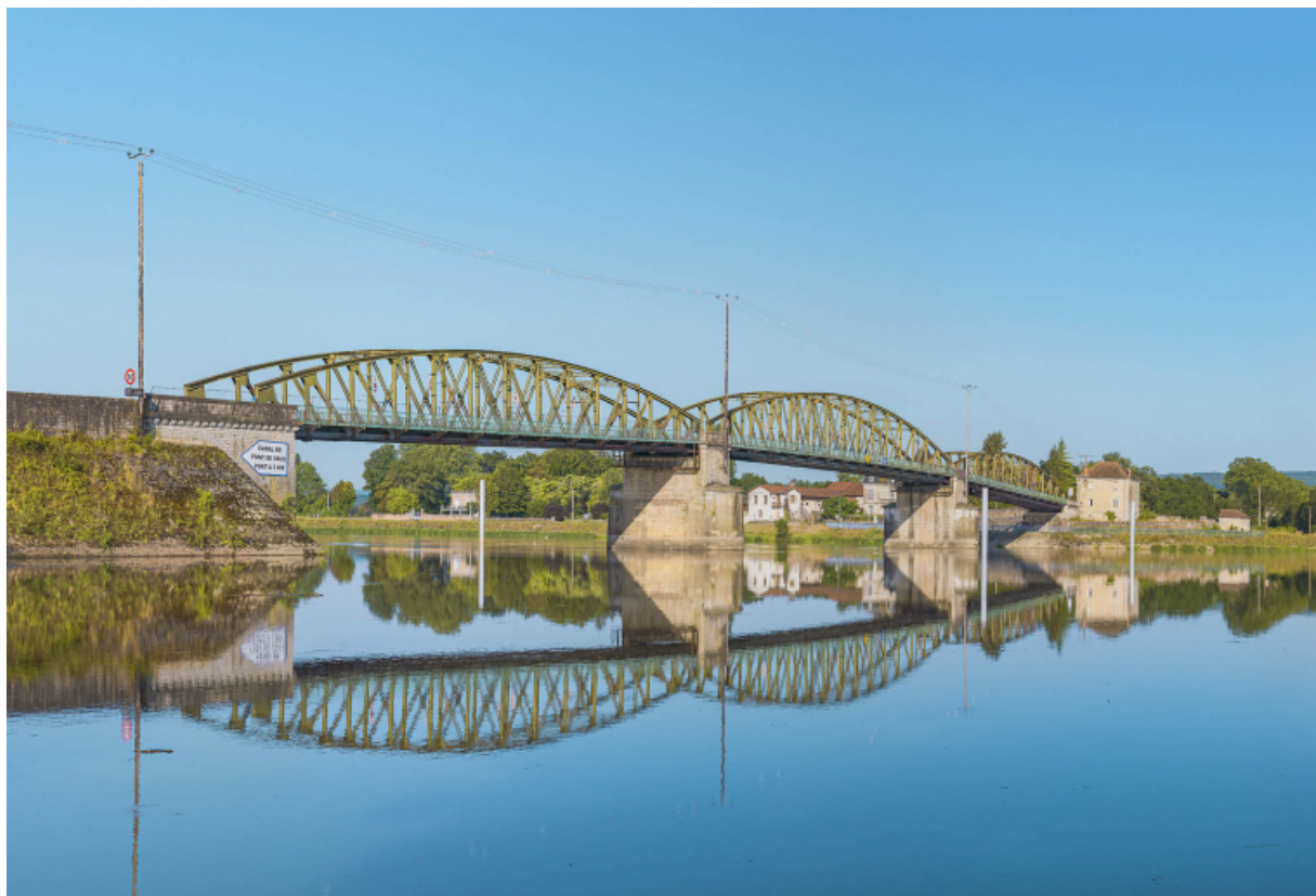
Le pont de Fleurville, vu d'amont, depuis la rive gauche. 71, Montbellet route départementale 933A, lieudit : PK 97,45