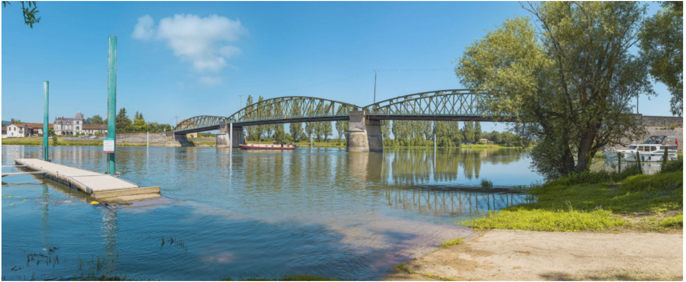
Le pont de Fleurville, vu d'aval, depuis la rive gauche.

71, Montbellet route départementale 933A, lieudit : PK 97,45