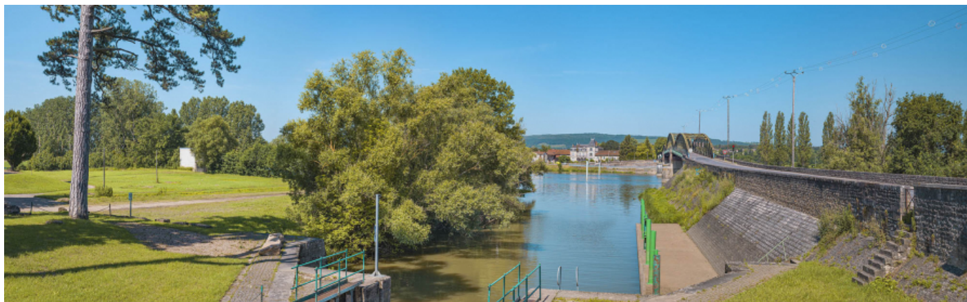
Le port et le pont de Fleurville vus depuis le canal de Pont de Vaux, rive gauche.

71, Montbellet route départementale 933A, lieudit : PK 97,45