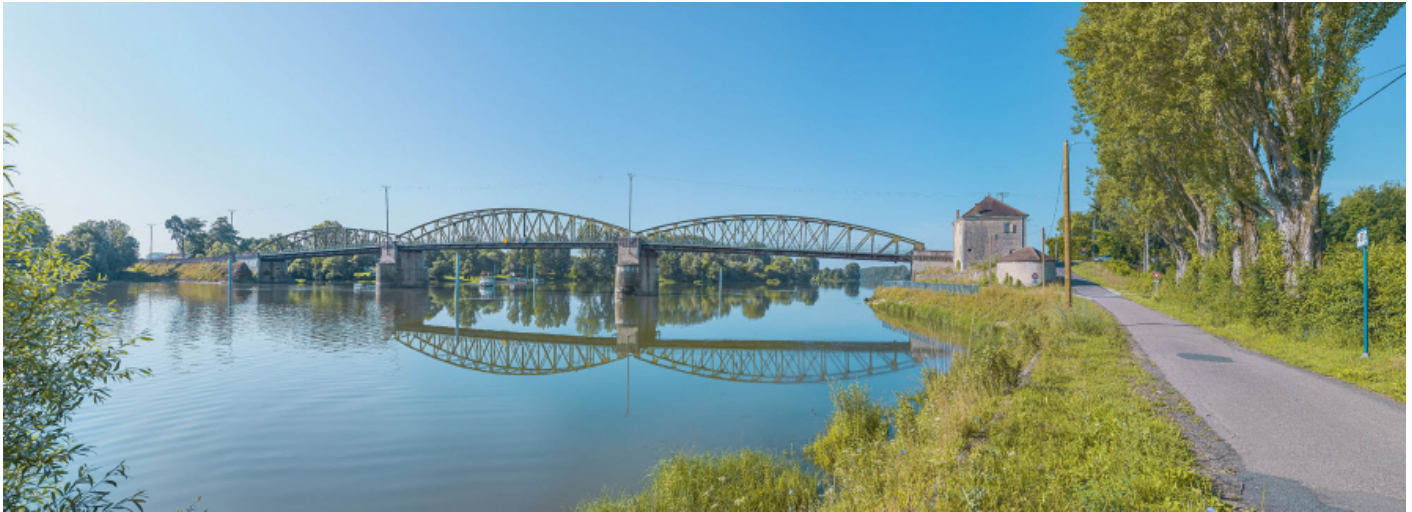
Le pont de Fleurville, vu d'amont, depuis la rive droite.

71, Montbellet route départementale 933A, lieudit : PK 97,45