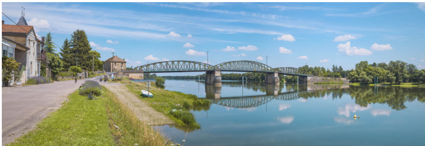
Le pont de Fleurville, vu d'aval, depuis la rive droite. Le port à gradins et la rampe se trouvent au premier plan.