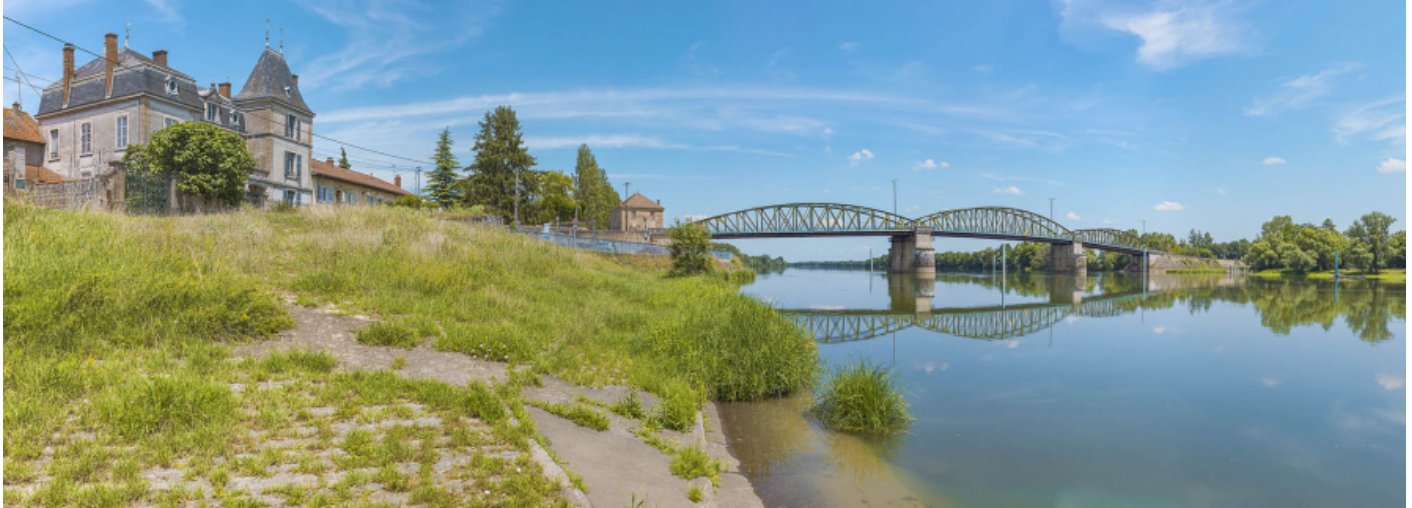
Le port à gradins de Fleurville, sur la rive droite. En arrière-plan le pont de Fleurville.

71, Montbellet route départementale 933A, lieudit : PK 97,45