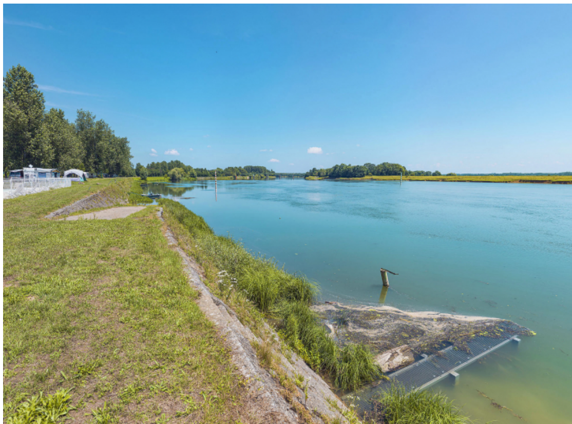
Rampe, perrés et escalier du port d'Uchizy.