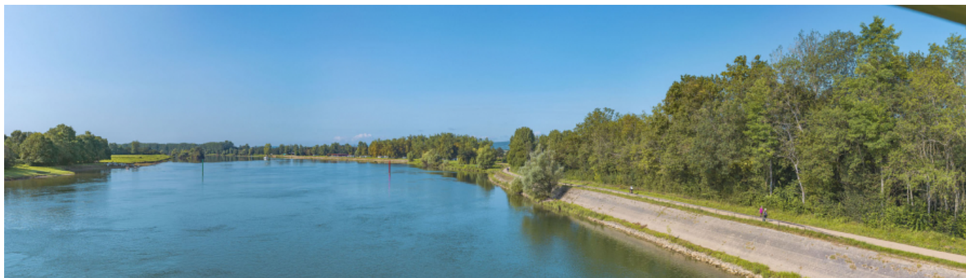
Les perrés en amont du port d'Uchizy, au niveau du pont d'Uchizy.