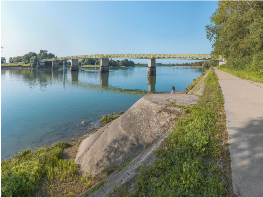
Vue d'ensemble du pont d'amont et depuis la rive droite. Perrés et rampe au premier plan.

71, Uchizy route départementale 163, lieudit : PK 103,2