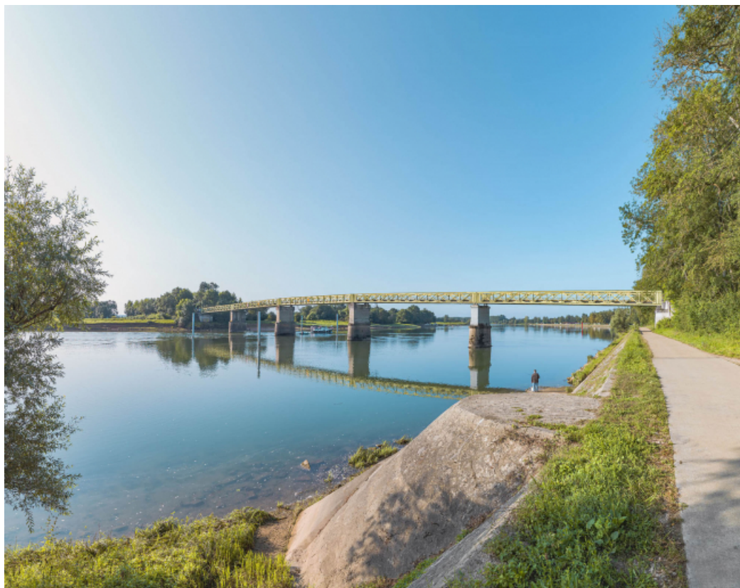
Vue d'ensemble du pont d'amont et depuis la rive droite. Perrés et rampe au premier plan. 71, Uchizy route départementale 163, lieudit : PK 103,2