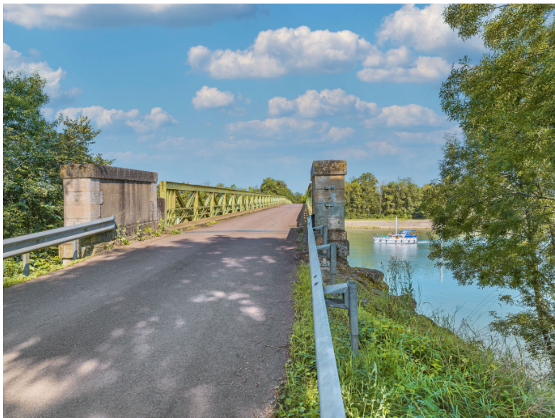
Vue du dessus du pont, rive gauche.

71, Uchizy route départementale 163, lieudit : PK 103,2