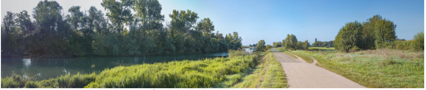
Le passage de l'île d'Uchizy en amont du pont. À gauche, la Saône et à droite, la lône. 71, Uchizy route départementale 163, lieudit : PK 103,2