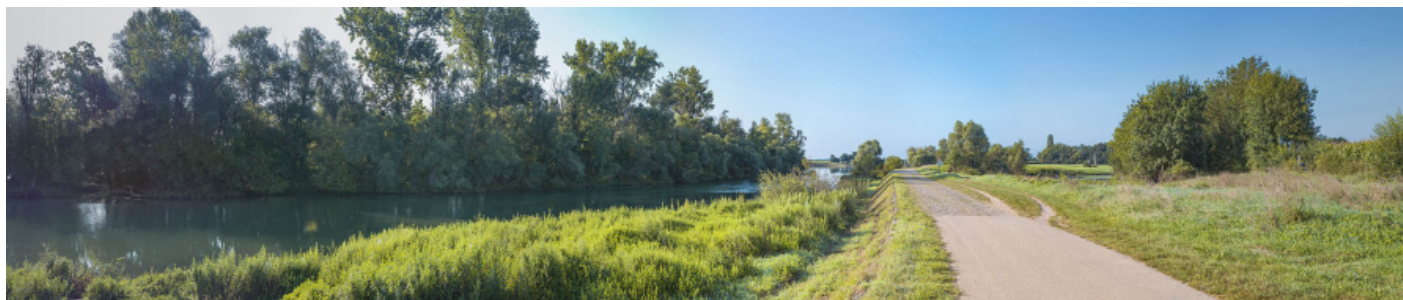
Le passage de l'île d'Uchizy en amont du pont. À gauche, la Saône et à droite, la lône. 71, Uchizy route départementale 163, lieudit : PK 103,2