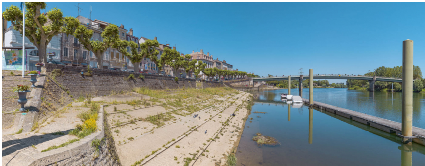
La partie amont des quais à gradins.