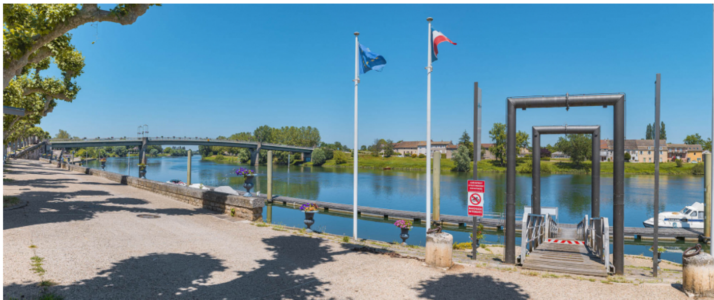
Passerelle donnant accès aux pontons en rivière, au milieu des quais à gradins.

71, Tournus quai de Verdun, lieudit : PK 112