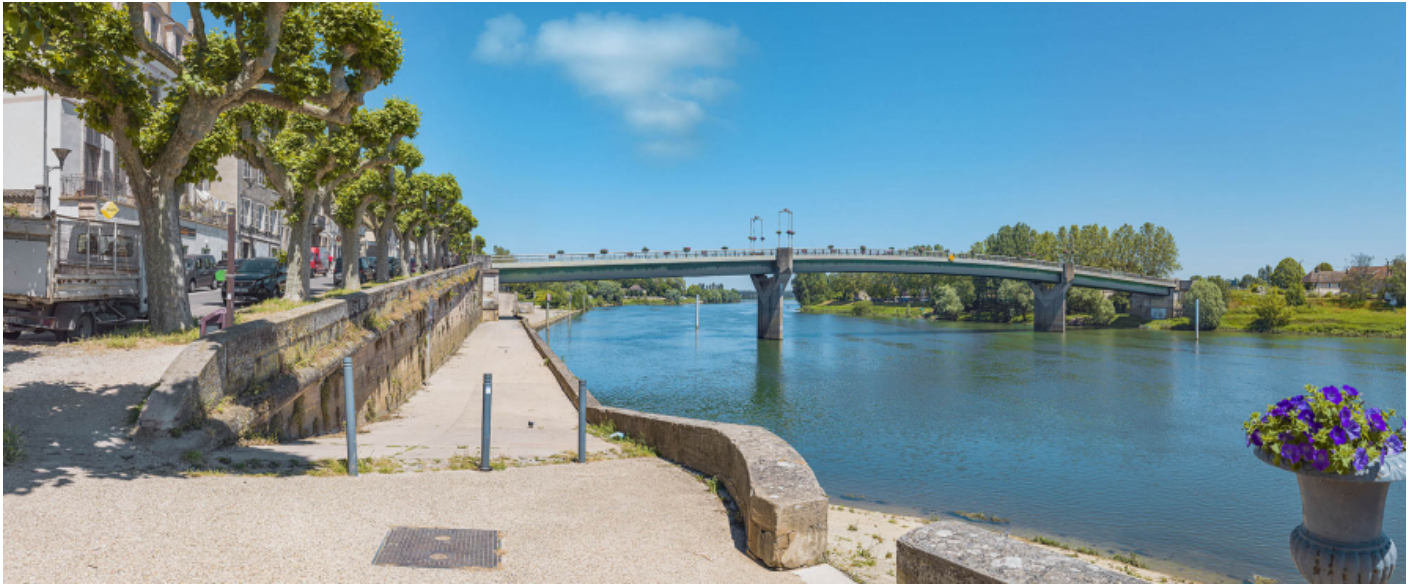
Le pont de Tournus, vu d'aval, au niveau de la banquette de halage.

71, Tournus rue Jean Jaurès, lieudit : PK 110,9