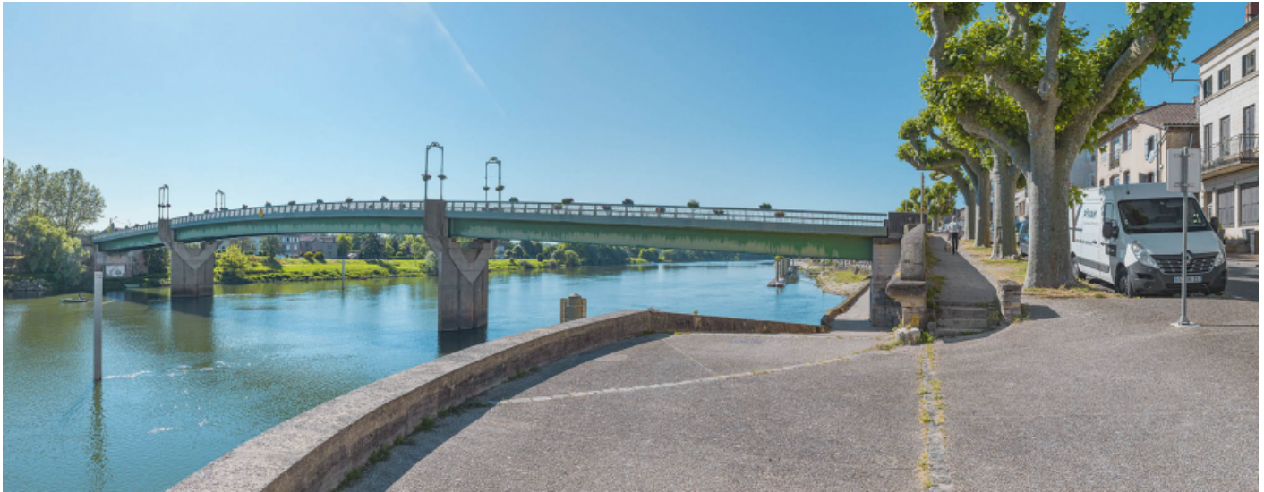
Le pont de Tournus, vu d'amont, rive droite. 71, Tournus rue Jean Jaurès, lieudit : PK 110,9