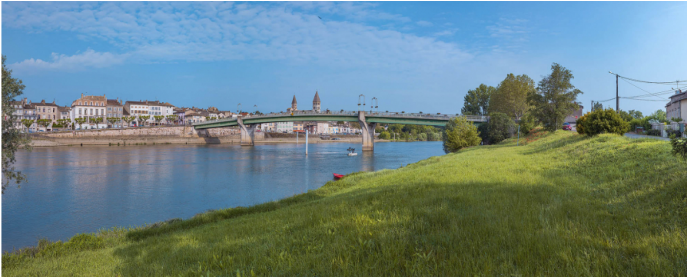
Le pont de Tournus, vu d'aval, depuis la rive gauche.

71, Tournus rue Jean Jaurès, lieudit : PK 110,9