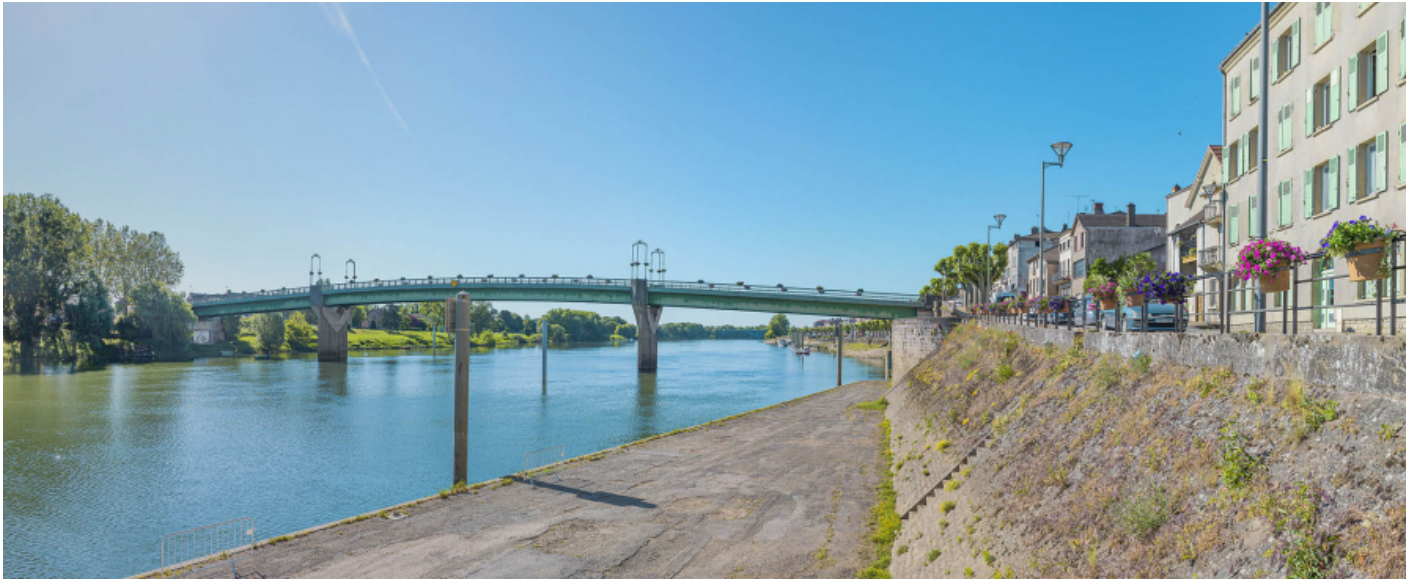
Le pont de Tournus, vu d'amont, rive droite. 71, Tournus rue Jean Jaurès, lieudit : PK 110,9