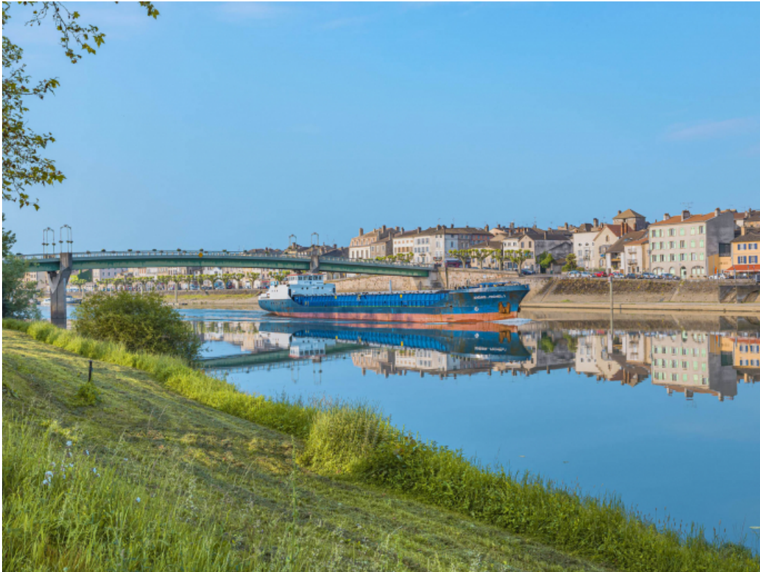
Le pont de Tournus, vu d'amont, depuis la rive gauche.

71, Tournus rue Jean Jaurès, lieudit : PK 110,9