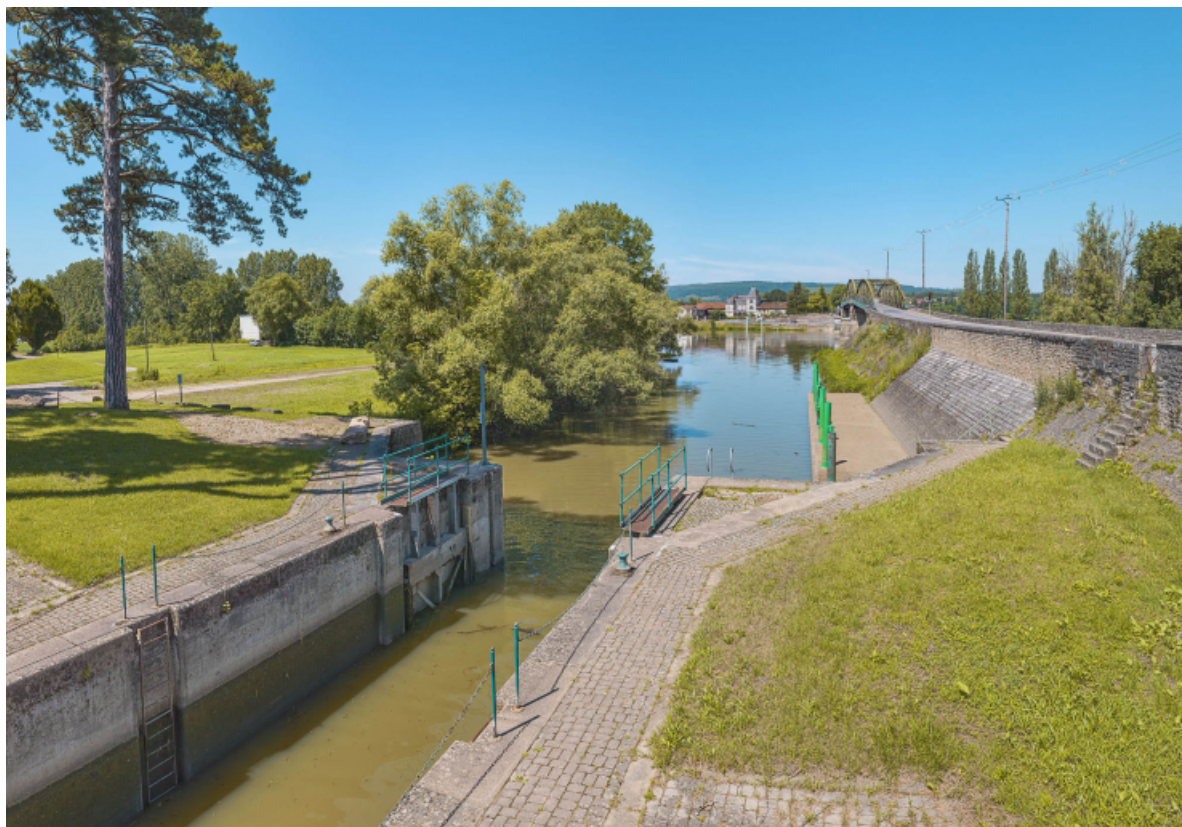
L'entrée du canal de Pont-de-Vaux à hauteur du pont de Fleurville.