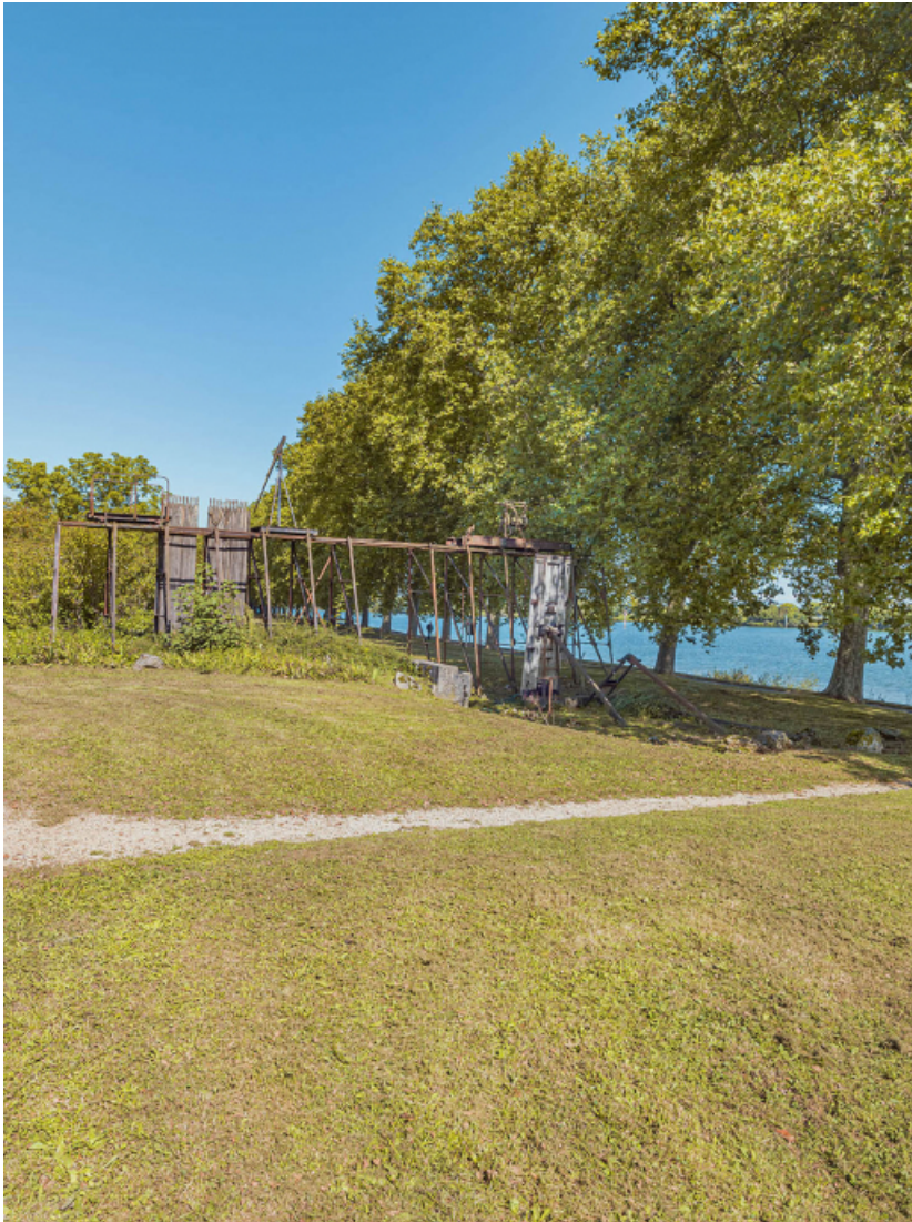
Les vestiges de l'ancien barrage de Thoissey, à Mâcon.