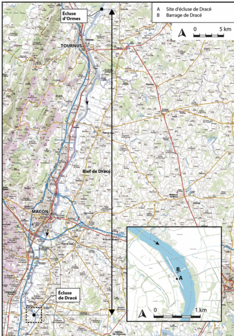
Plan de localisation (1/200 000). Extrait du ScanExpress standard © IGN 2018. 71, Ormes, lieudit : PK 119