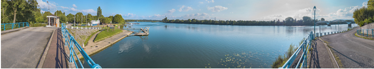
La Saône à la hauteur de Thoissey : à gauche, le barrage de Dracé et à droite, le pont de Thoissey.