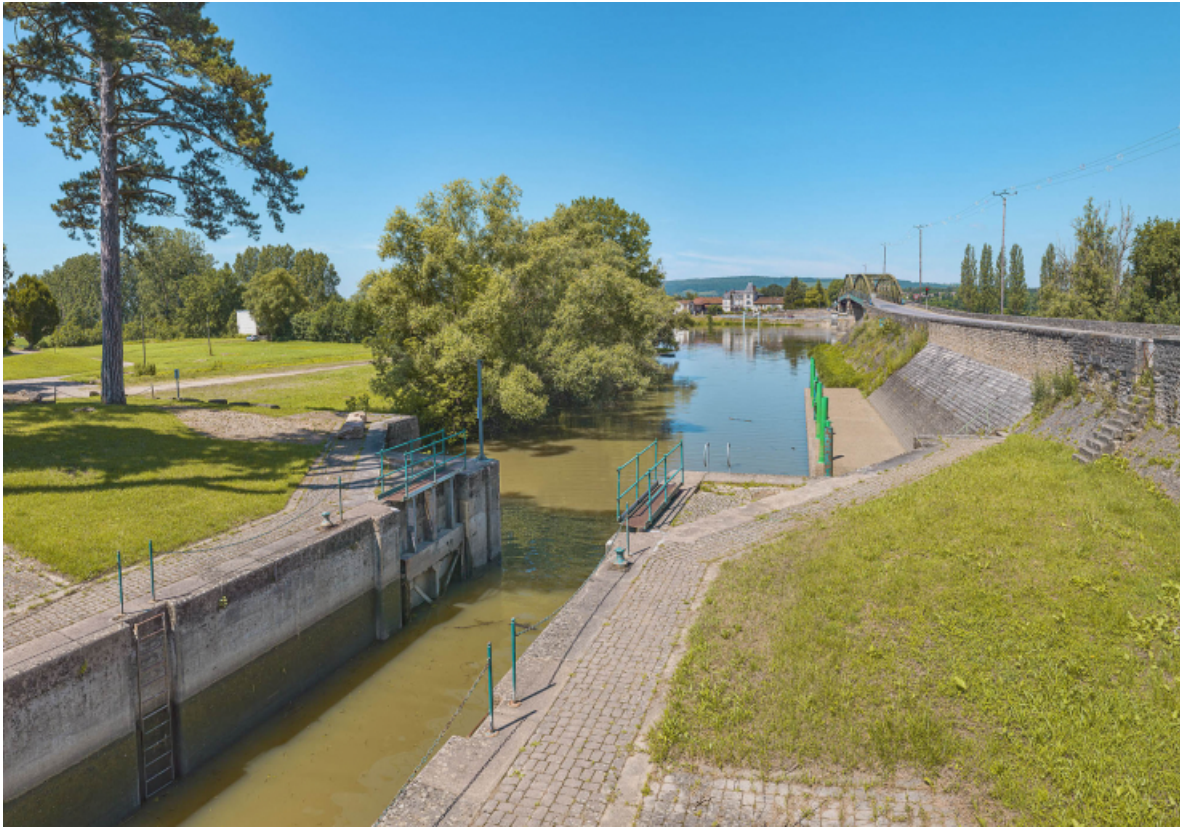
L'entrée du canal de Pont-de-Vaux à hauteur du pont de Fleurville.