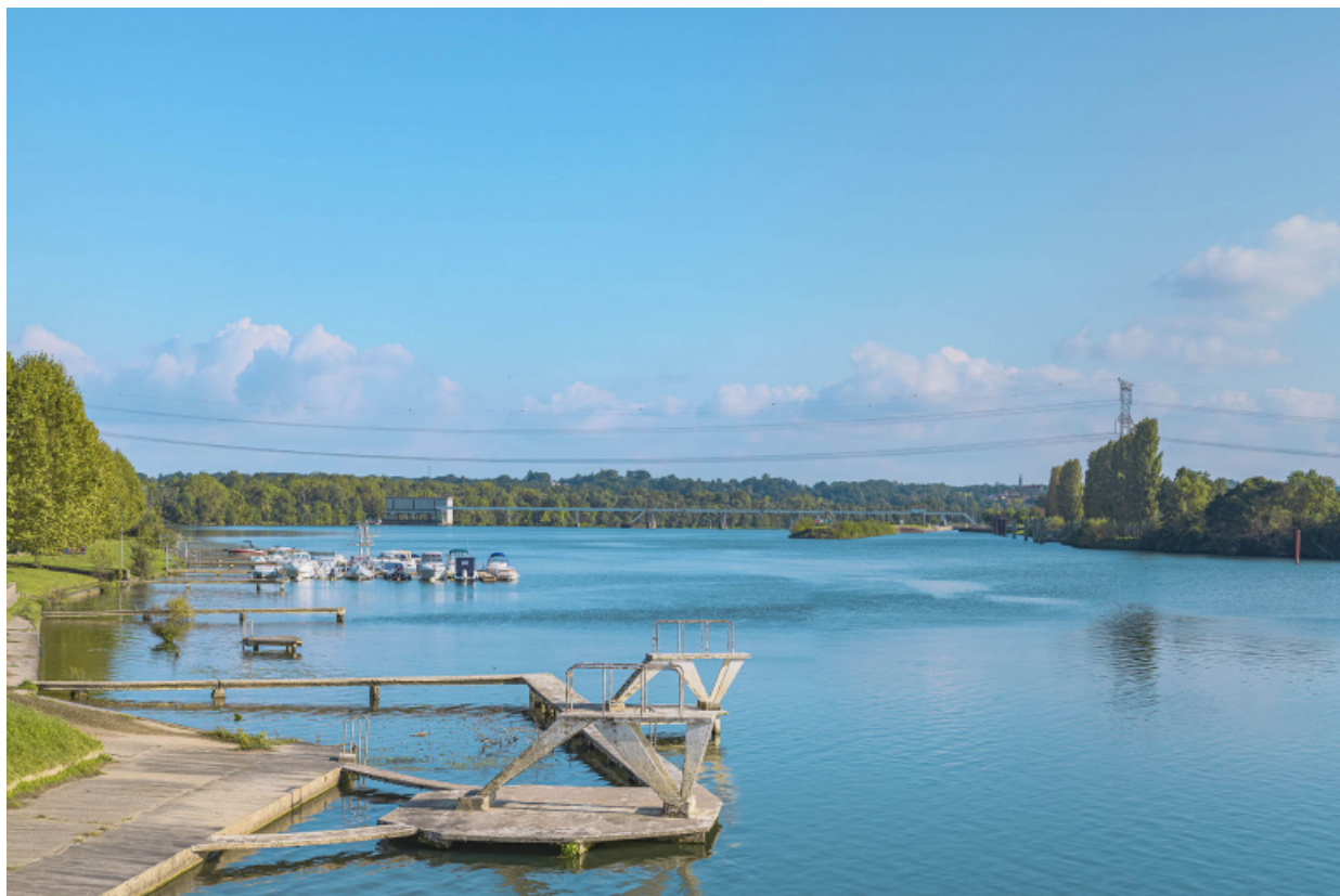
Le barrage de Dracé vu depuis Thoissey.