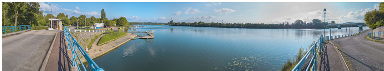
La Saône à la hauteur de Thoissey : à gauche, le barrage de Dracé et à droite, le pont de Thoissey.