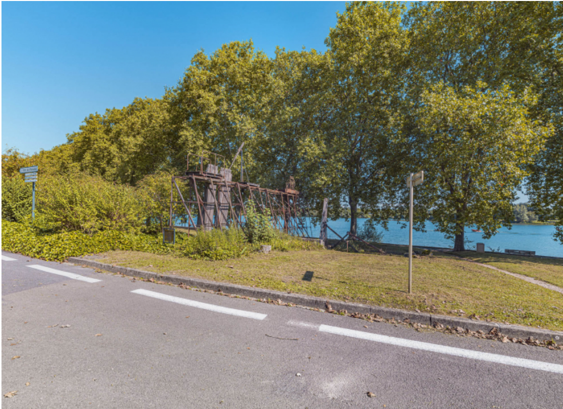
Les vestiges de l'ancien barrage de Thoisy à Mâcon.