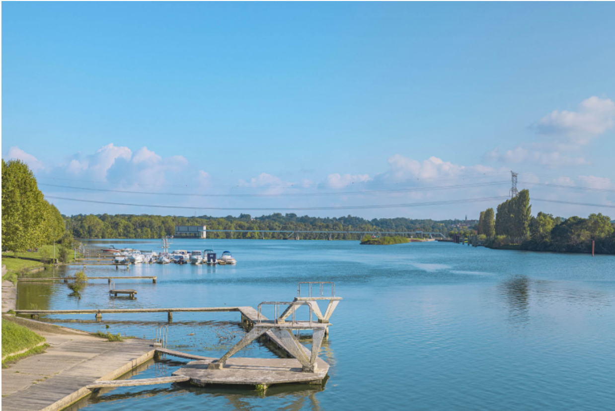
Le barrage de Dracé vu depuis Thoissey.