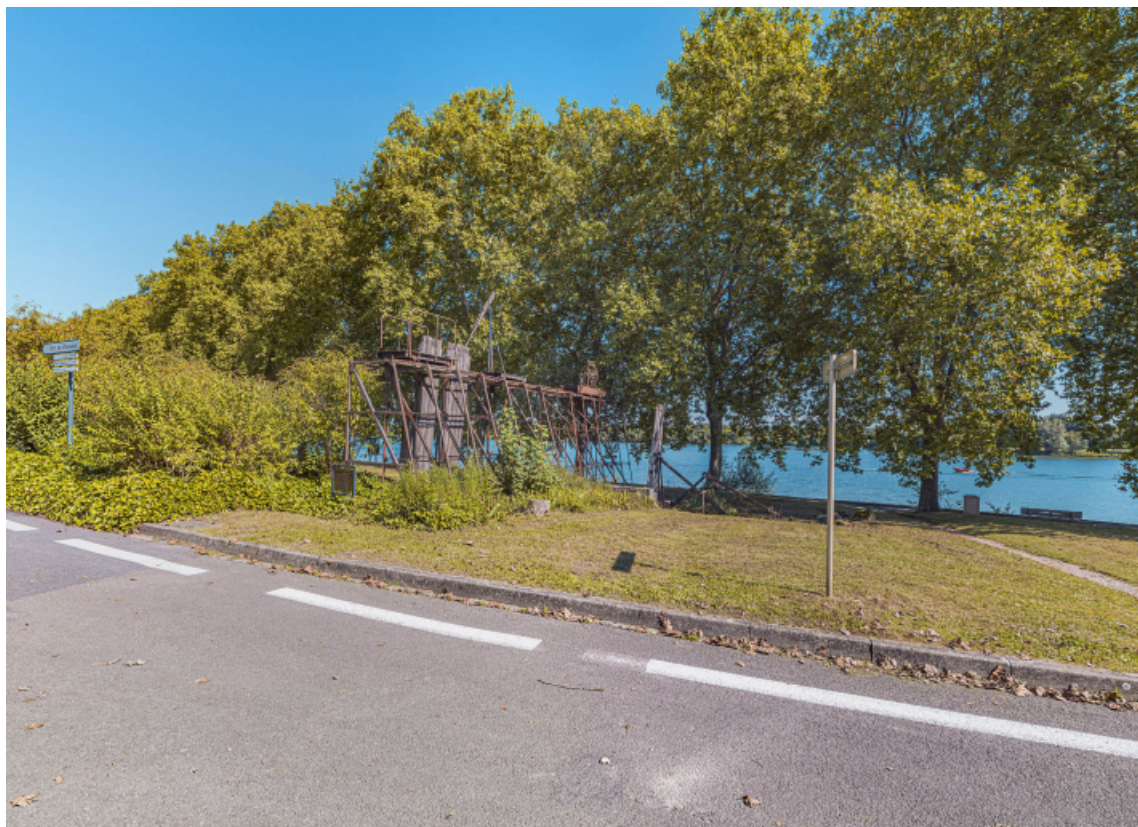
Les vestiges de l'ancien barrage de Thoisy à Mâcon.