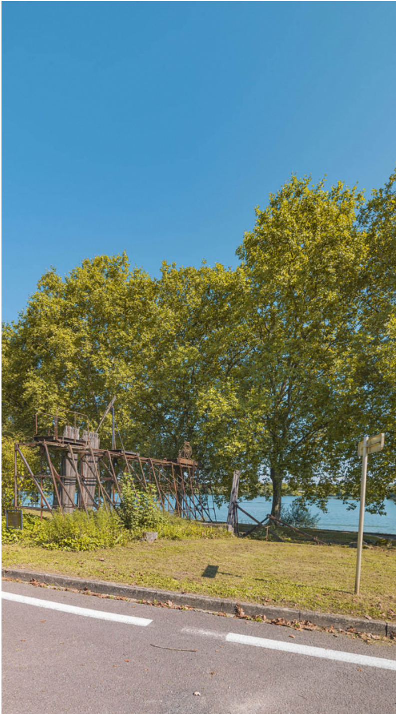
Les vestiges de l'ancien barrage de Thoissey à Mâcon.