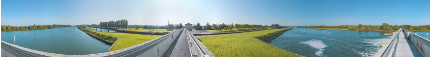
Panorama du site d'écluse depuis la passerelle du barrage.

71, Ormes rue du Sablé, lieudit : PK 119