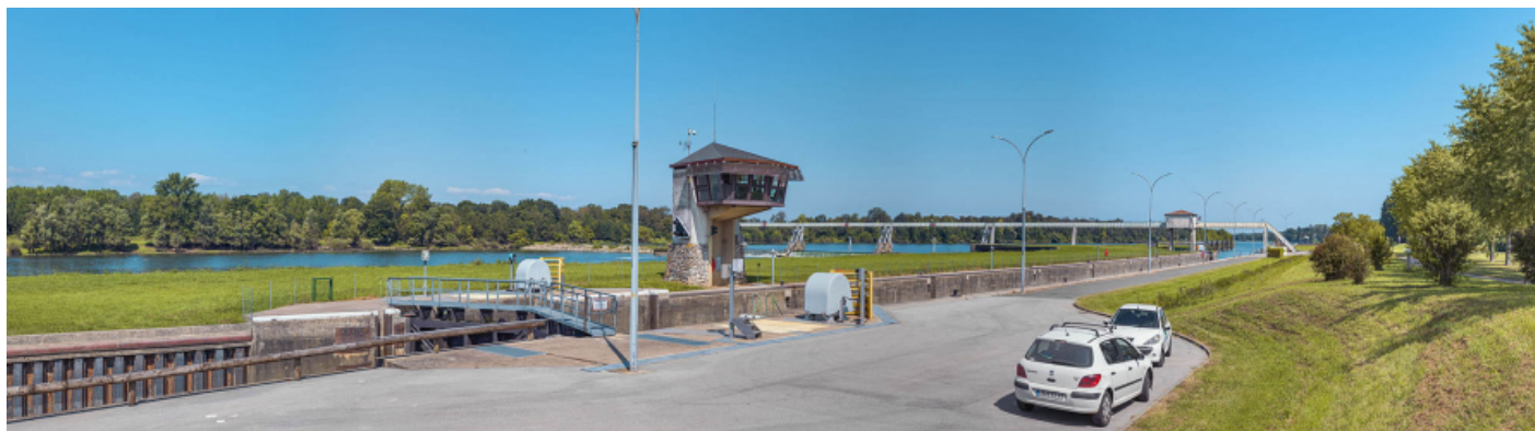
Portes aval de l'écluse et poste de commande au centre.

71, Ormes rue du Sablé, lieudit : PK 119