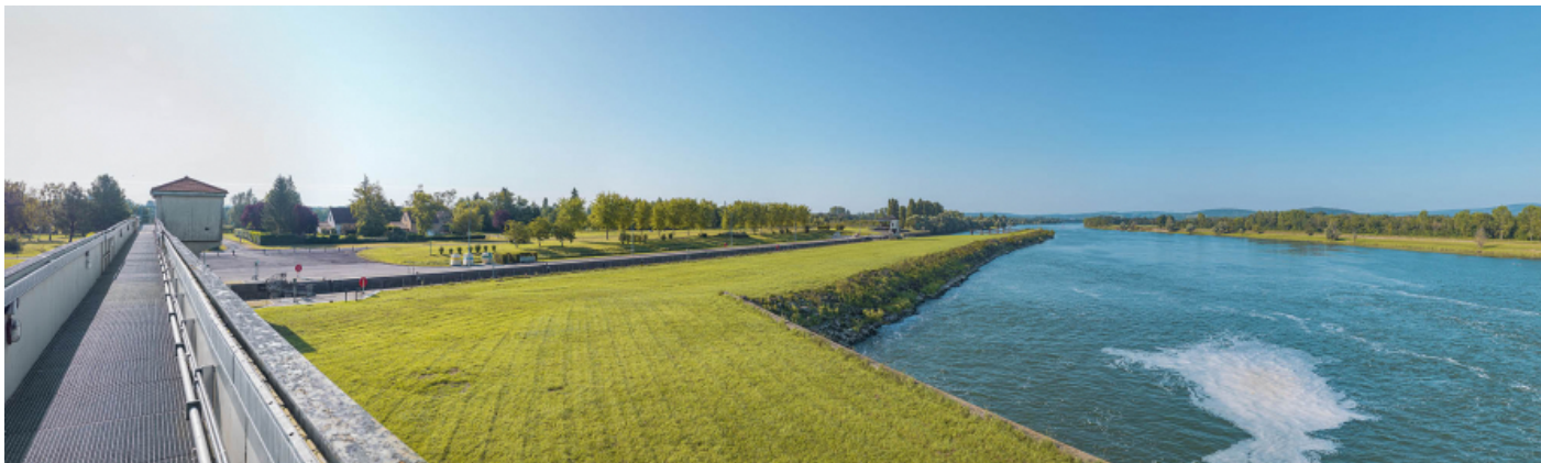
L'aval du site d'écluse vu depuis la passerelle du barrage.

71, Ormes rue du Sablé, lieudit : PK 119