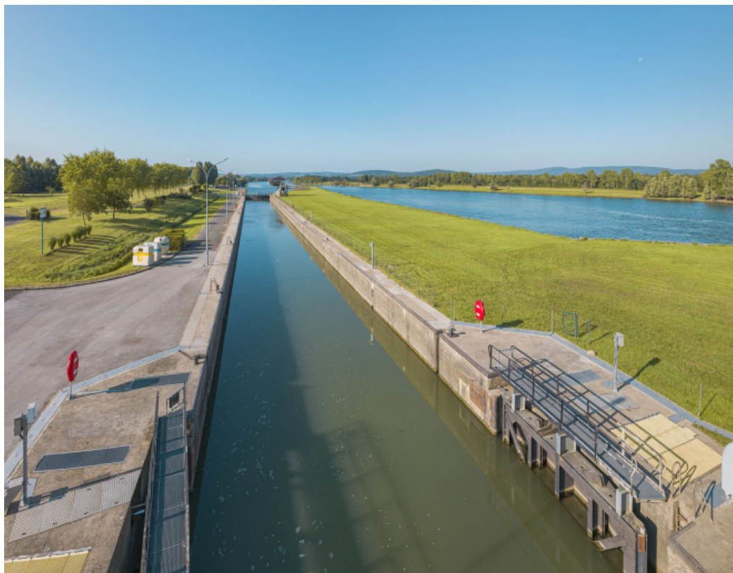
Le sas vu depuis la passerelle du barrage.

71, Ormes rue du Sablé, lieudit : PK 119