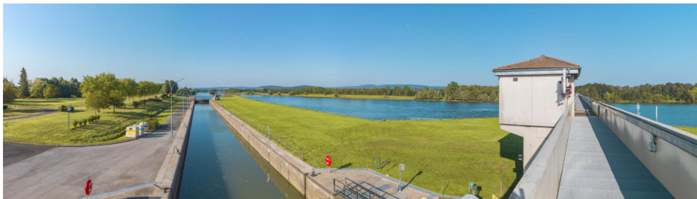
Le sas à grand gabarit, vu depuis la passerelle du barrage.

71, Ormes rue du Sablé, lieudit : PK 119