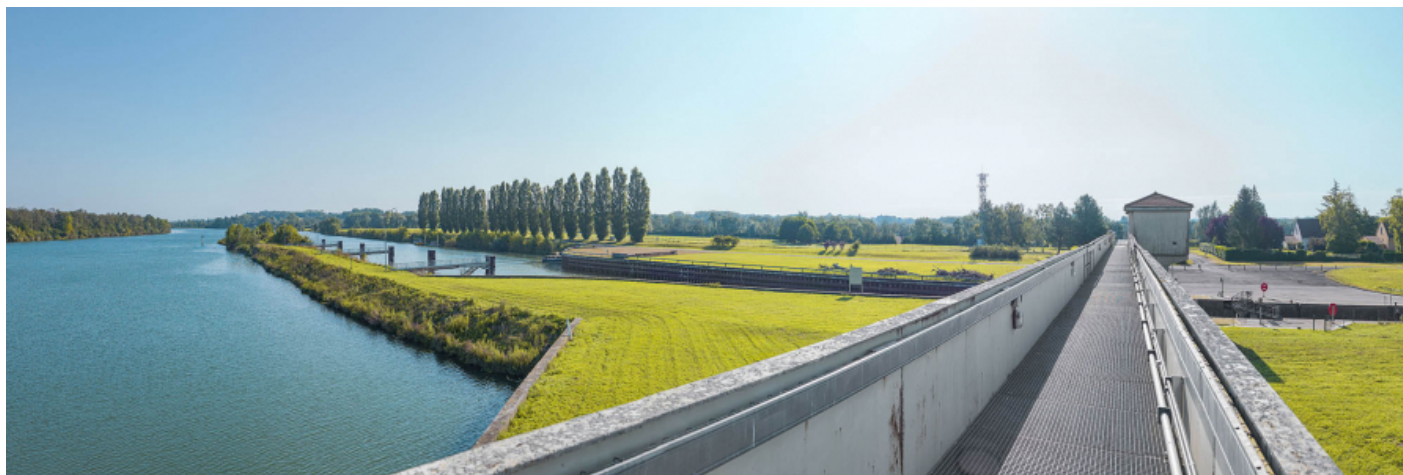
L'amont du sas vu depuis la passerelle du barrage.

71, Ormes rue du Sablé, lieudit : PK 119