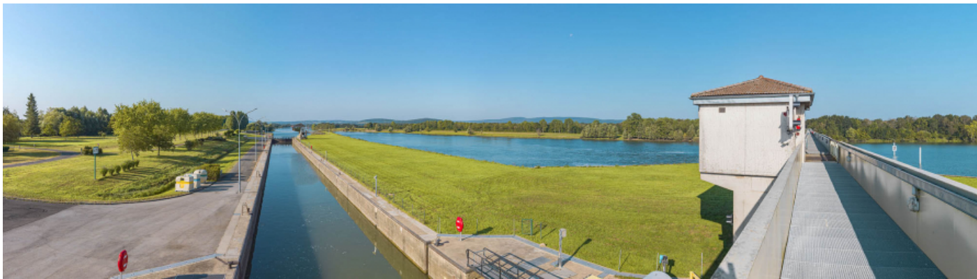
Le sas à grand gabarit, vu depuis la passerelle du barrage.

71, Ormes rue du Sablé, lieudit : PK 119