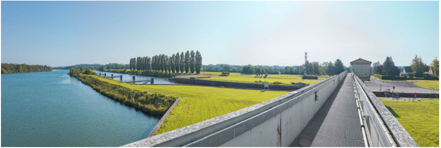
L'amont du sas vu depuis la passerelle du barrage.

71, Ormes rue du Sablé, lieudit : PK 119