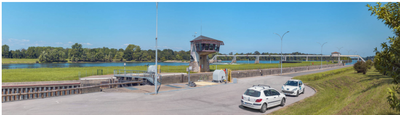
Tête aval de l'écluse et poste de commande au centre.

71, Ormes rue du Sablé, lieudit : PK 119