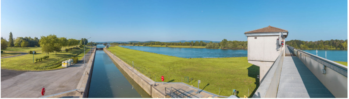
Le sas à grand gabarit, vu depuis la passerelle du barrage.

71, Ormes rue du Sablé, lieudit : PK 119