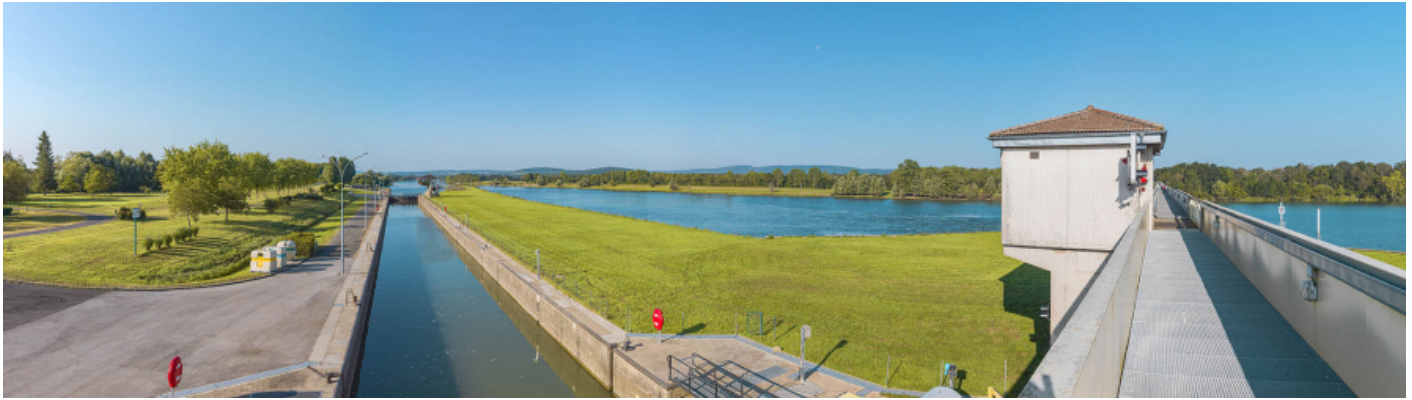
Le sas à grand gabarit, vu depuis la passerelle du barrage.

71, Ormes rue du Sablé, lieudit : PK 119